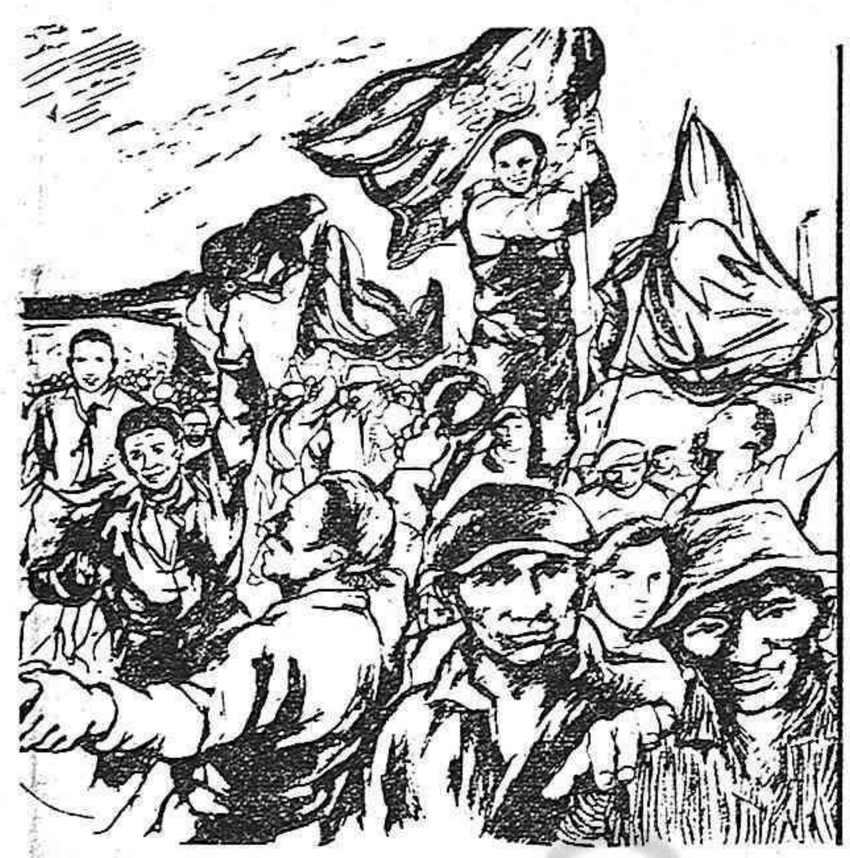
Trabajadores de los países coloniales y semicoloniales!

Exijan la supresión de las leyes antiobreras y antisindicales.