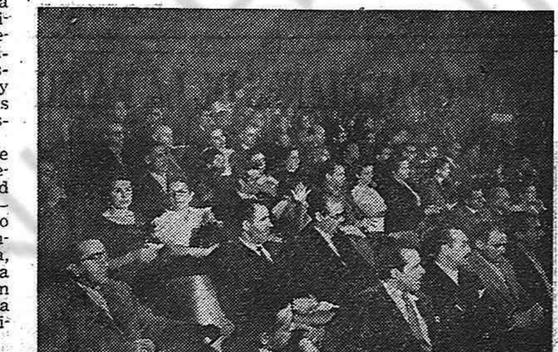
Una vista de la sala donde una numerosa concurrencia de españoles antifranquistas dió prueba de su fervor republicano y unitario.

El doctor Honorato de Castro, se refirió a la importancia de deshacer la propaganda franquista que, continuamente, tergiversa los propósitos y realizaciones de la República española. Hizo referencia a las bases de creación del Frente Popular, ejemplo de las posibilidades de la unidad para defender la democracia y se refirió a los crímenes de los falangistas en la época anterior al alzamiento de los traidores al pueblo español.