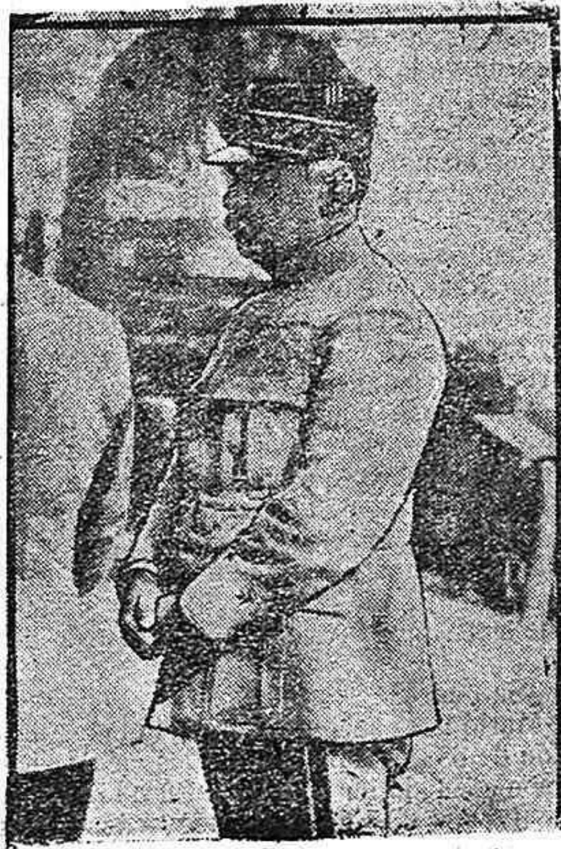
De la guerra.—El general Leconte

Los Estados Unidos han sido los primeros en castigar el «chantage» alemán, cortando toda relación diplomática y desafiando el bloqueo con el envío de dos trasatlánticos a Burdeos.