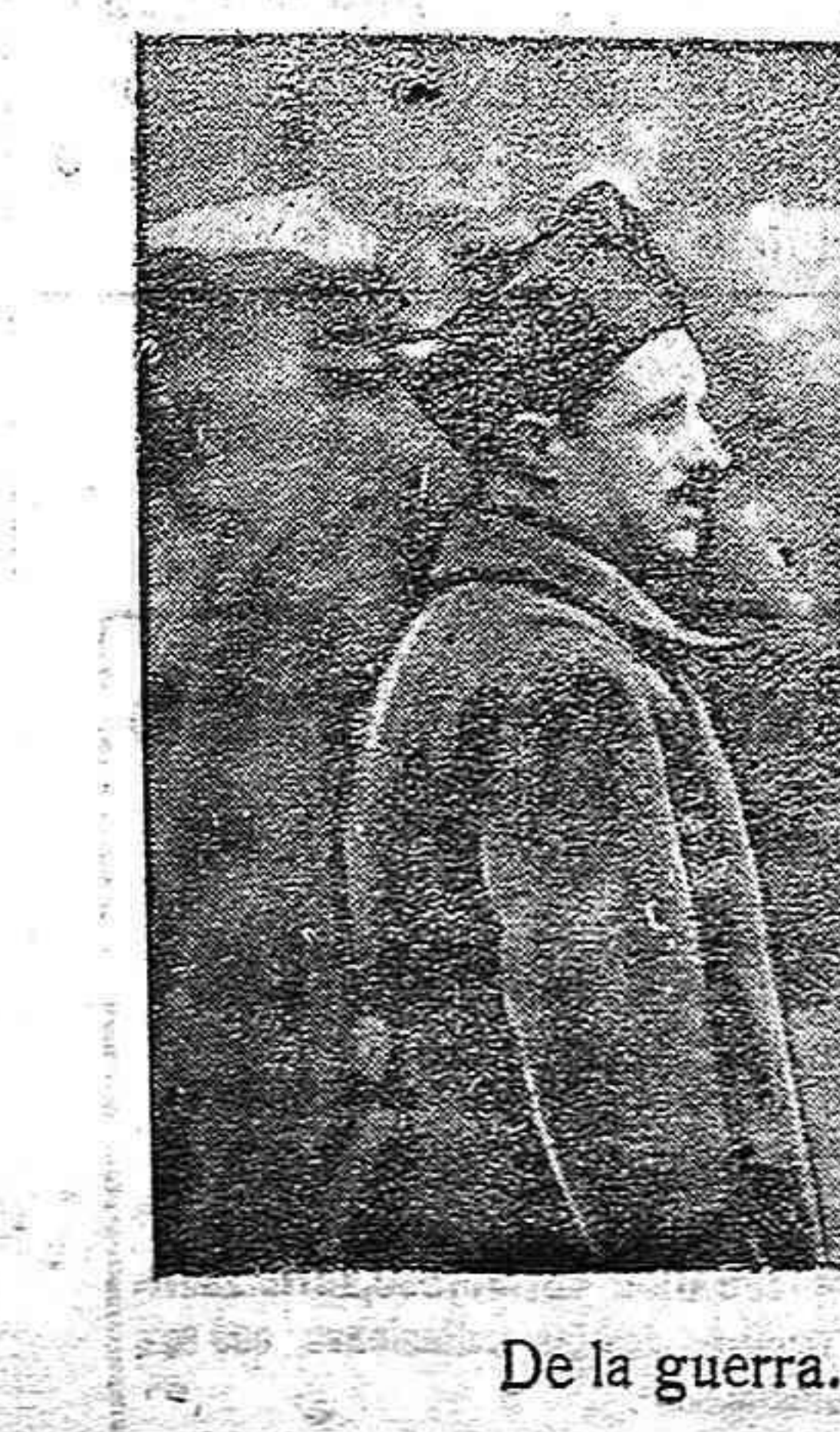
De la guerra.—Periodistas neutrales

El defensor solicitó la revisión del proceso, negándole el Tribunal de derecho. El procesado al oír la sentencia sufrió un síncope, reponiéndose poco después. El acusado se ha negado a firmar la sentencia.