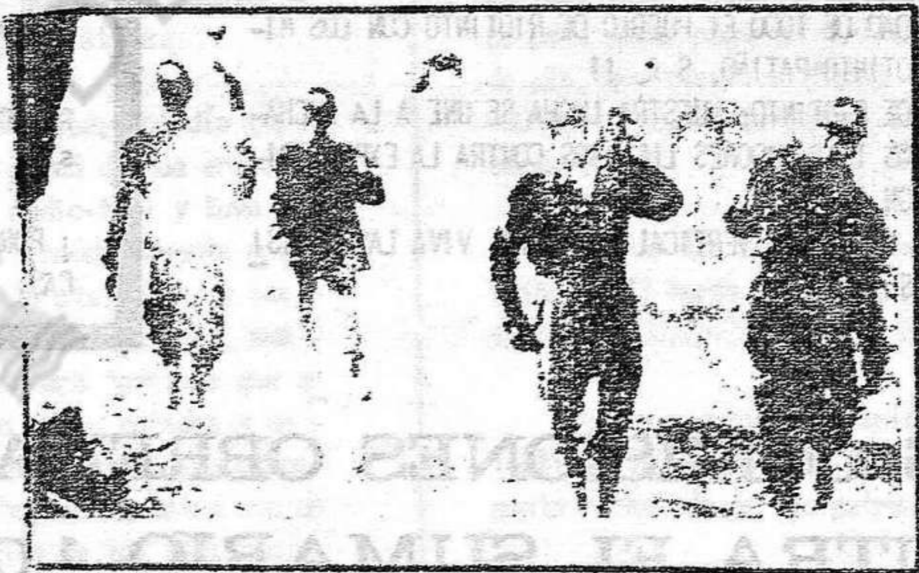
SU LUCHA UNIDA, DIARIA Y CONSTANTE LES LLEVARÁ A LA VICTORIA

El día 5 mantuvieron la misma forma de lucha, además de hacer un boicot a los autobuses. El día 7 la empresa, sin tener en cuenta las reivindicaciones de los trabajadores dice que "concede" lo pactado en el Convenio, además de dar en el segundo año del convenio el incremento del coste de la vida según se fije por el INE (dependiente de la Presidencia del Gobierno y por tanto fija cifras erróneas). Ante esto los trabajadores deciden continuar su lucha y no doblegarse ante las maniobras de la empresa, manteniendo en todo momento la unidad. En los días siguientes continúan las acciones de lucha. El día 9, en asamblea, se informa de la negativa de la empresa y se realiza una marcha hasta Riotinto; el 10, 5 horas de sentada y boicot a los autobuses; el día 13 concentración, asamblea y marcha hasta las oficinas generales donde se permaneció sentados hasta las 17 horas; posteriormente se manifestaron hasta el Sindicato Vertical Fascista; el día 17 concentración en los vestuarios y marcha -