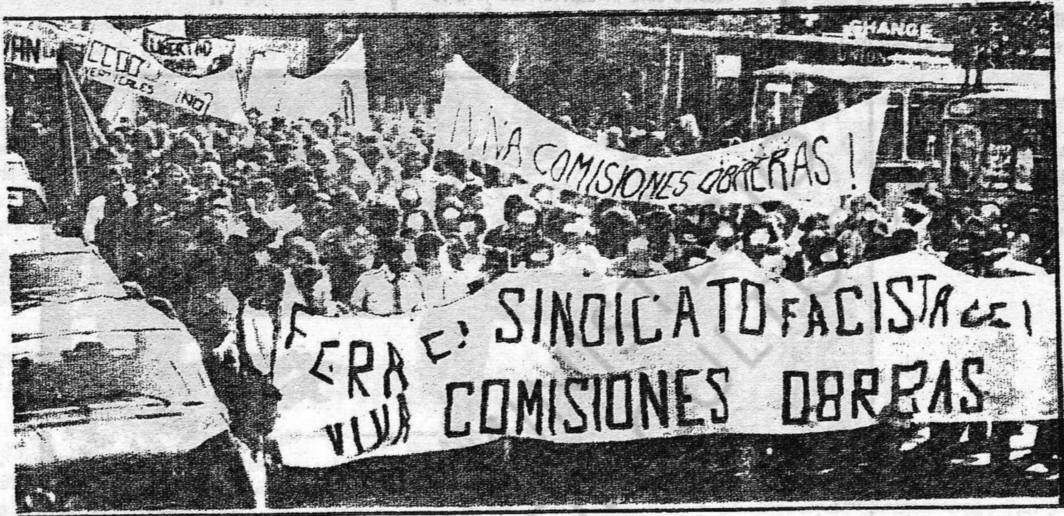
MOMENTO DE LA MANIFESTACION. LA LUCHA CONTRA EL SINDICATO VERTICAL FASCISTA ESPAÑOL ES LA AFIRMACION ENTUSIASTA DE LAS COMISIONES OBRERAS.

Una vez más, se muestra la gran combatividad del pueblo español, que