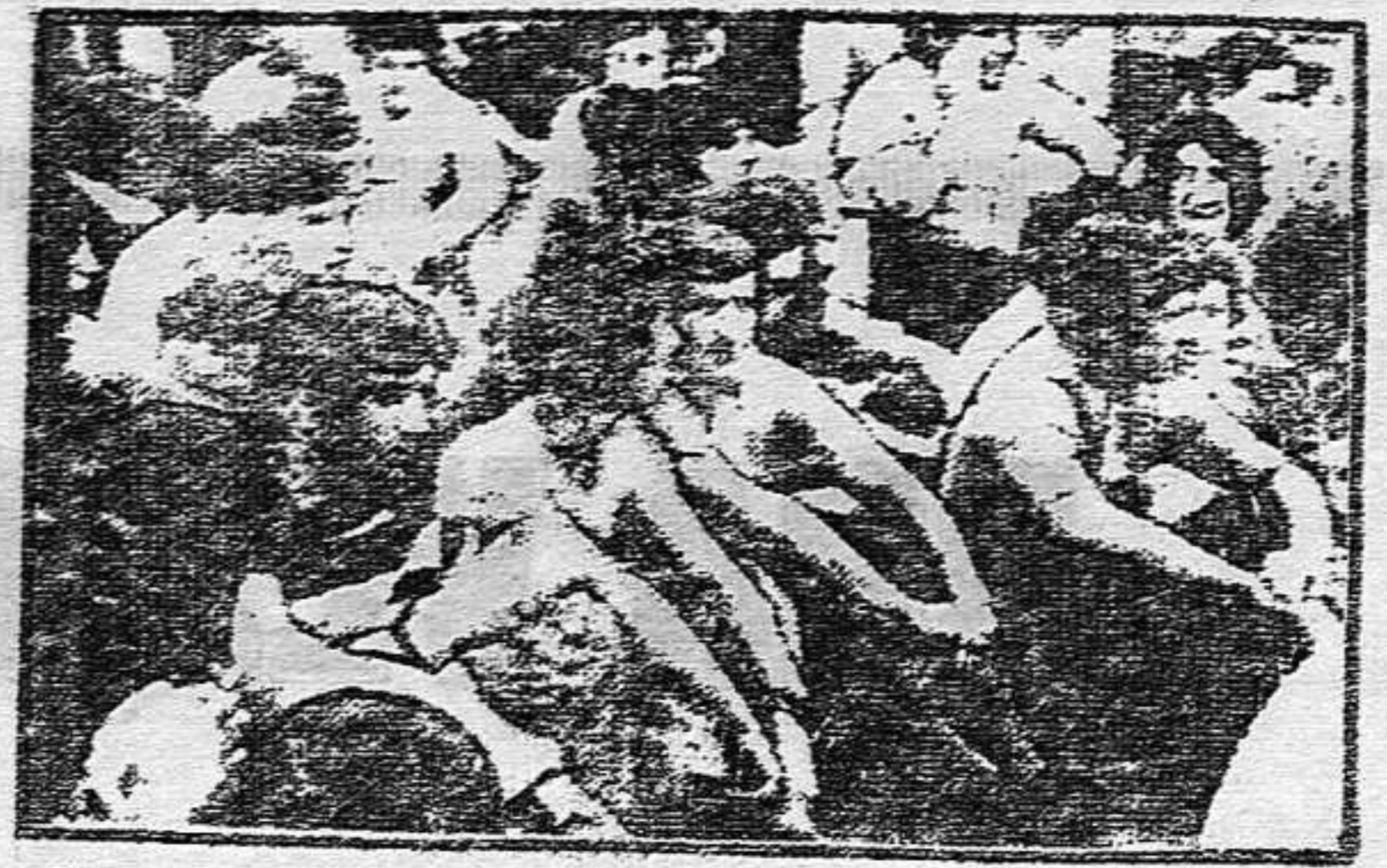
"SENTADA" DE LOS TRABAJADORES DE HELLA A LA PUERTA DE LA FABRICA.

Recientemente los países de Europa han comprobado la combatividad de los trabajadores españoles. Estos han protagonizado muchas e importantes luchas. De entre todas ellas, destacamos dos especialmente. La lucha llevada a cabo por los trabajadores de Hella, que se encuentra en la localidad de Lippstadt en Alemania, donde, después de 4 días de huelga, han logrado una importante victoria, y la manifestación de 5.000 trabajadores en Ginebra contra el Sindicato Vertical Fascista.