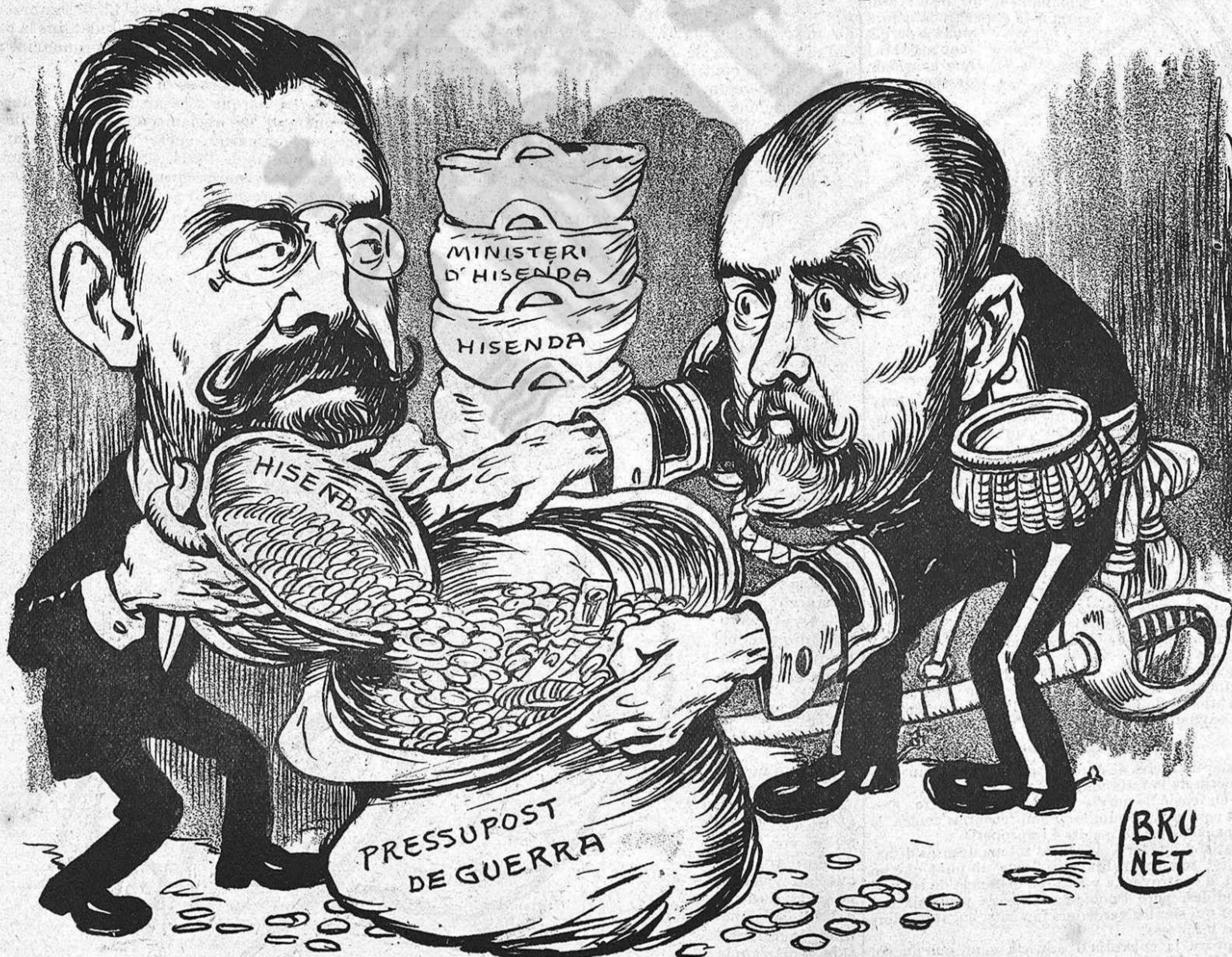
EL MINISTRE D' HISENDA:—Vaja, ¿está content ara?