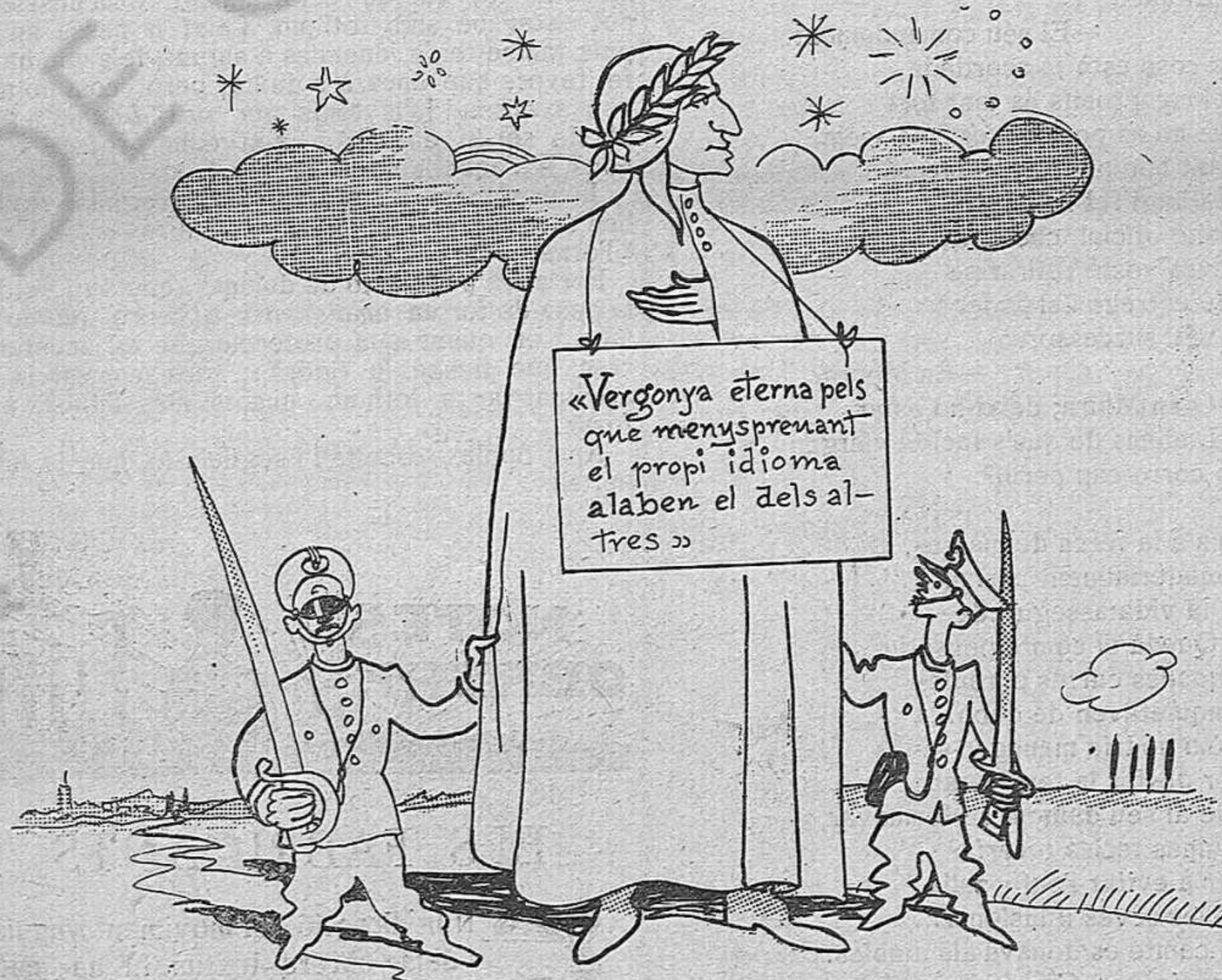
LO DE VILAFRANCA

— Digues..., em sents ara? — Sí, home, calli , que m'aixorda!