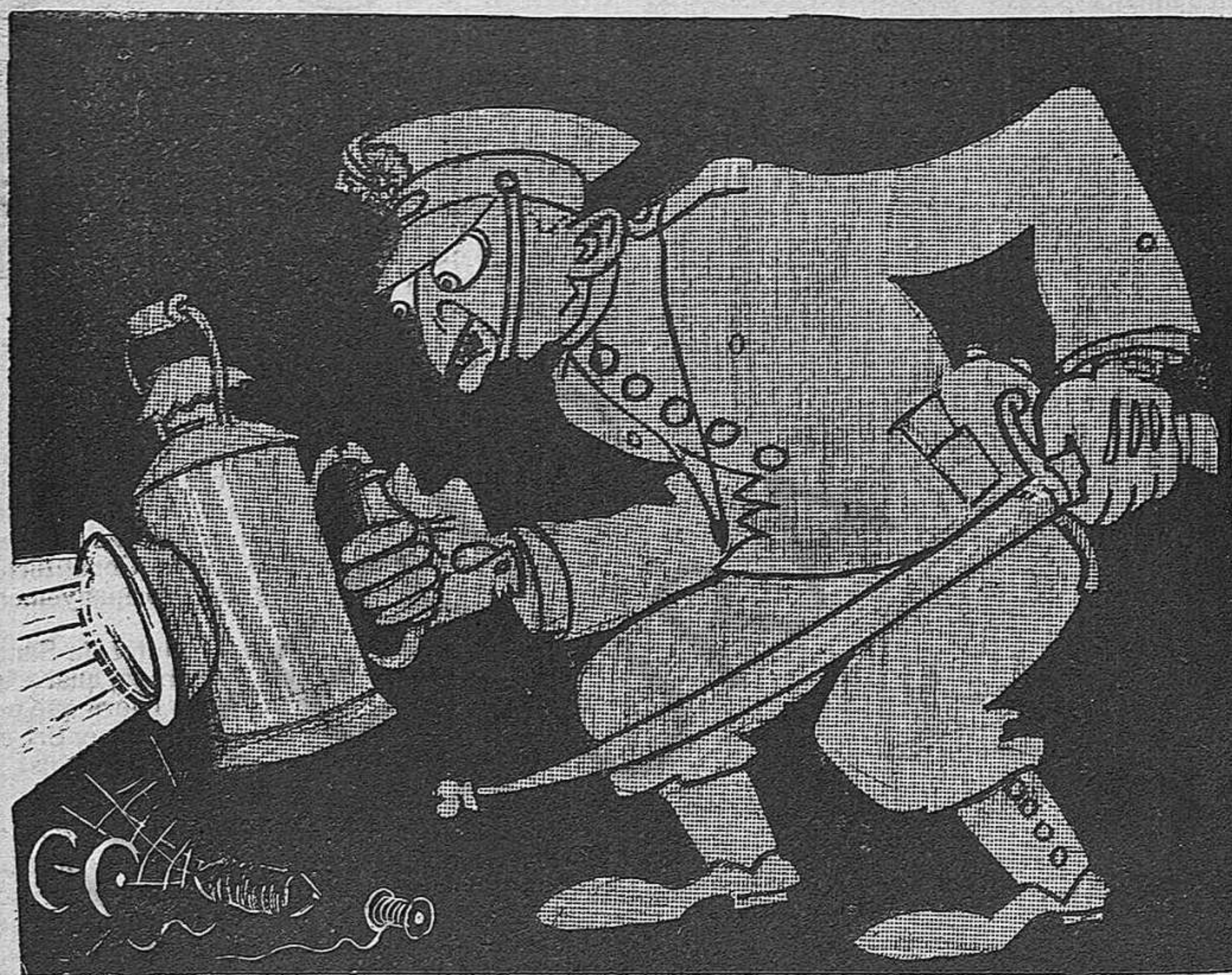
DE LA VAGA, ENCARA

PLAGUES — Ja sab que a Madrid hi hà la verola, eh? — Bé, sí, però, en canvi..., encara tenen en Romanones.