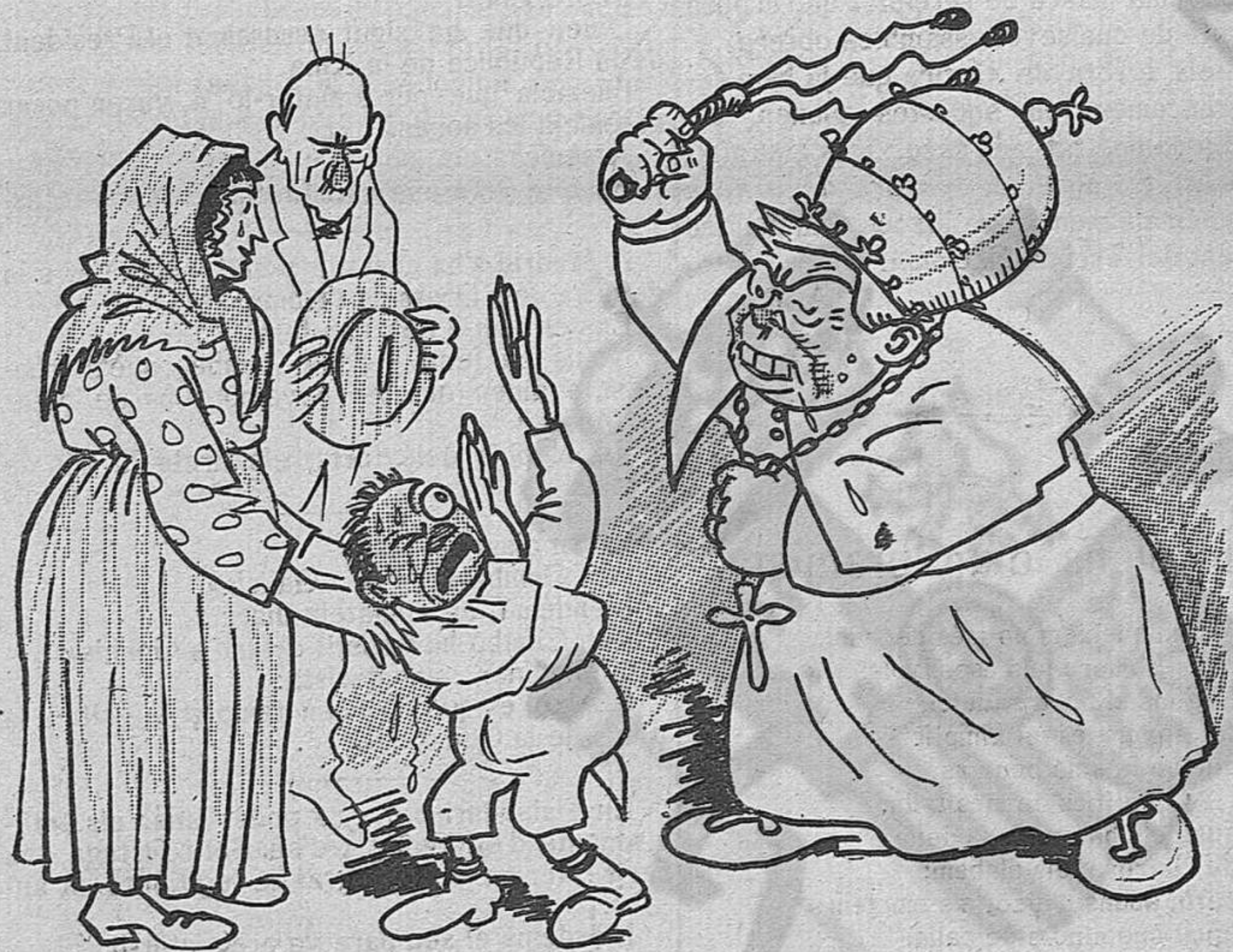
EL SANT PARE CURANT LA SORDERA

Cercant les resquicies dels pertorbadors.