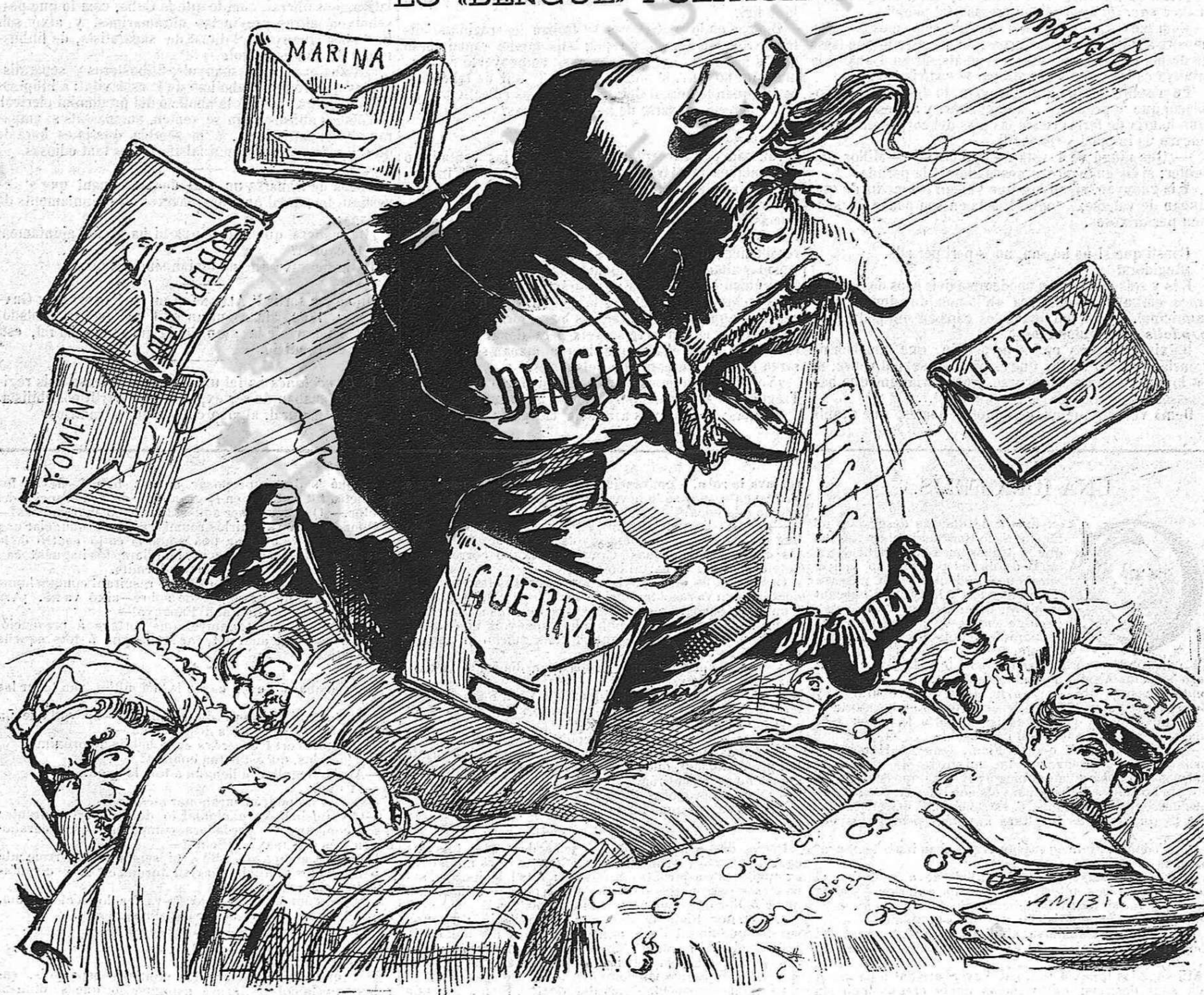
La cansó del estornut... qui gemega ja ha rebut.