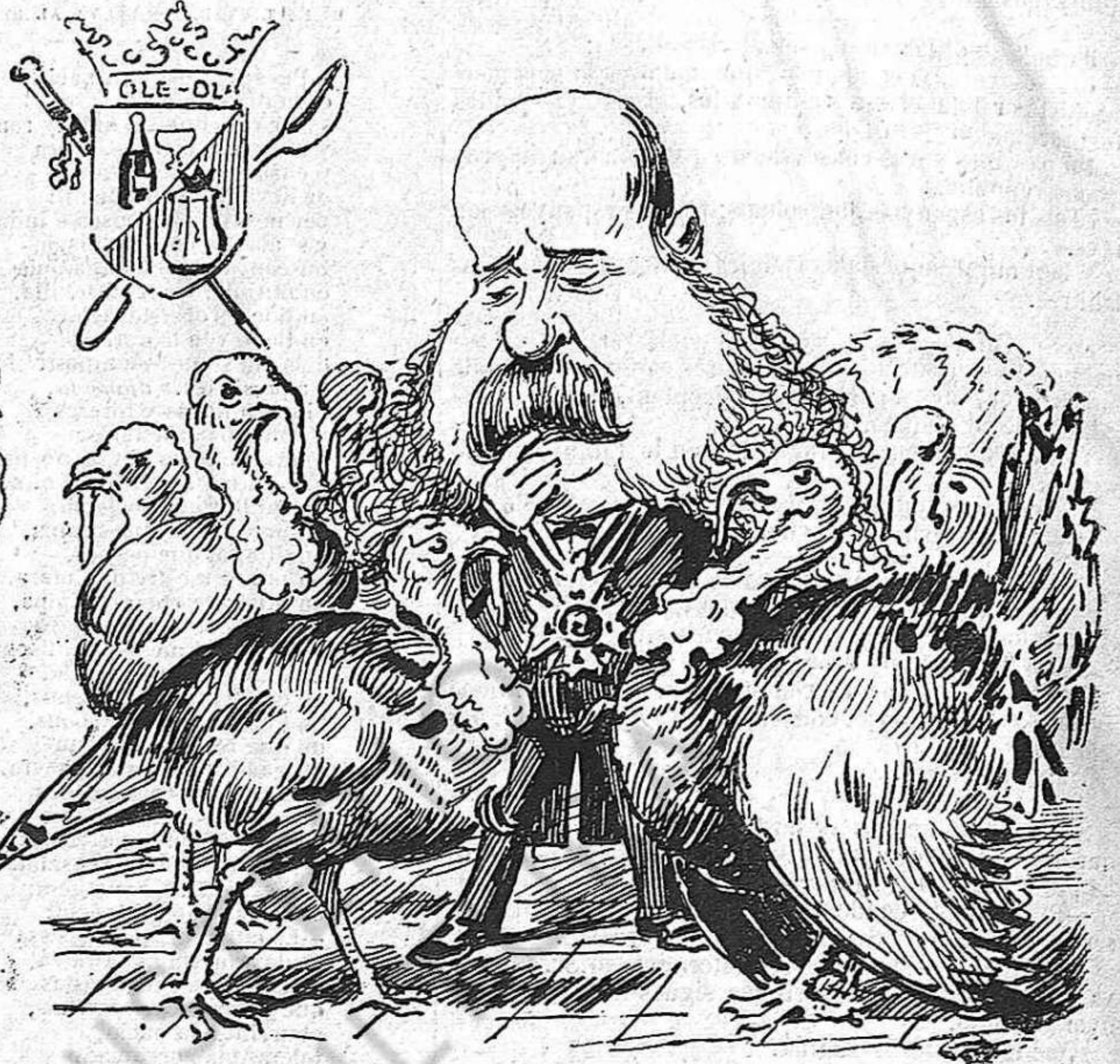
Aquest any encare 'n tè... Pero ¡ay! ¿Y l' any que vè?...

Quan lo metje va dirli:—¿Y donchs, qué tenim, don Antón? —No sé—va respondre—me trobo talment com si hagués passat per Zaragoza.