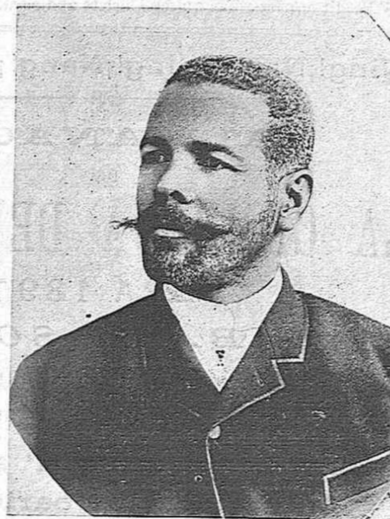
Lo cabecilla mulato ANTÓN MACEO, mort en lo combat de Punta Brava.