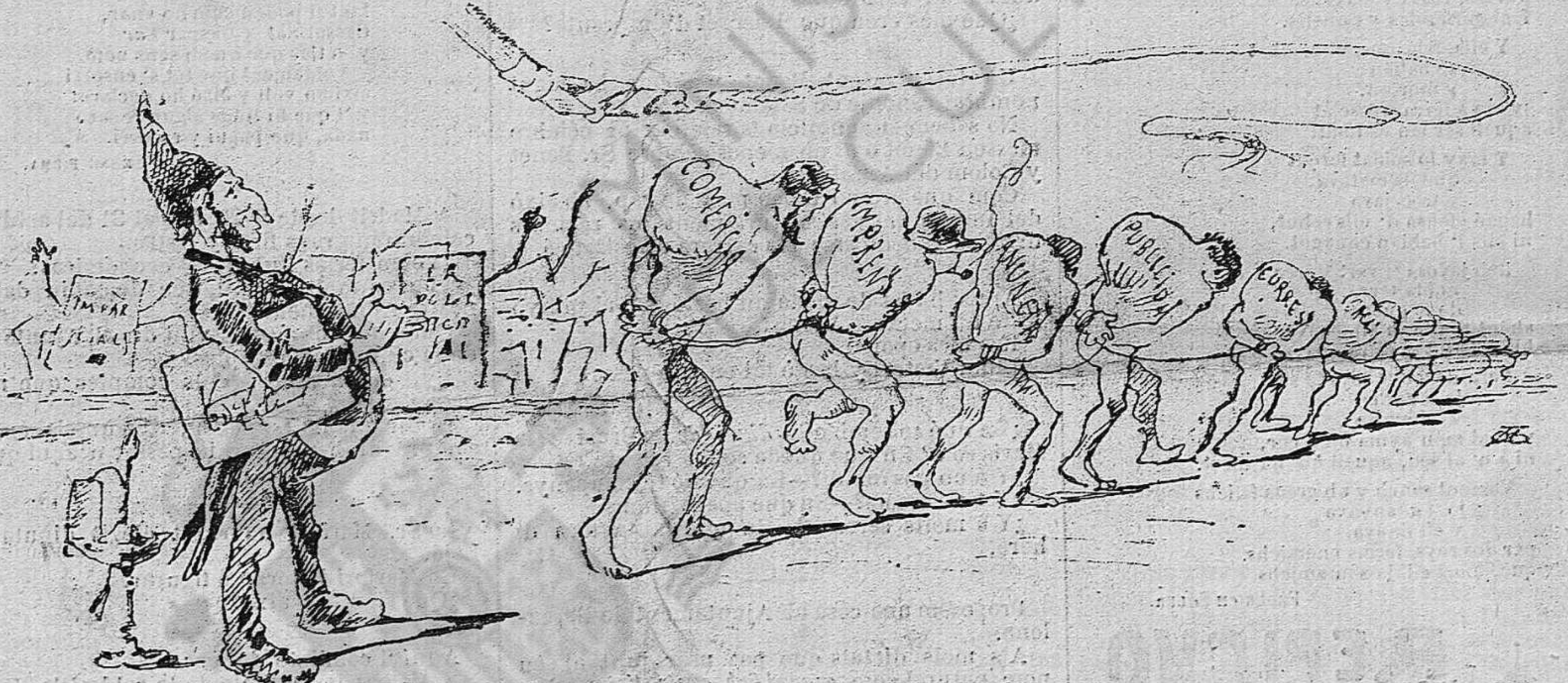
Dels pecats dels poch, los molts ne van geperuts.