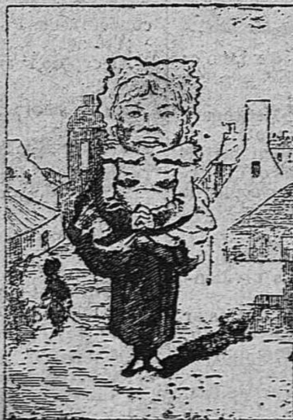
¿Ahont es lo sultan?