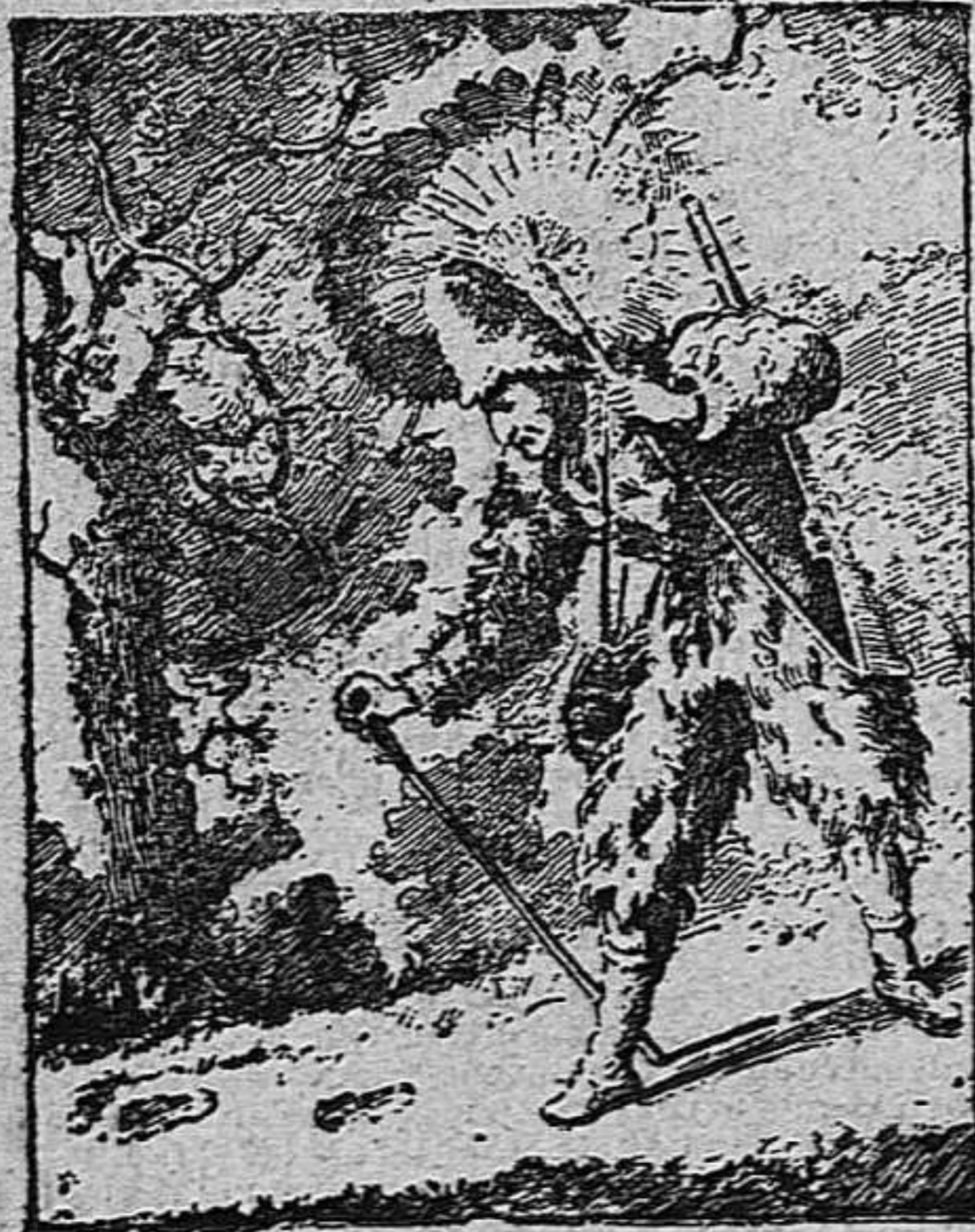
¿Ahont es lo negre de Robinson?