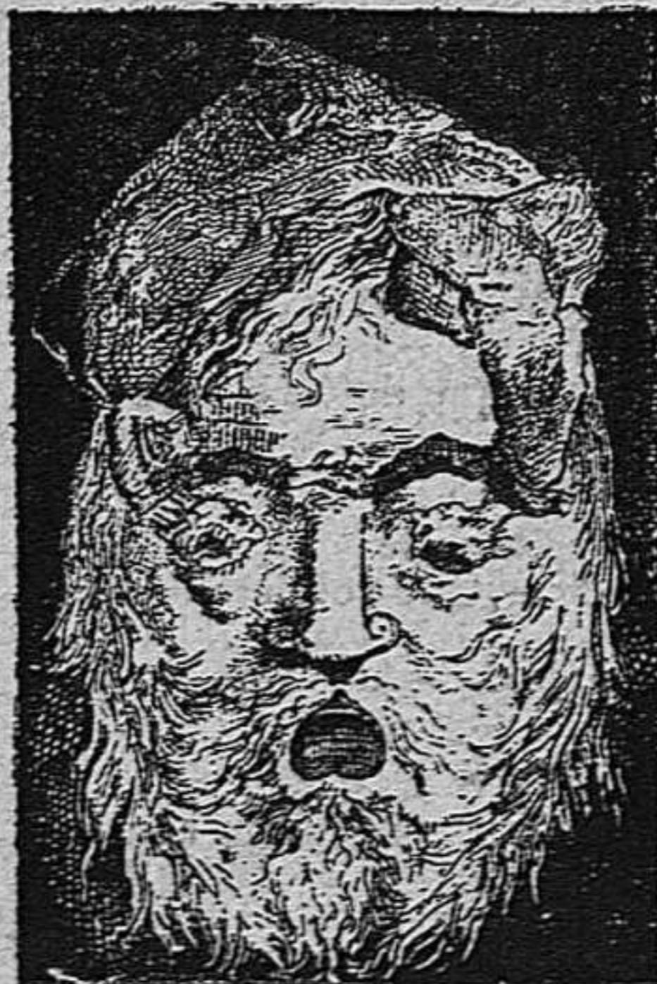
Busquéu als genères que 's casan.