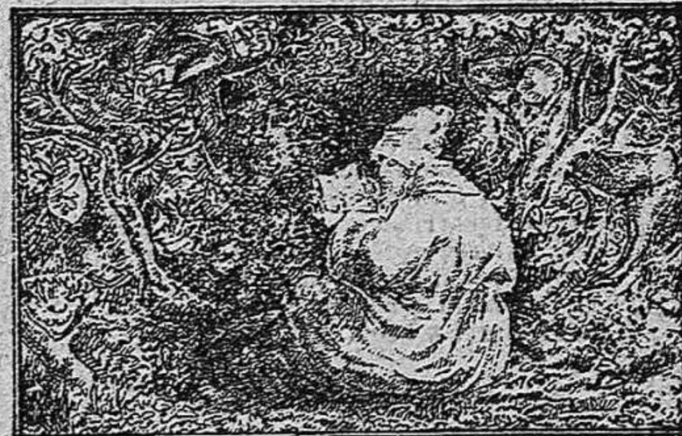
¿Ahont es lo porquet de Sant Antoni?