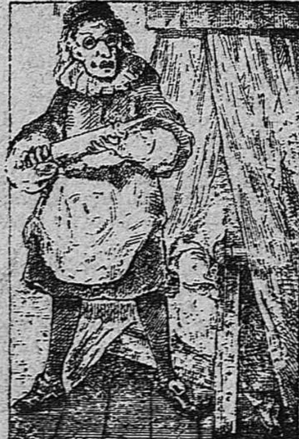
¿Ahont es l' altre?