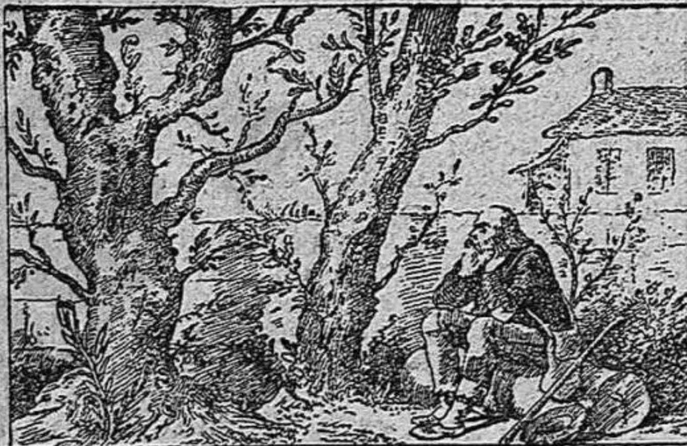
Tenia catorze amichs. ¿Ahont son?