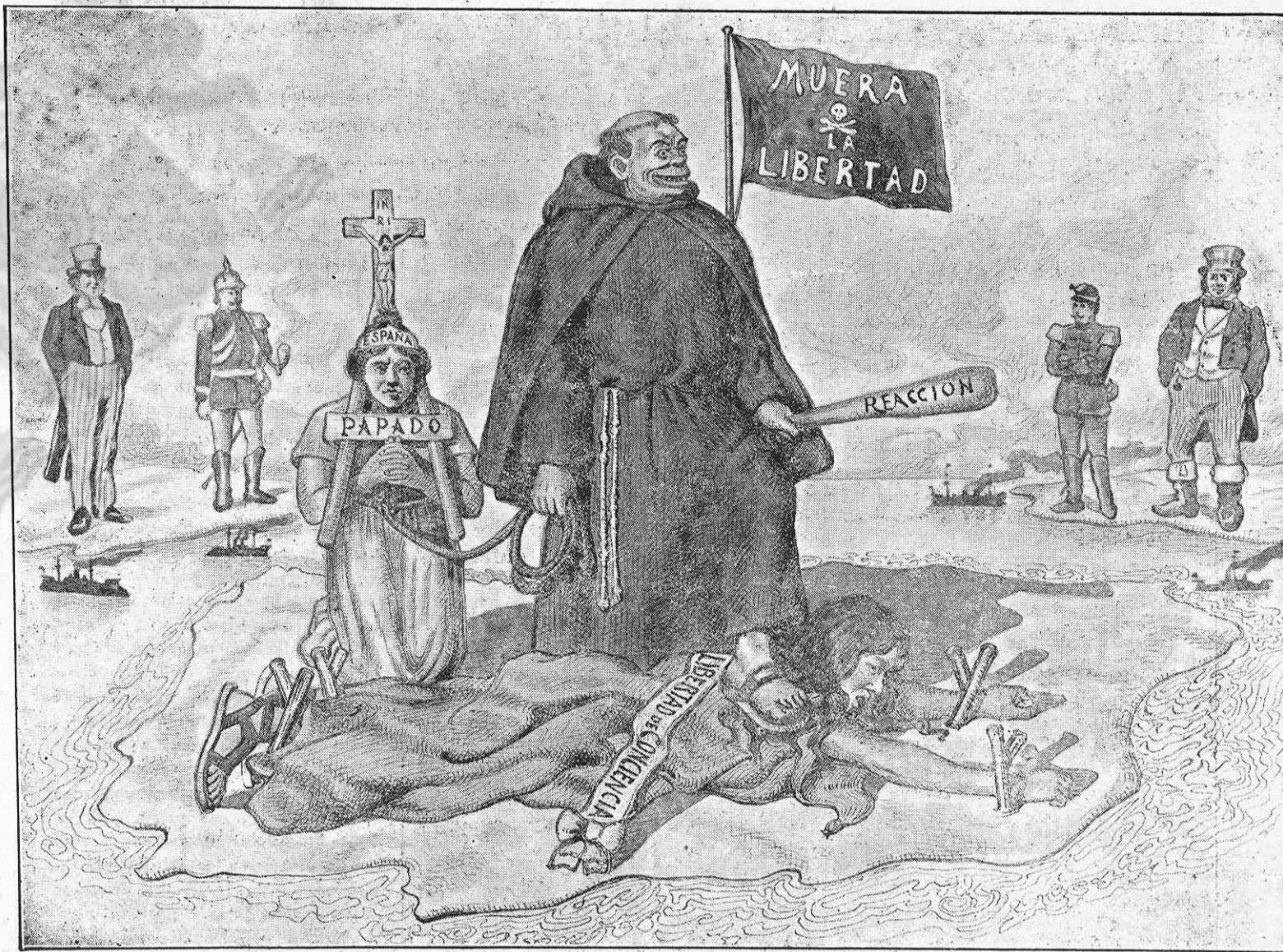
Este es el cuadro macabro y vergonzoso que hubiese presentado el mapa de España ante Europa y el mundo civilizado, de haber triunfado en las pasadas elecciones la reacción. La conciencia española se hallaría sumisa bajo el yugo despótico papal y la reacción la hubiese pisoteado vociferando ¡muera la libertad! La conciencia y la libertad del país han sido gloriosamente rescatadas llevando así la tranquilidad y la satisfacción más absoluta a los espíritus, restableciéndose la justicia y el derecho.