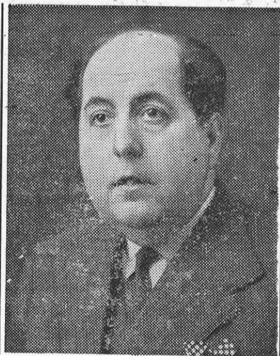
D. José Puig y Pujadas Diputado a Cortes por esta circunscripción

Su llegada a Figueras fué inenarrable y el entusiasmo se desbordó por completo, siendo vitoreado por calles y plazas hasta llegar a su residencia.