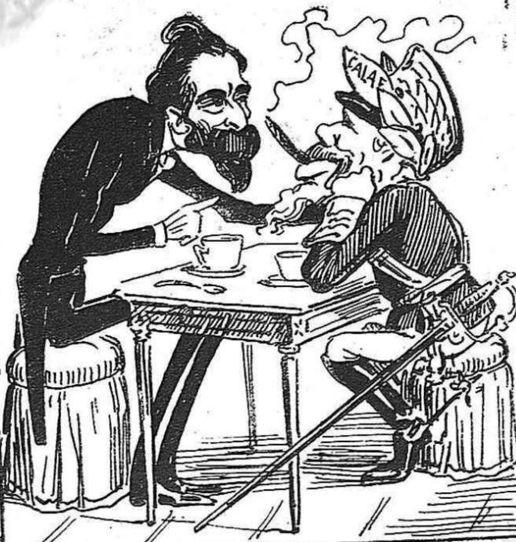
—Ara en confiança: li encarrego que no 'ns aban-doni, y que 'ns recomani á D. Antón.