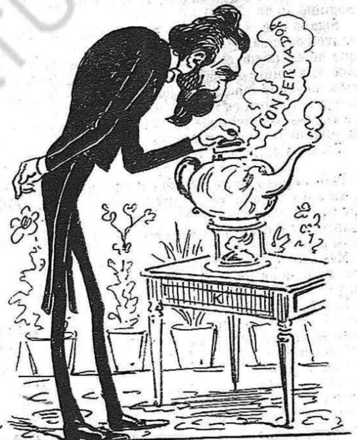
—Ah, ah, ah... Ja ha arrencat lo bull.