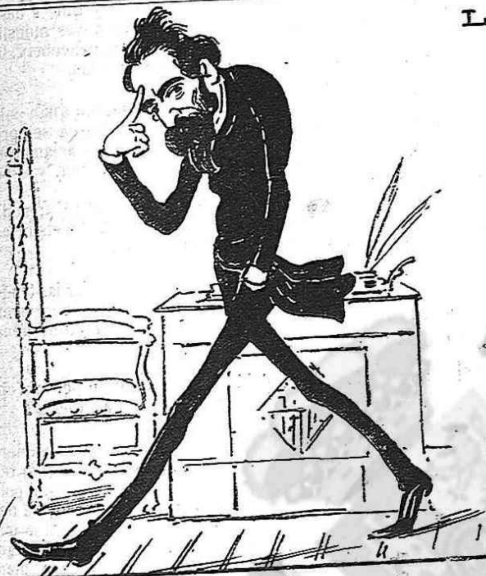
—¿Qué taré ara jo per fer la competencia als liberals? ¡Calla, ja ho tinch!