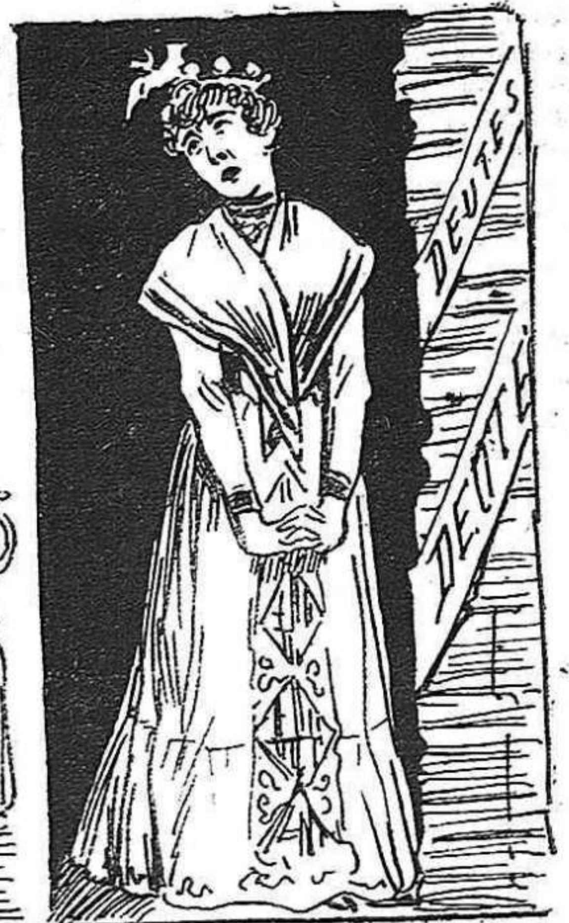
—Resultat: ells se 'l prenen, y á mi ningú 'm convidat!