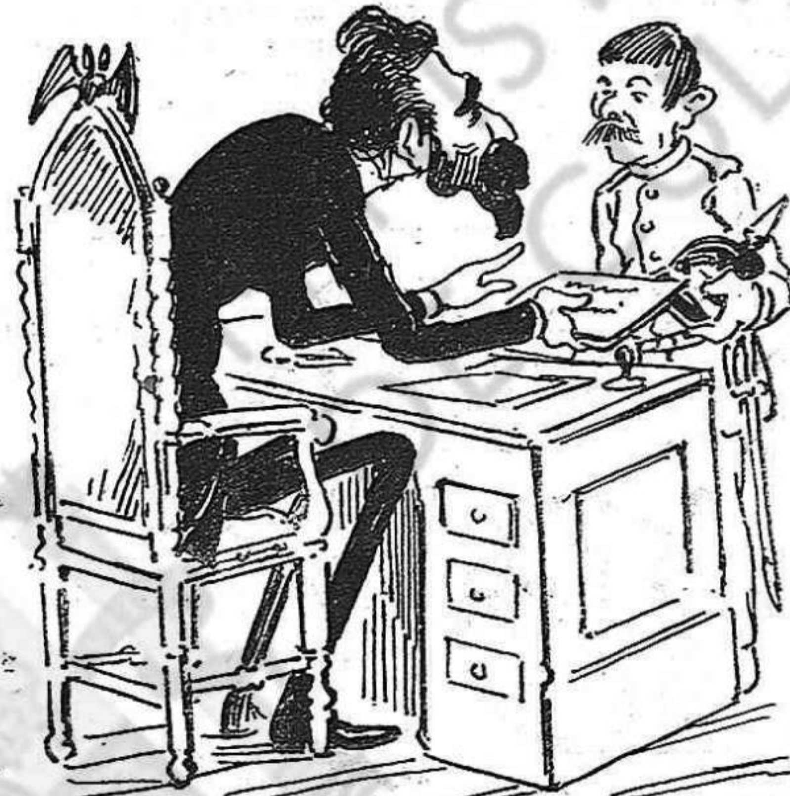
—Xanxas: vaji tot desseguit á comprar tres un-sas de tè y á portar aqueixas cartas: l' una al gene-ral Campos y l' altra al jardiner Oliva.