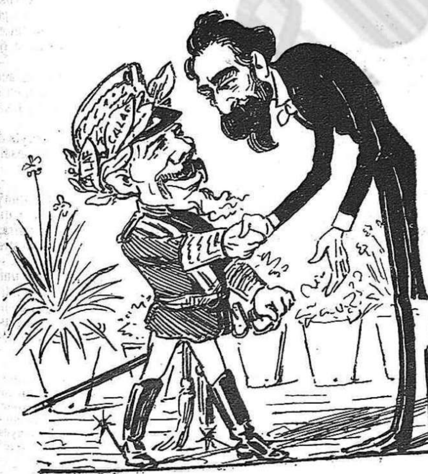
—Com sè que aquesta tarde ha dinat ab los sol-dats, he tingut la idea de convidarlo á un tè perque paheixi.