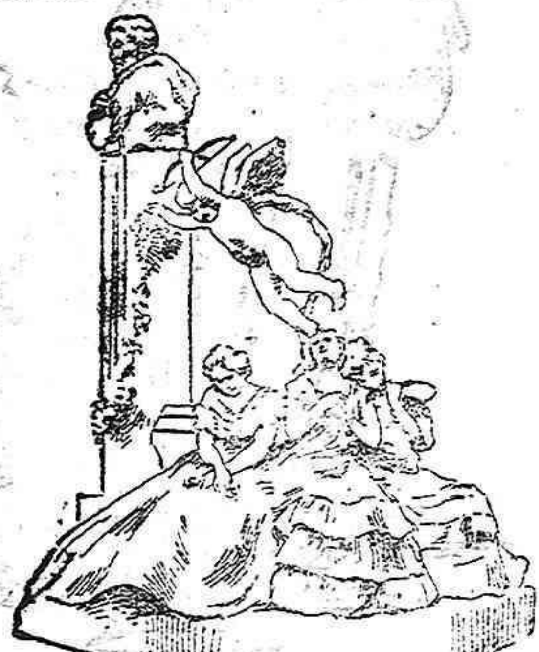
El monumento á Bécquer

El hermoso rasgo de los aplaudidos autores vióse coronado por el más il-