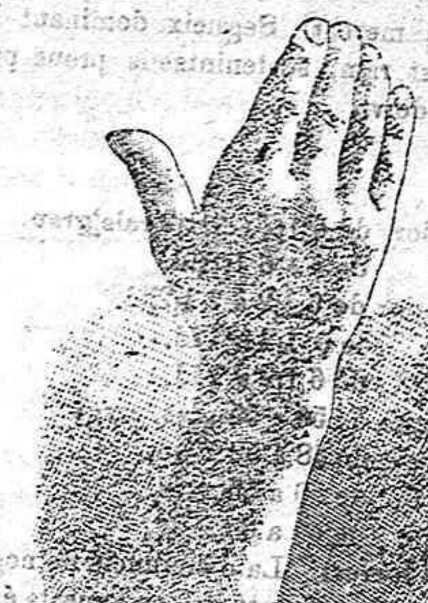
Después de 15 días del tratamiento