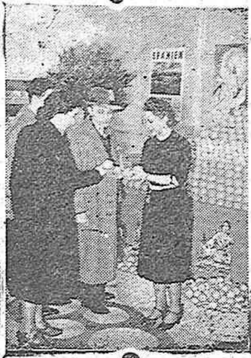
Detalle de la instalación española (frutas)

Budapest, 24.—Horthy fué recibido por el Führer en su Cuartel General. Inmediatamente ha regresado a Budapest. Efe.