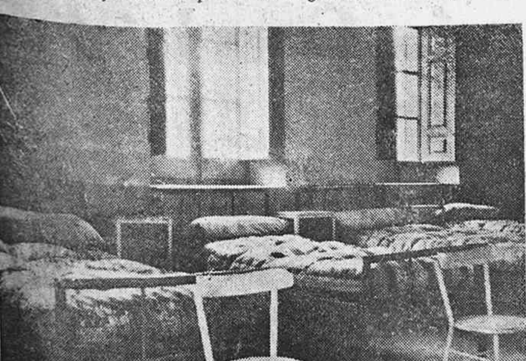
Uno de los dormitorios en el primer piso