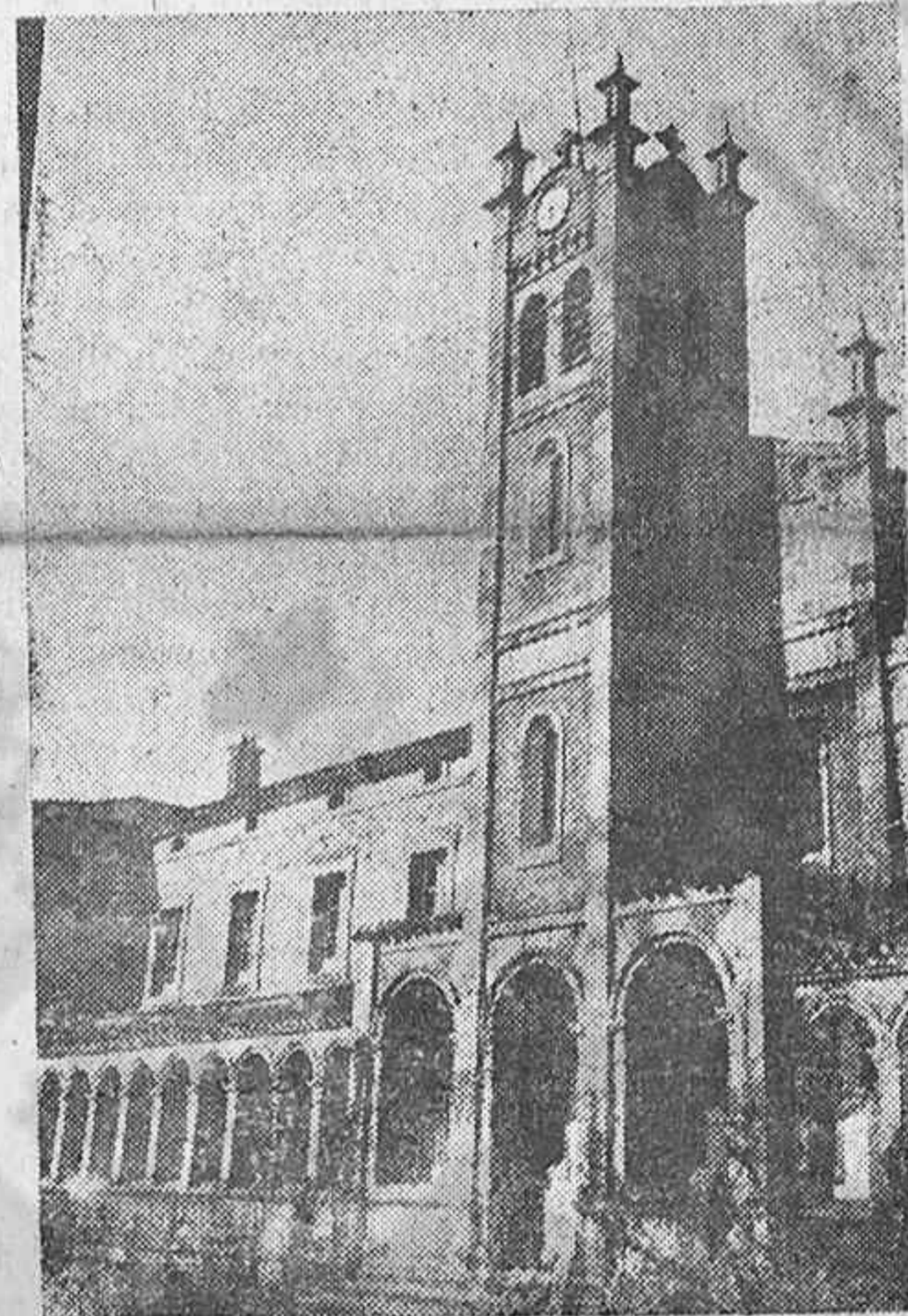
Entrada principal del Sanatorio