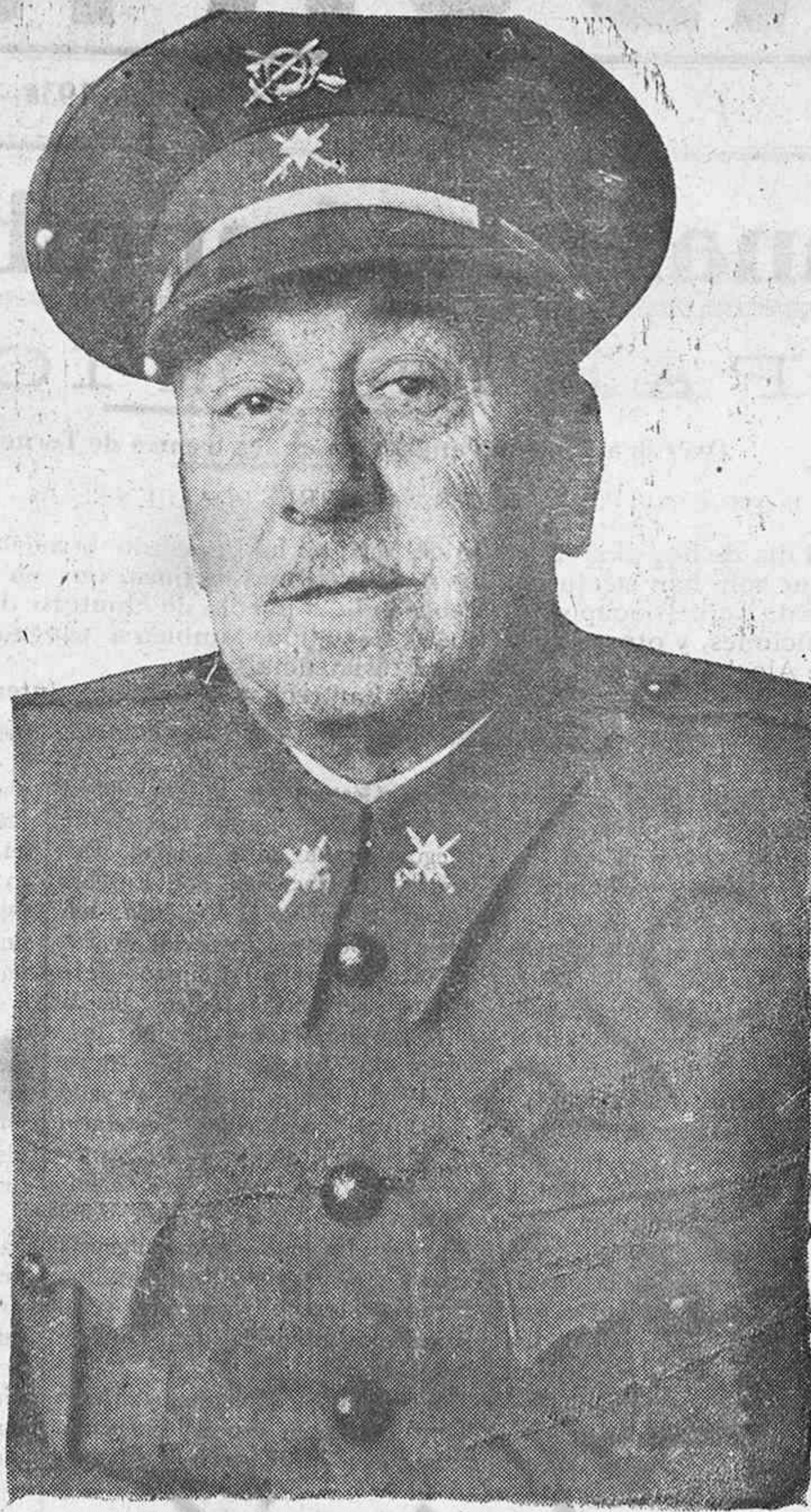
EXCMO. SR. D. JOSE MOSCARDÓ, General Jefe del Ejército de Aragón

vincia, que he de transmitir al Generalísimo. Ha nacido esta obra para realizar el propósito de atender perfectamente a los enfermos tuberculosos que en el país ascienden a más de 30.000, que se hallan ya hospitalizados y dificultan la asistencia de los soldados heridos o enfermos a los cuales es necesario atender con el mayor esmero, como así lo desea nuestro Generalísimo. Se trata de instalar 100 enfermos tuberculosos de cada provincia en Sanatorios especiales, reservando el 25 por 100 de las plazas para los inutilizados en la guerra. Ensalza la conducta de los patronos de las fundaciones García Verde y el proceder del Gobernador civil, que es tan bueno, con lo cual se ha conseguido lo que se deseaba, merced también a los donativos excepcionales que han concedido los sorianos. Todos han dado lo que han podido y el Estado cederá cuanto se le pida. Felicita al Gobernador civil, al Comité Provincial y dedica cariñosas frases al heroico General Moscardó manifestando que donde va este General resplandecen las glorias de España porque sacrificó sus mayores afectos y dió a la Patria cuanto ésta le podía exigir. Dedica también un cariñoso recuerdo al Ejército dirigido por el Generalísimo y termina diciendo: ¡Viva España! ¡Viva Franco! ¡Viva el héroe de Toledo! ¡Arriba España! Estos vivas fueron contestados con caluroso entusiasmo.