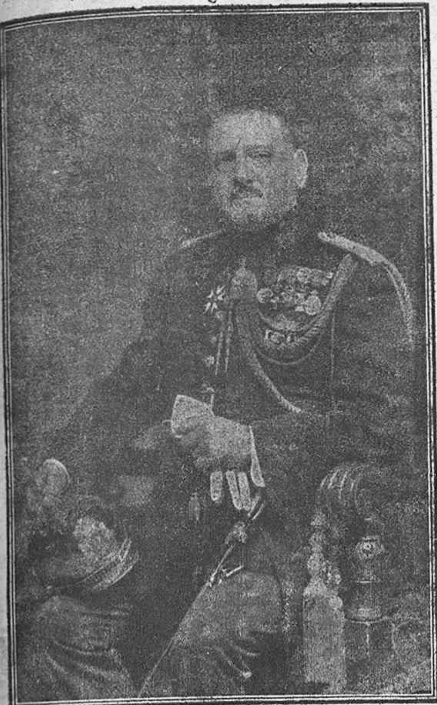
Excmo. Sr. D. Severiano Martínez Anido Ministro de Orden Público

En Cataluña, sector de Llavorsí, se han rechazado algunos intentos de ataques enemigos.