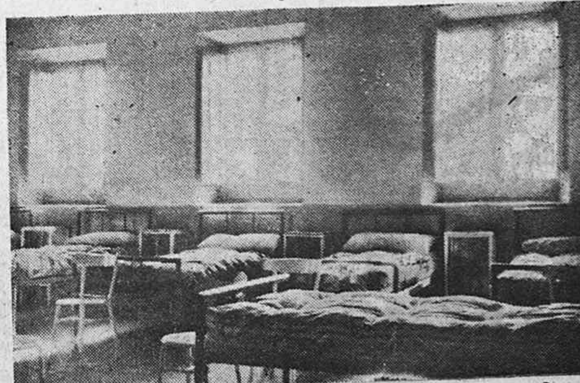
Otra sala de enfermos en el segundo piso.

Poco antes del mediodía, la campana colocada en la torre del edificio y los toques de atención del