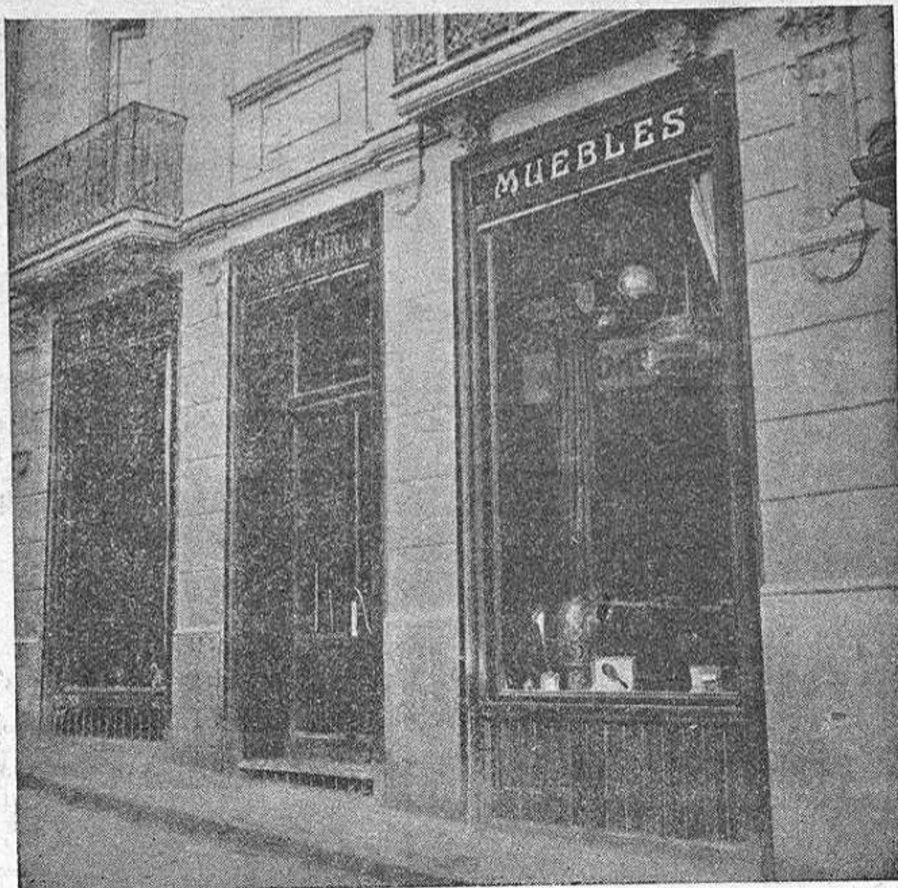
Vista exterior de este establecimiento