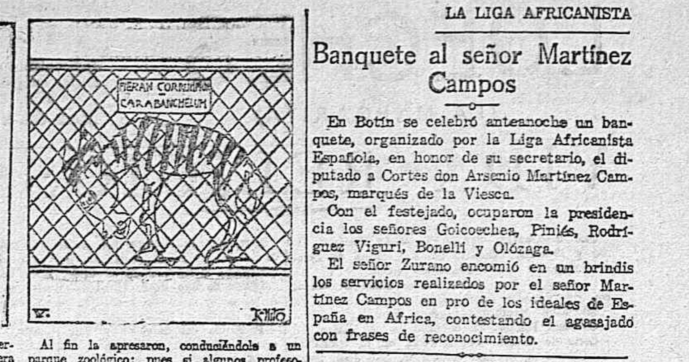
Pero su asombro fué tal al verse conmovido en cebra, que emprendió una carrera vertiginosa. Es lo que ella decía: «Yo sé que soy falsa; pero no creí que fuera una falsilla». Al fin la apresaron, conduciéndola a un parque zoológico; pues si algunos profesores dudaban que fuese cebra, otros indicaron que se trataba de la fiera corrupta.