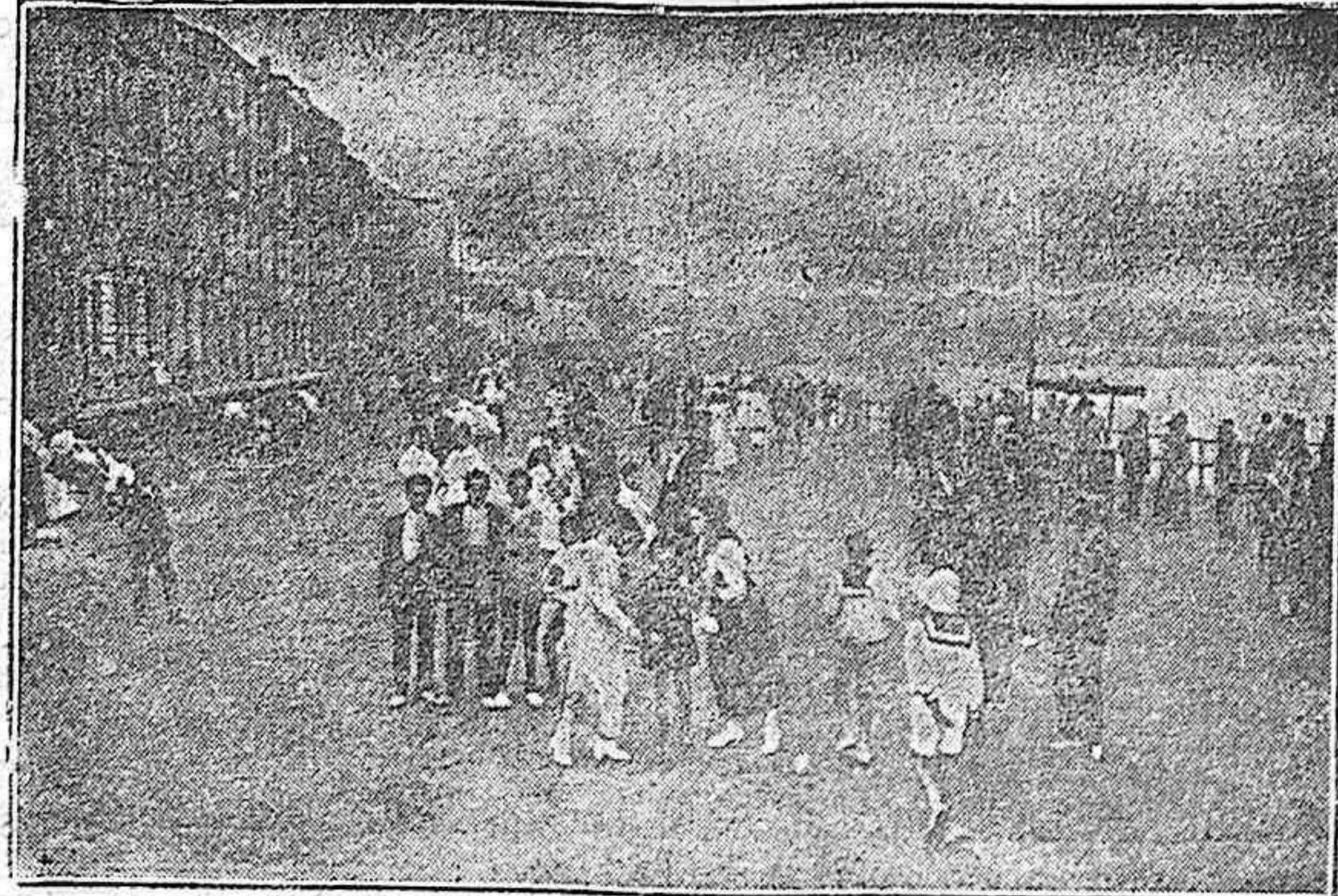
Calle de Escudilla (Gijón)

Mas no paran aquí las utilidades que a esta clase de industria reporta «El Fomento de Gijón» con el establecimiento de la lonja, sino que, como llegan las vías de los ferrocarriles del Norte y de Langreo (que a su vez empalman con los económicos de Asturias) hasta las mismas puertas de la lonja, los exportadores pueden sim-