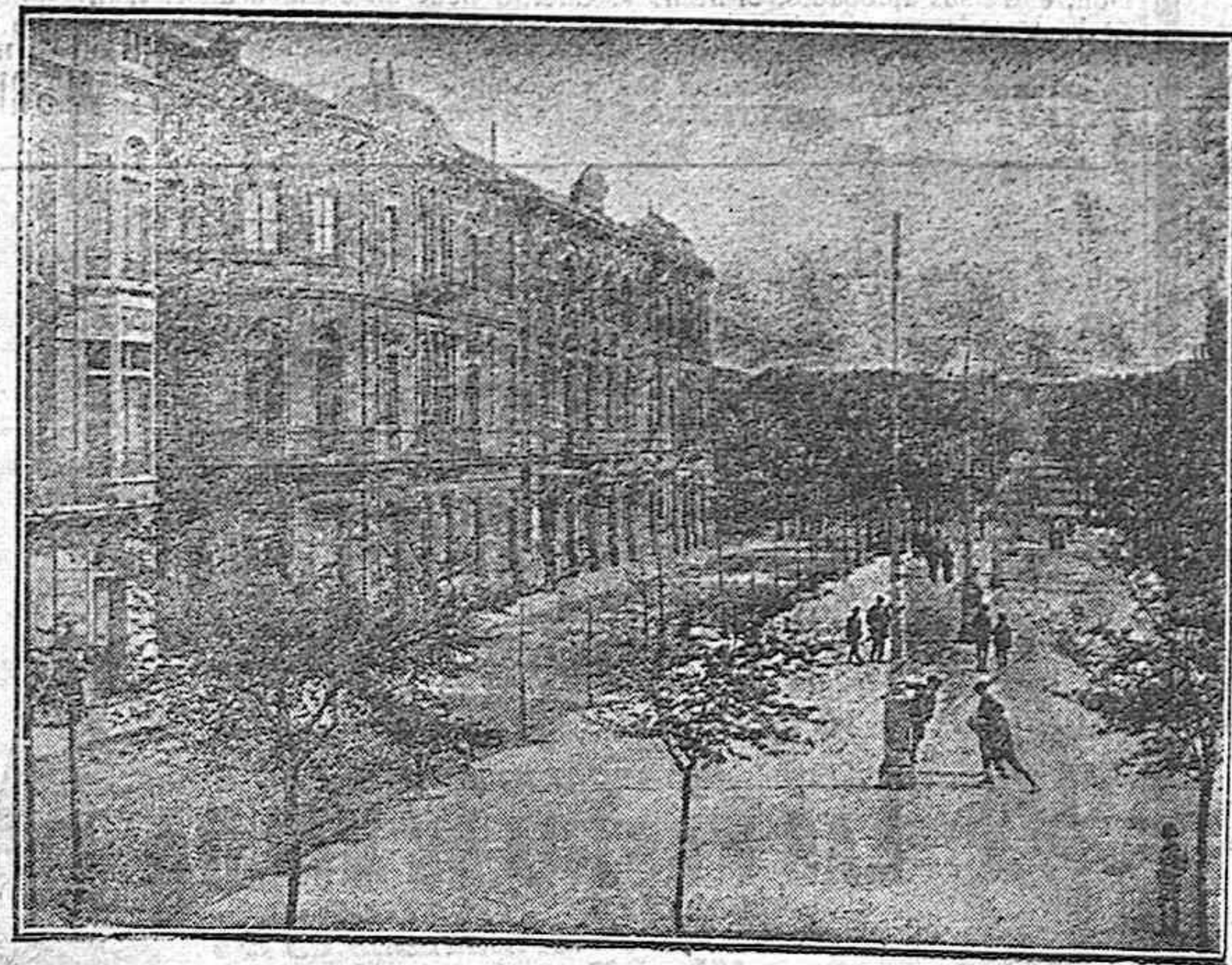
Paseo de Begonia (Gijón)

Vaya nuestra enhorabuena para los Sindicatos asturianos por sus triunfos continuos en el campo social y nuestro saludo fervoroso para la Federación.