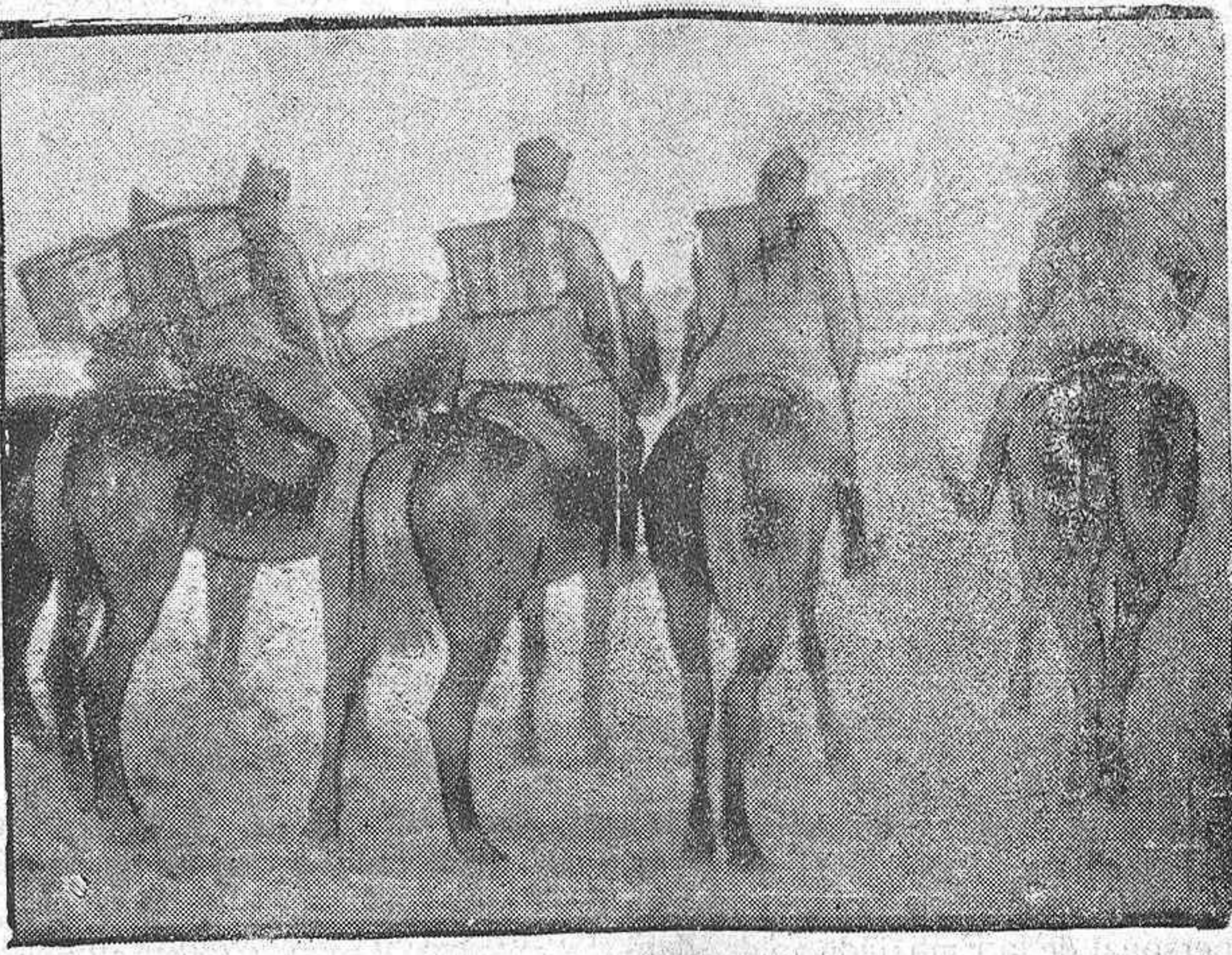
Soldados de caballería con palomas mensajeras

James Falcó Portocarrero y Osorio, duque de Alba, que es siete veces duque, una conde-duque, 11 marqueses y 16 condes; don Joaquín Ignacio de Artea y Echagüe, duque del Infantado y almirante de Aragón, que ha reunido nueve marquesados y cinco condados, y doña María del Pilar Loreto Osorio y Gutiérrez de los Ríos, duquesa de Fernán Núñez y de Arco, que tiene cinco marquesados, diez condados y una baronía. La mayor parte de estos títulos llevan aneja la grandeza de España. En Madrid viven 103 duques, 567 marqueses, 421 condes, 56 vizcondes y 30 barones. Siguen después en orden de residencia de nobleza, Sevilla con 82 títulos, Barcelona con 77, Valencia con 69, Cádiz con 32, Córdoba con 28, etcétera, siendo las provincias en que viven menos nobles las de Tarragona, Toledo, Or-nse, Teruel, Logroño, Gerona, Orensa, Burgos y Lugo.