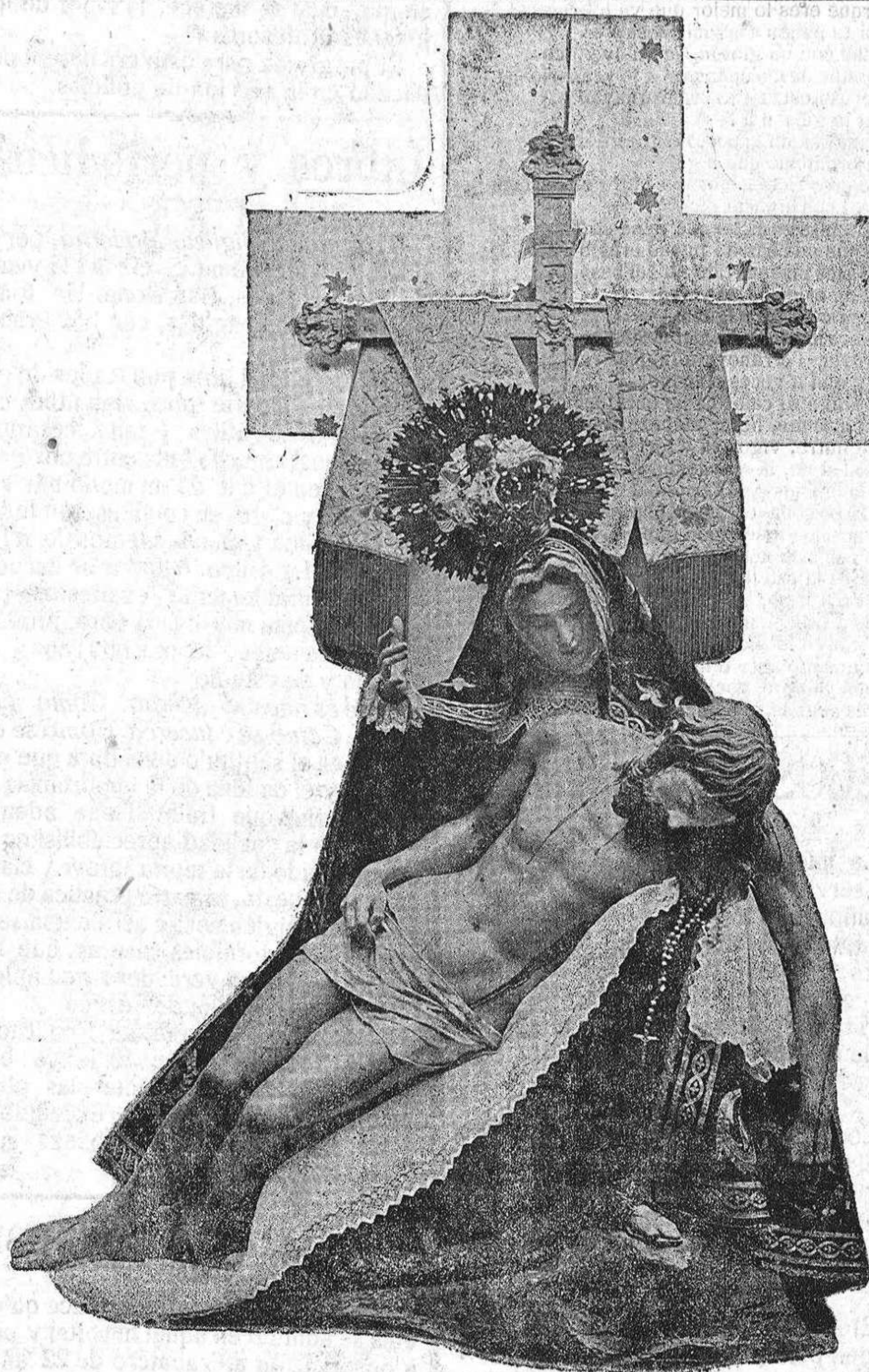
Imagen de Nuestra Madre de Las Angustias que se venera en la Iglesia de San Vicente, y cuyo novenario ha terminado hoy.

Veán ustedes: En Febrero de 1911, los productos de la venta realizados ascendieron a 12.934.974 pesetas; en 1912 a 16.936.255, y en 1913, a los citados 17.526.570.