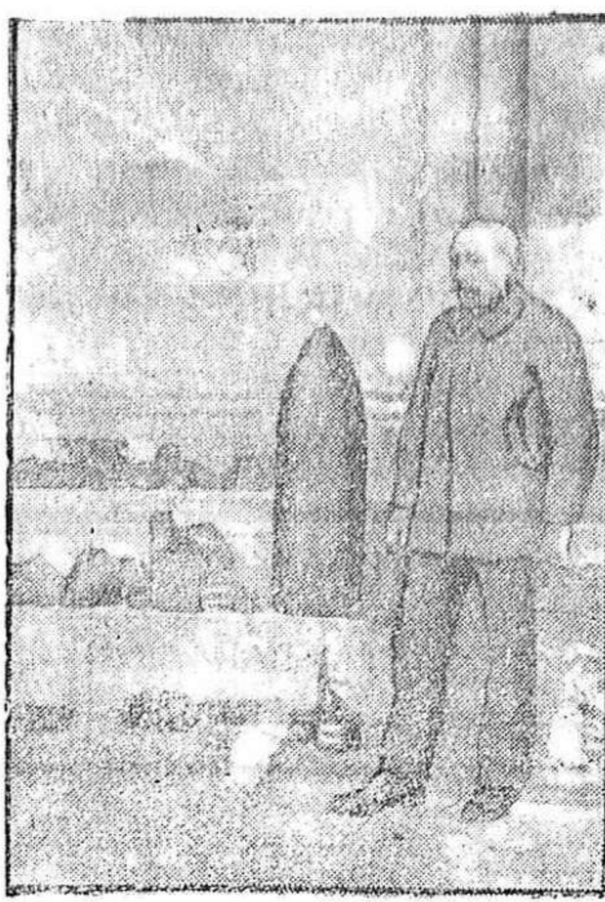
DE LA GUERRA.—Obus alemán sin explotar y trozos de proyectiles