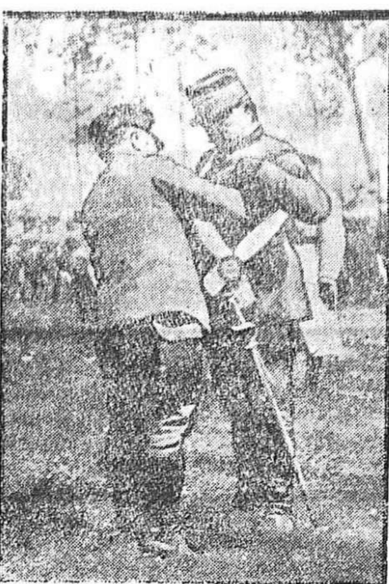
DE LA GUERRA.—El coronel japonés Naghai imponiendo a un general francés el cordón de la Orden del Sol.

Medina 11. Las entradas fueron hoy unas 000 fanegas que se pagaron de 86 a 87