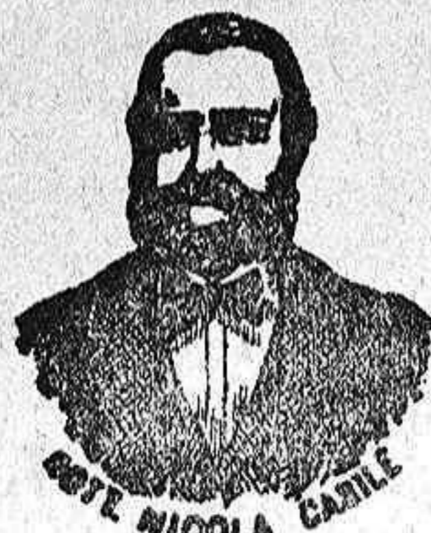
INVENTOR DE LOS RENOMBRADOS MEDICAMENTOS CASILE

Los adelantos de la Ciencia han logrado que el Dr. Casile, de Nápoles, descubriera los milagrosos medicamentos que curan infaliblemente la tisis en cualquiera de sus períodos y todas las enfermedades del estómago. A la más pequeña manifestación de un resfriado, tos, catarro, bronquitis, gripe, asma (sofocación), espectoración y de cualquier enfermedad del pecho, tomar inmediatamente las Perlas Casile , que no sólo curan infaliblemente estas enfermedades sino que se tendrá la completa seguridad de no contraer otras mucho más graves. Siguiendo este método se podrá decir más tisis . Si por descuido no se hubiera seguido este tratamiento y por desgracia cualquier persona se encontrara atacada de tisis, no tiene que apurarse, porque gracias a los constantes estudios hemos podido encontrar los renombrados Confites Casile , que asociados a las Perlas combaten con eficacia la tisis en cualquiera de sus períodos.