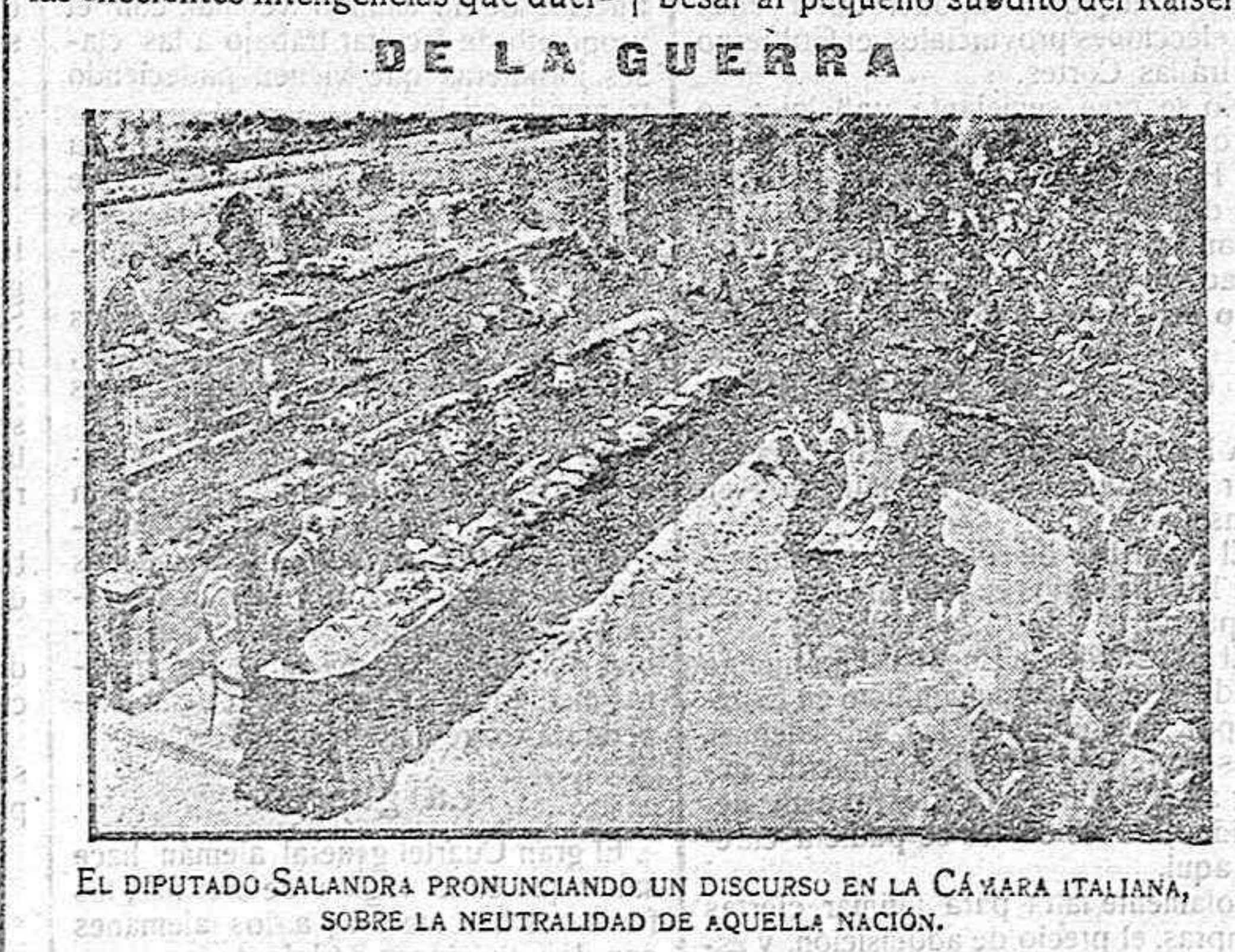
EL DIPUTADO SALANDRA PRONUNCIANDO UN DISCURSO EN LA CÁMARA ITALIANA, SOBRE LA NEUTRALIDAD DE AQUELLA NACIÓN.

DE LA GUERRA mentante ante legajos de papeles y dejan en descanso las máquinas creadoras, en vergüenza las cifras de nuestra exportación y en la miseria la fecundante riqueza del suelo de la patria. Los impuestos, las cargas múltiples que se imponen a los contribuyentes, a la clase indocata que lucha resistiendo la persecución del Fisco, soportando el castigo a que condena el delito de trabajar libremente, no vuelven, como sería justo, a facilitar las necesidades de la vida colectiva, a distribuir cultura, a evitar los efectos de los temporales y de las sequías con pantanos, canales y árboles, ni a facilitar el crédito que anule al asqueroso usurero, ni a crear una conciencia sana y una libertad honrada que hagan imposible la actuación del caciquismo. El dinero de los labradores tiene empleo parecido al del verdegü. Se acentúa el malestar general, y por remediarlo nada hacemos; nada mal se rectifica; guardamos un silencio que más parece emblema de la muerte que símbolo de mansedumbre. Pero esta sepulcral conformidad, infunde pavor; da miedo. ¡El pueblo hambriento es peor que las fieras! Philipo.