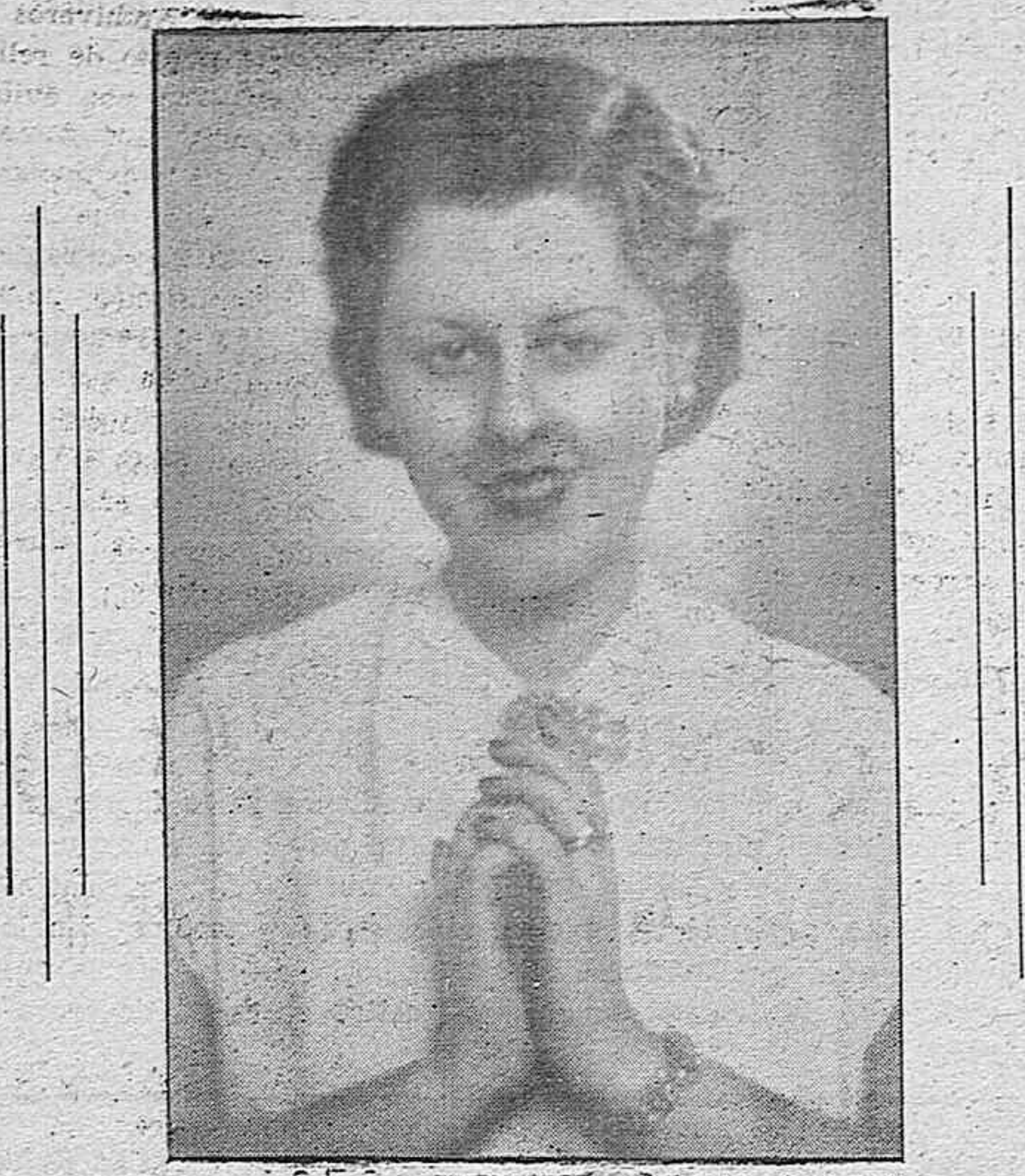
Cristina Maristany, la célebre cantante de coloratura, está haciendo popular en Alemania la música del Brasil y de toda la América del Sur.