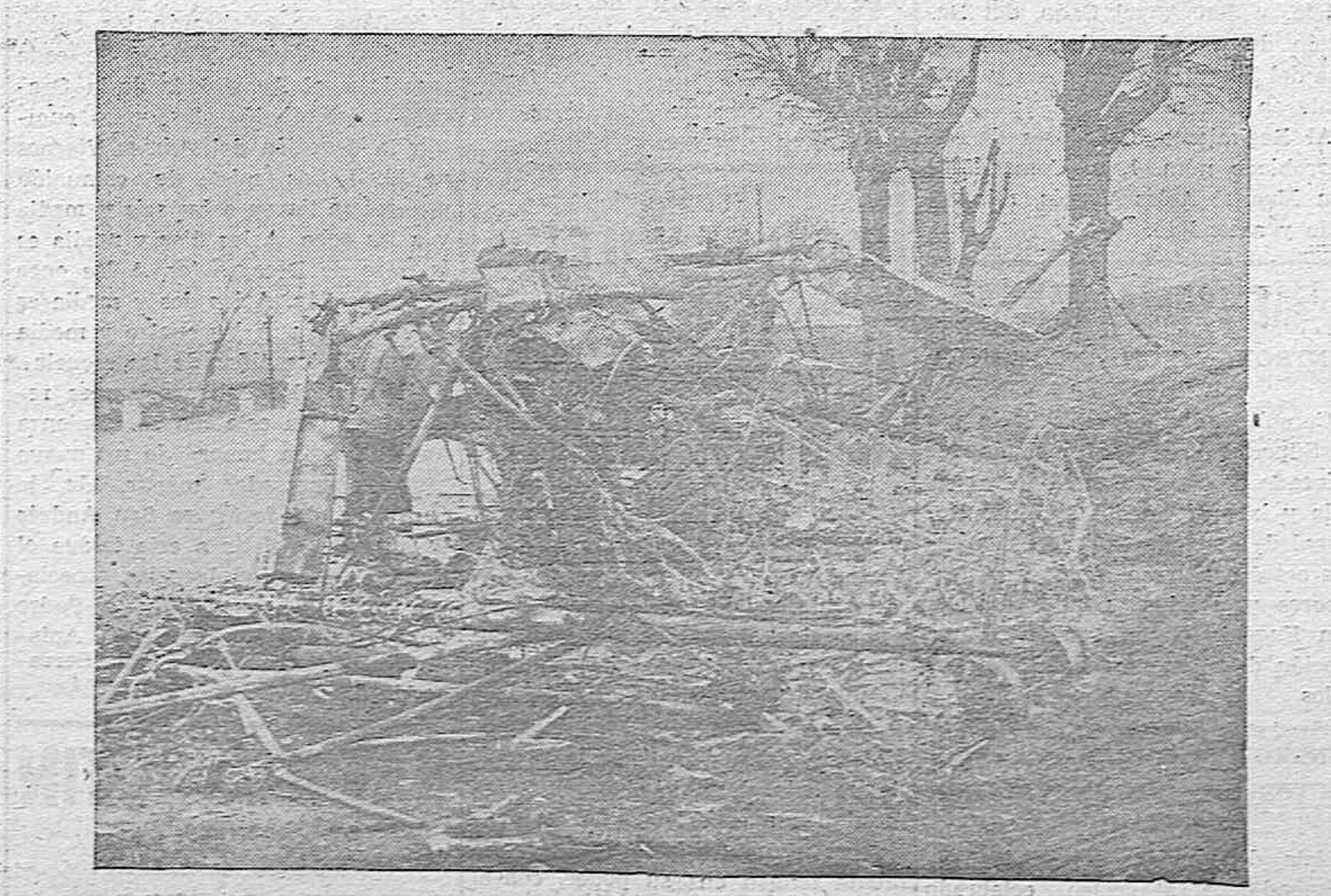
LA MUERTE DE GARCIA MORATO.—Restos del avión tipo "raja" en el cual encontró muerte en Griñón, el laureado comandante García Morato.

Berlín.—Los jefes de la Marina y el Ejército daneses, han sido invitados por el Gobierno alemán para que se trasladan a Berlín como huéspedes del Reich.