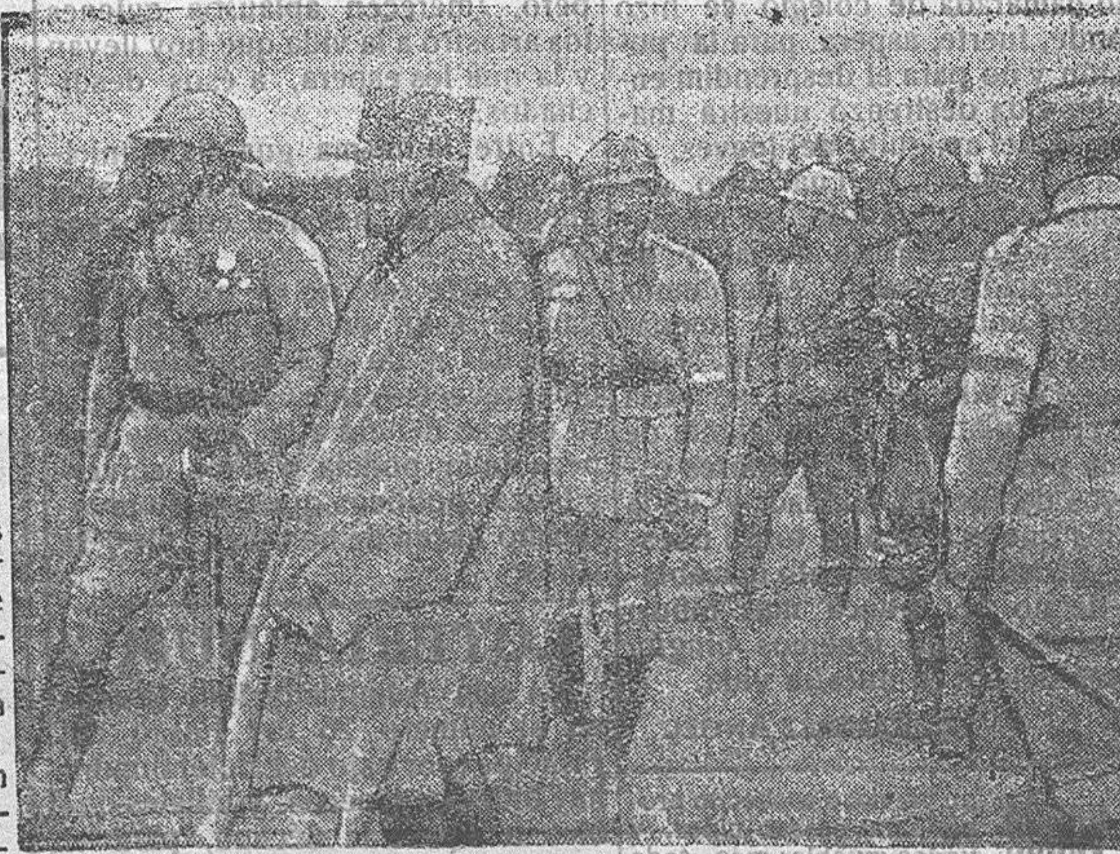
EL CORONEL ANDEOUR, JEFE DE UN CUERPO DE EJERCITO SUIZO QUE ACABA DE VISITAR LA FRONTERA FRANCESA