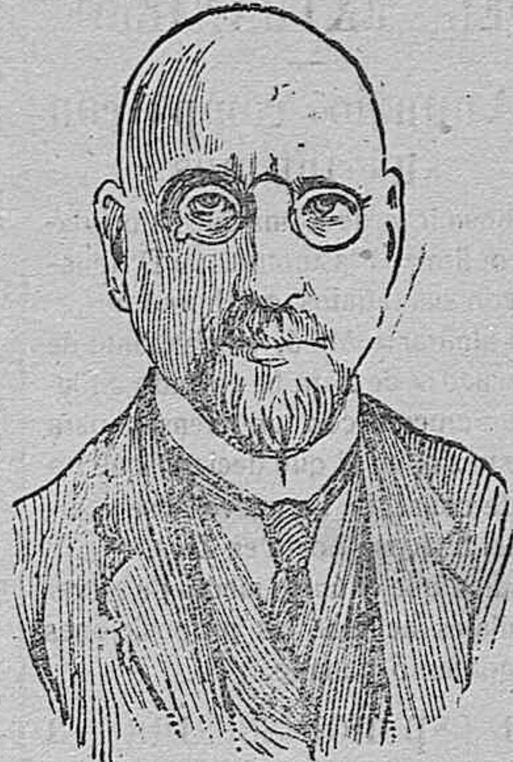
Doctor Haber, catedrático alemán agraciado con el Premio Nobel de Física.