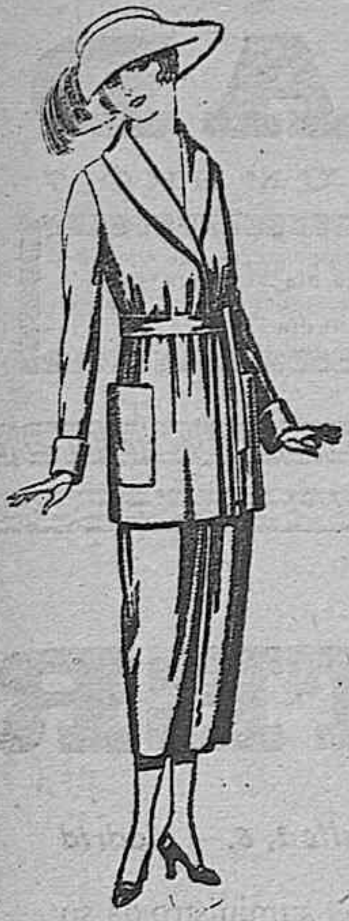
Trajes de punto de lana negro, azul y colores de ptas. 150 á 250

SUCURSALES: Madrid, Barcelona, Alicante, Bilbao, Cádiz, Cartagena, Gijón, Granada, Málaga, Palma de Mallorca, Santander, Sevilla, Valencia, Valladolid y Zaragoza