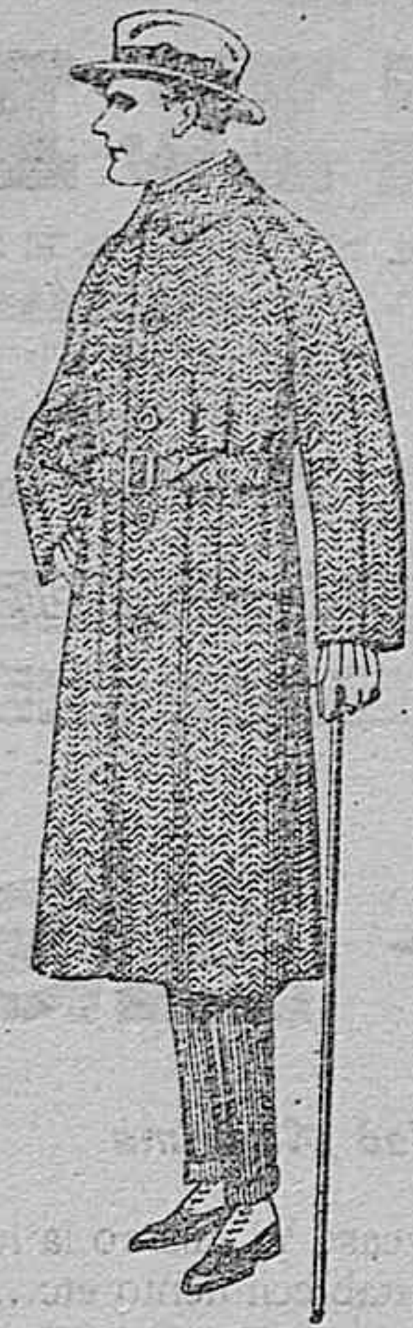
Gabanes de patén, cheviot o coewer. de ptas. 85 á 180