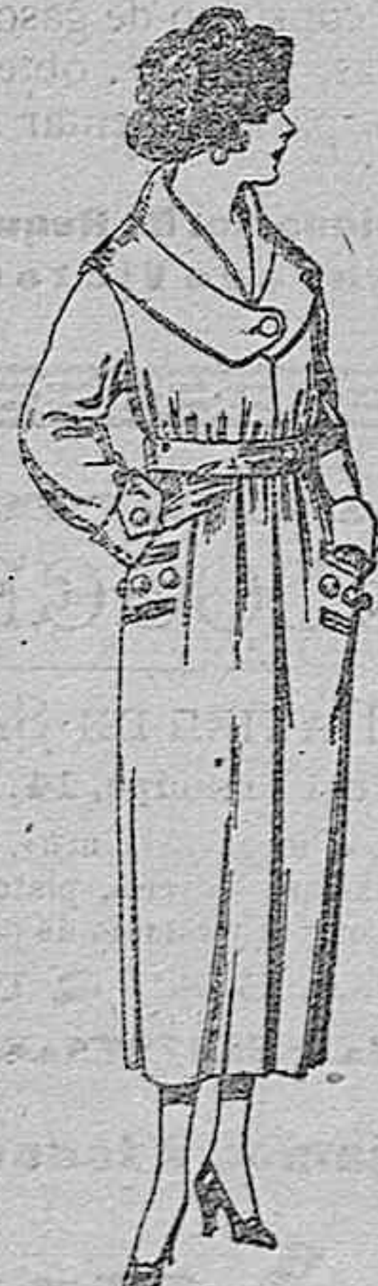
Abrigos de gamuza, pañete etc., en negro, azul y color. de ptas. 45 á 90

ROPAS CONFECCIONADAS PARA CABALLERO, SEÑORA, NIÑO Y NIÑA