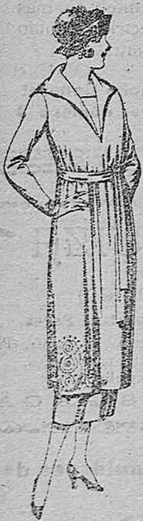
Vestidos de punto de lana, azul y color, adornos bordados. de ptas. 145 á 250