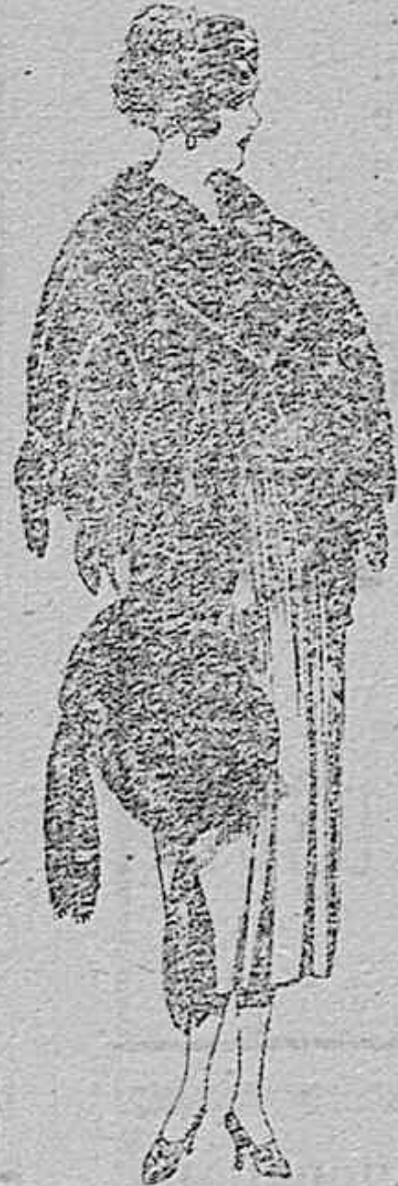
Juegos pieles, imitación Renard negro de ptas. 100 á 150