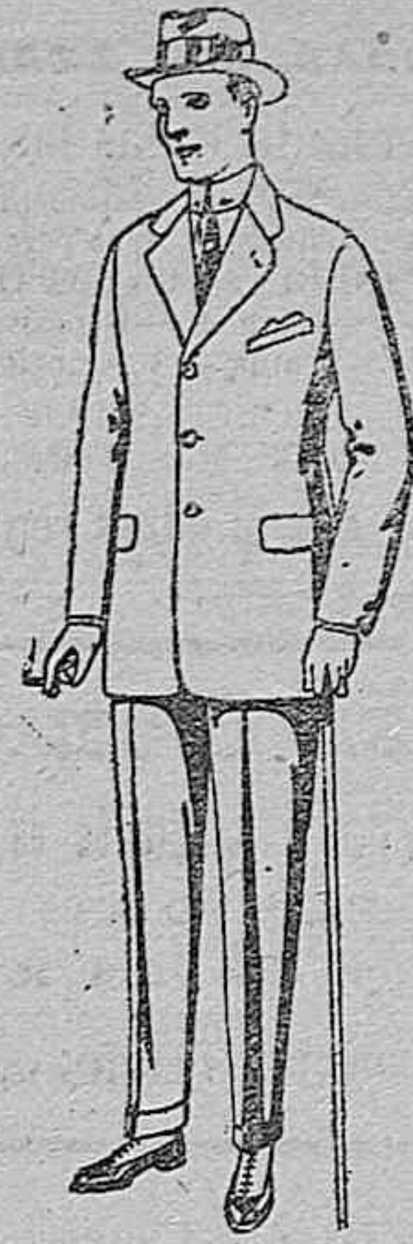
Trajes de cheviot con cinturón, elegante corte, para sportman. de ptas. 85 á 125