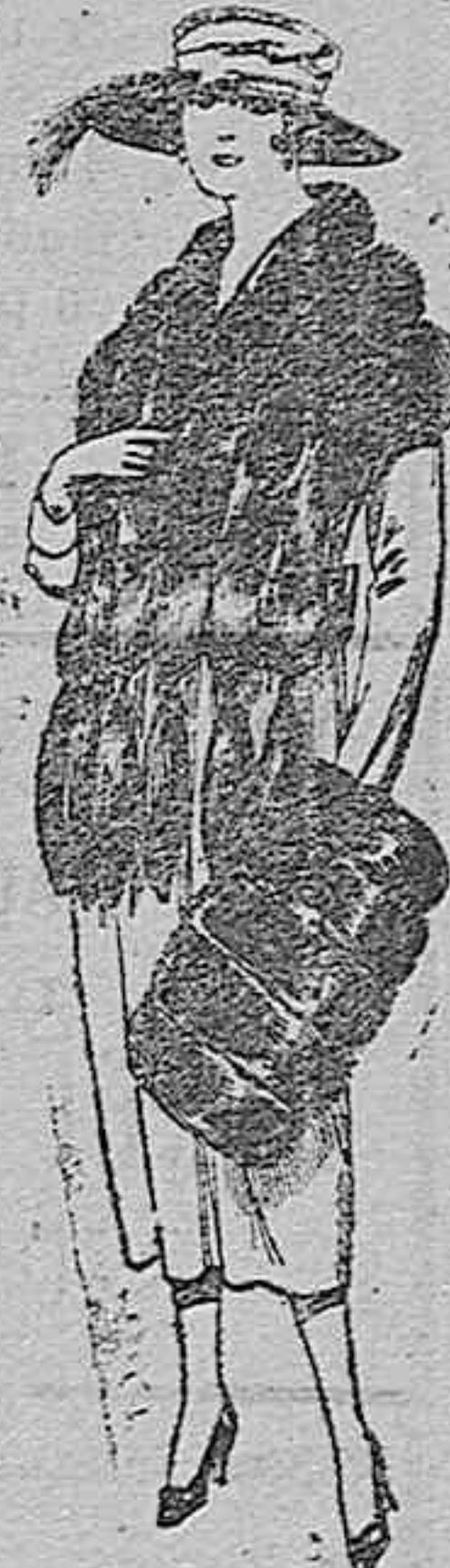
Juego pieles, imitación «Colombia», negro de ptas. 18 á 21