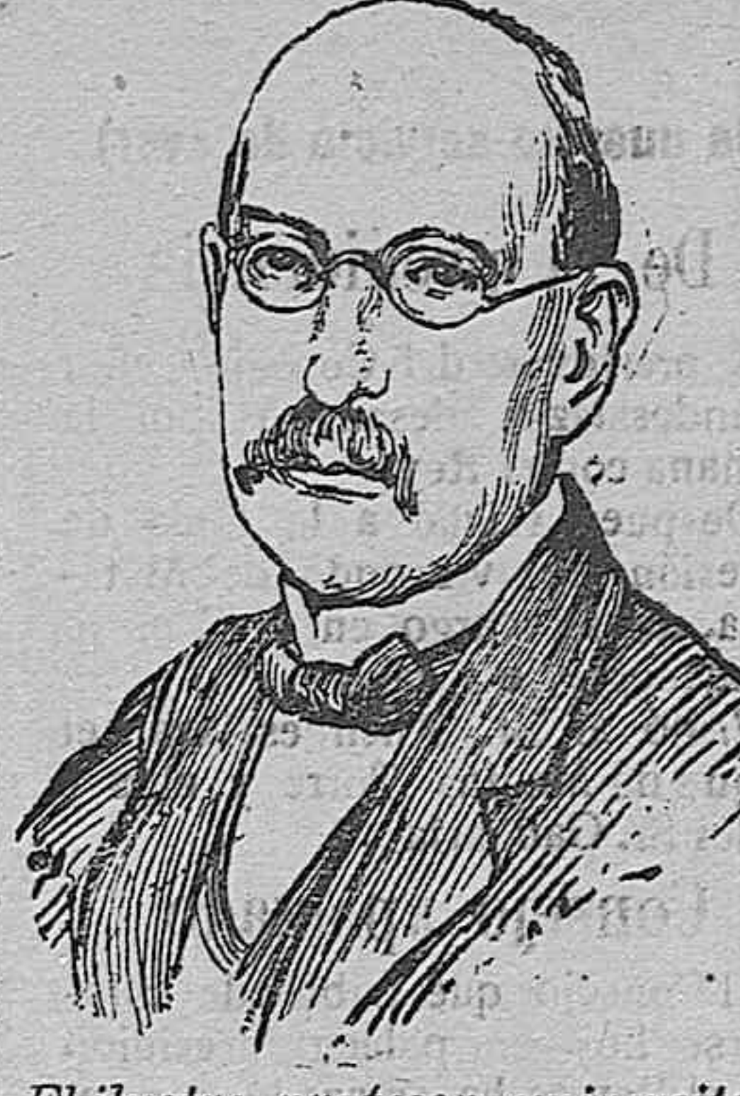
El ilustre profesor universitario, señor Plank, que ha obtenido el Premio Nobel de Química.