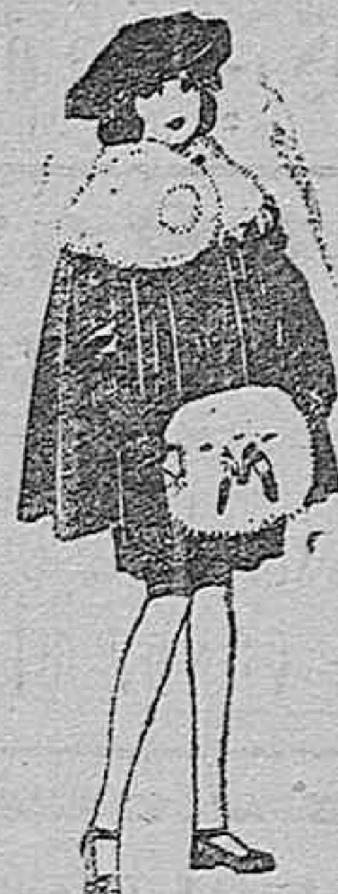
Juego de pieles blanco, imitación armiño, para niñas. de ptas. 16 á 21