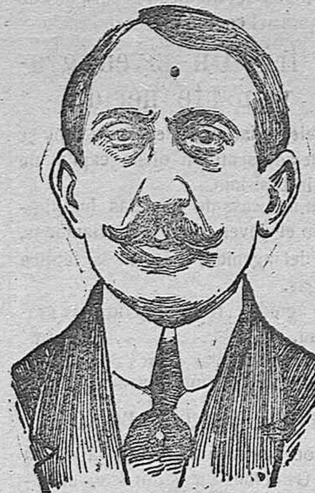
El Doctor Sergio Voronoff, descubridor del ingerto de las glándulas intersticiales para la curación de la vejez.