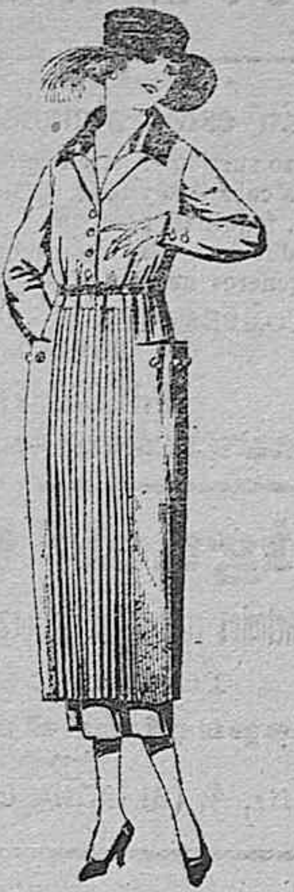
Vestidos de sarga inglesa, stambre, etc., en negro, azul y color. adornos punto. de ptas. 115 á 150