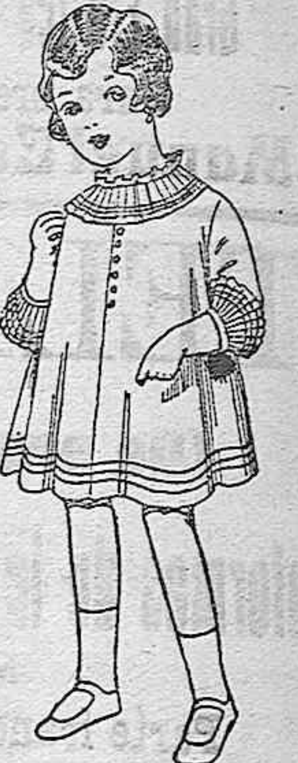
Vestidos de seda blanca bordados, de pesetas 6'75 a 8.