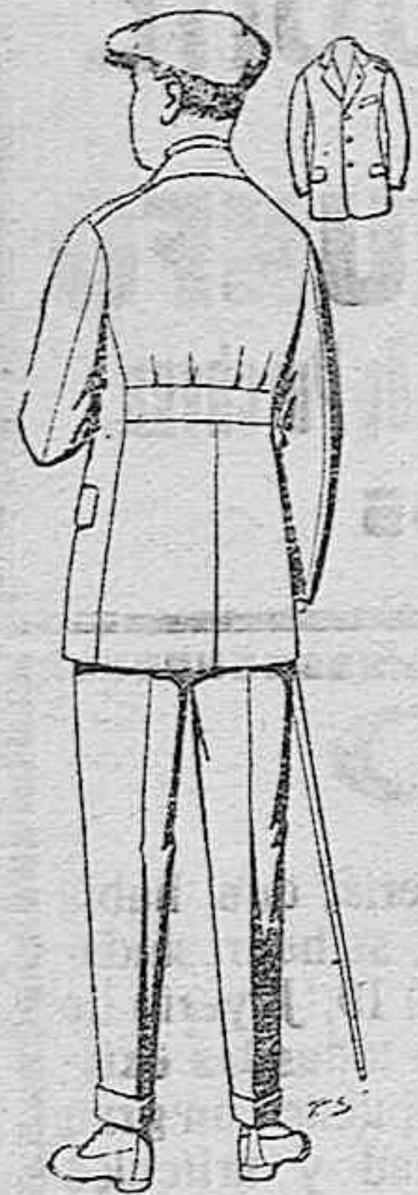
Trajes modelo sport, de lanilla, mellón, etc., para jovencitos de 10 a 15 años, de ptas. 27 a 52. Los mismos en dril de ptas. 11 a 21.