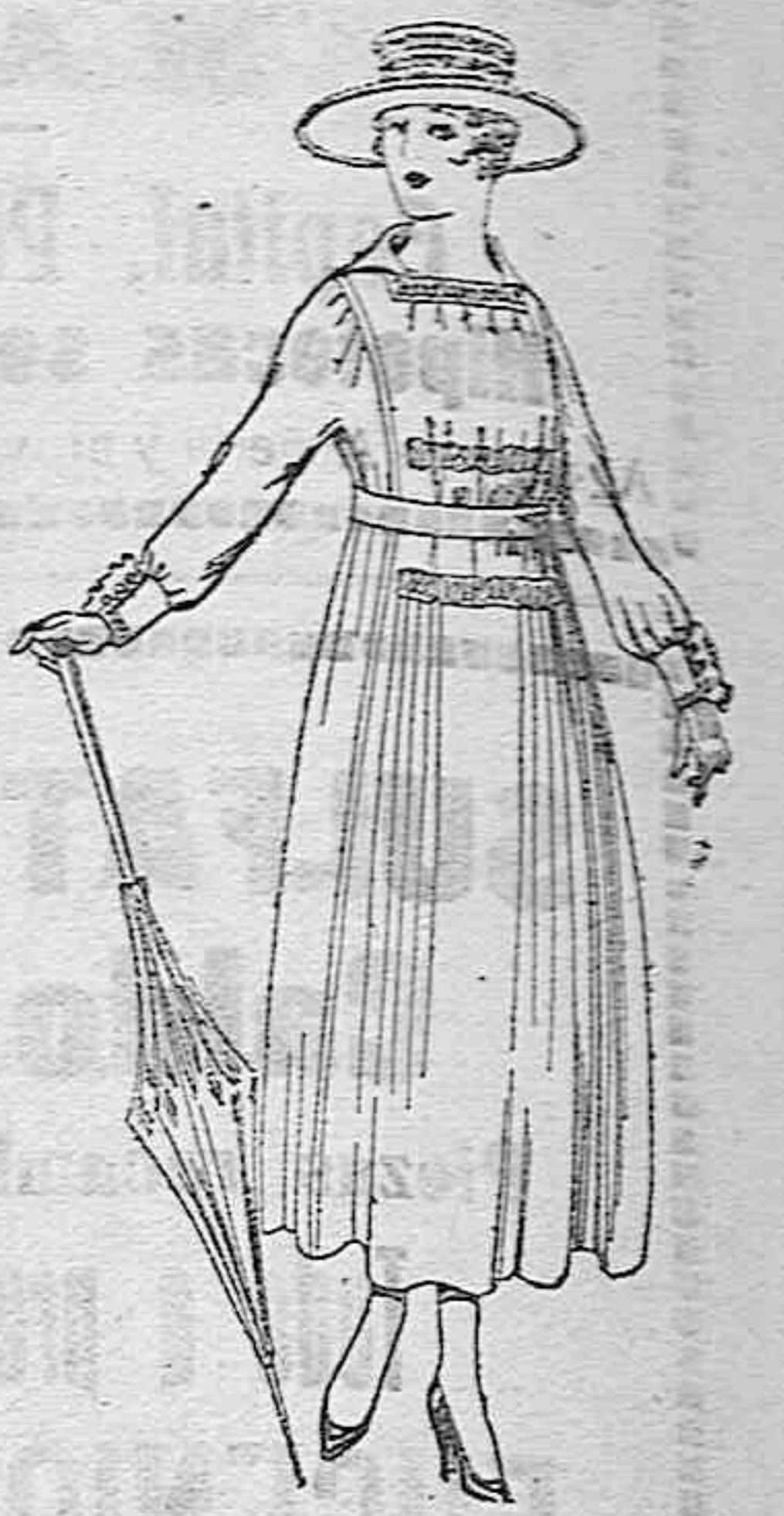
Vestidos de lanitas negras, azules y colores, de pesetas 60 a 70.