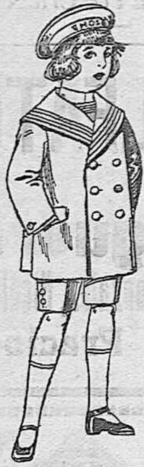
Trajes matotol de vicuña o jergal azul para niño de 4 a 9 años de ptas. 14 a 32