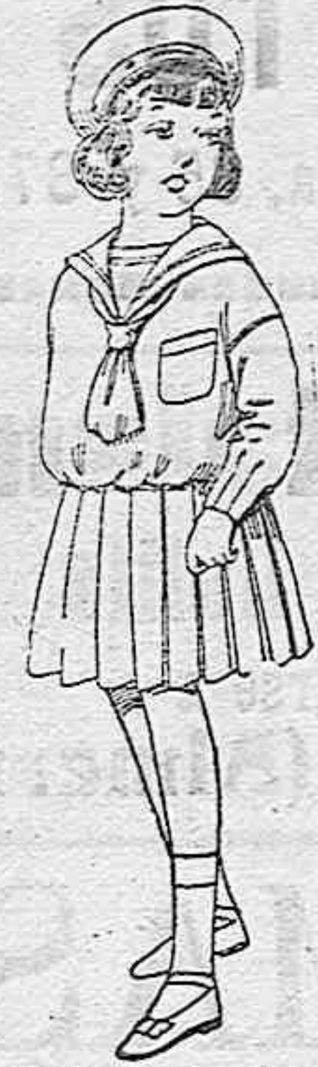
Trajes de marinera de lanilla azul para niñas de 4 a 9 años de ptas. 32 a 38. Los mismos de dril blanco de 18 a 24 ptas.