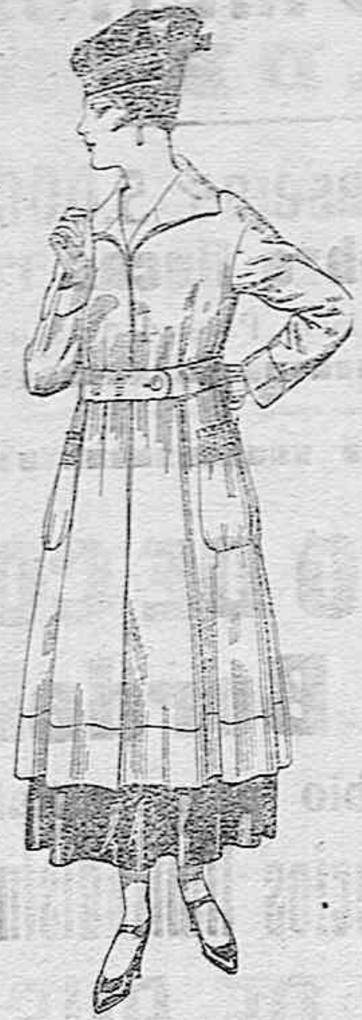
Abrigos de tricot de lana, en colores lisos, de pesetas 65 a 75.