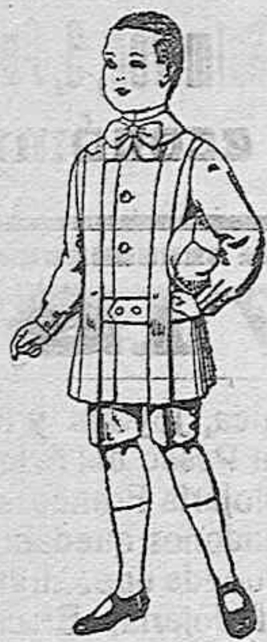
Trajes de lanilla para niños de 4 a 9 años de ptas. 12 a 31.