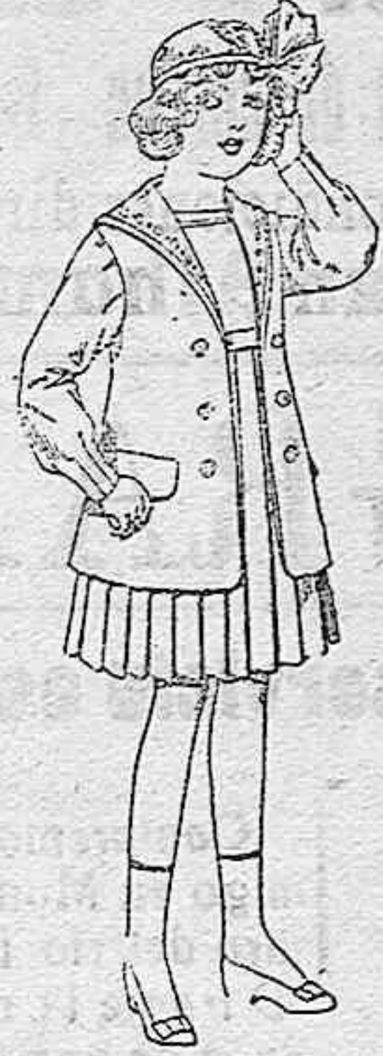
Trajes de gabardina blanco, cuello de organdín bordado, para niñas de 4 a 9 años, de ptas. 22 a 24