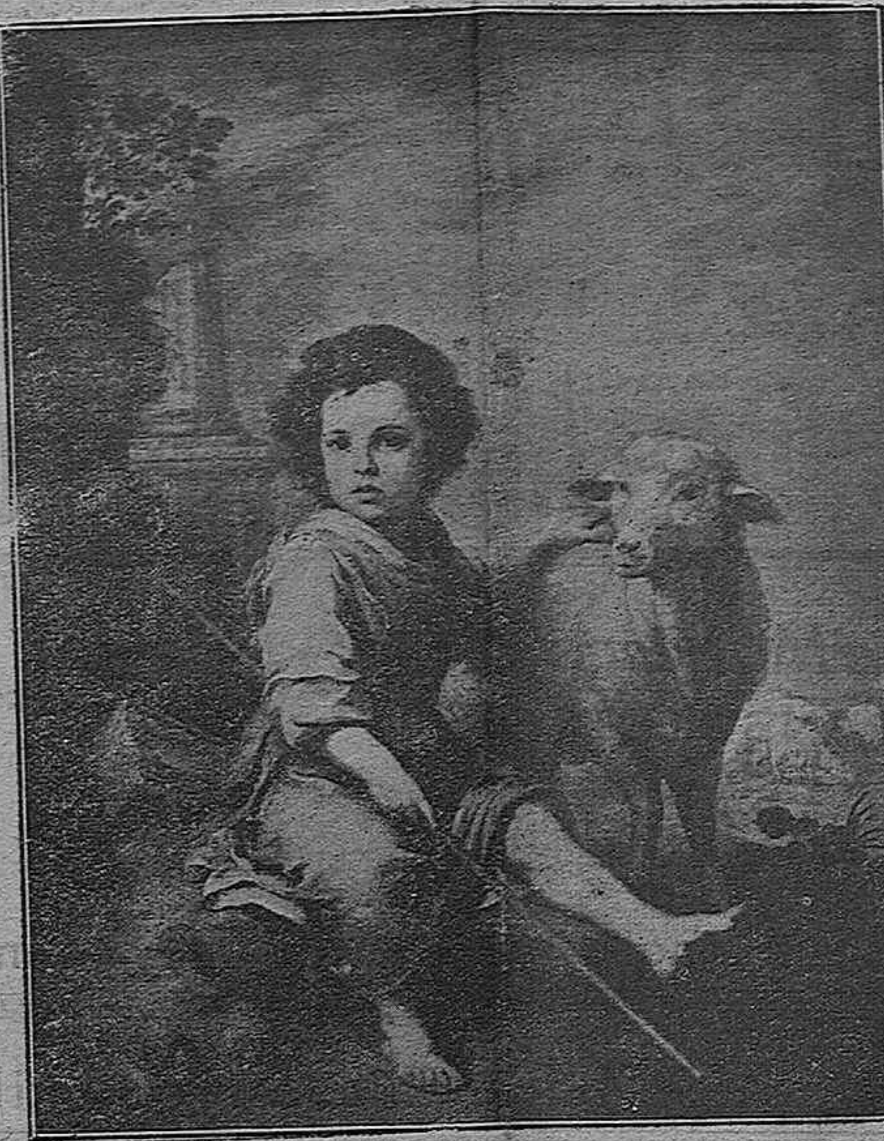
EL NIÑO DIOS PASTOR MURILLO (1617-1632)