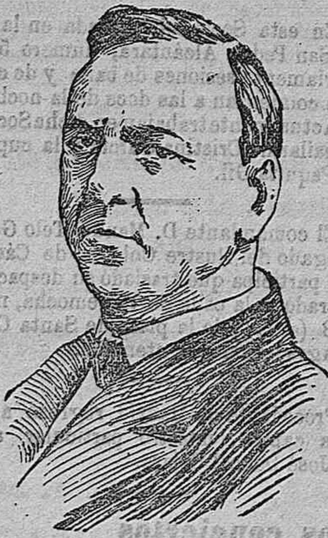
MISTER JOSEPH DANICH

secretario de Estado de la Marina de los Estados Unidos