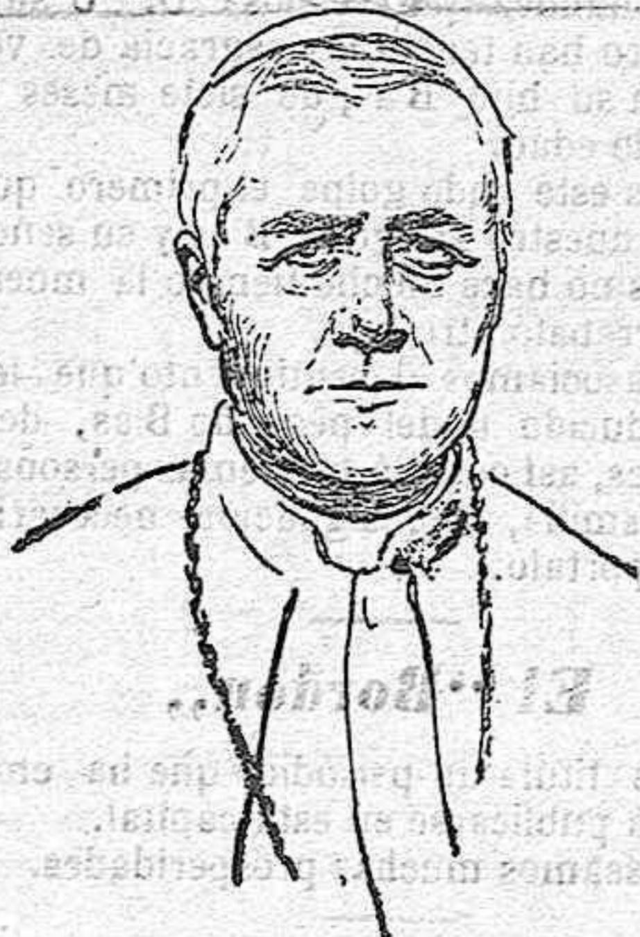
S. S. el Papa Pío X