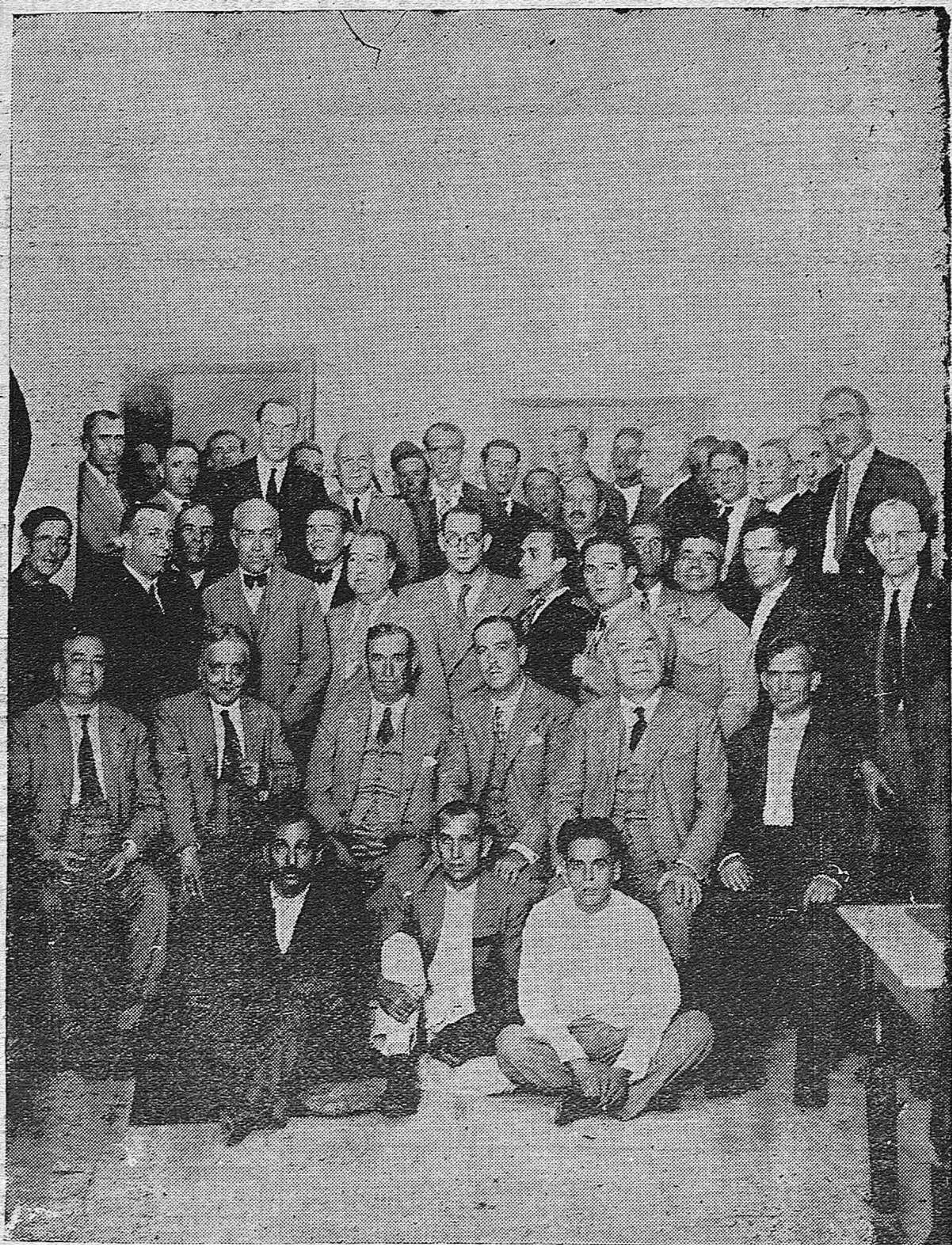
EN EL CENTRO REPUBLICANO.—Acto político celebrado anoche como preparación y organización de la próxima campaña electoral.