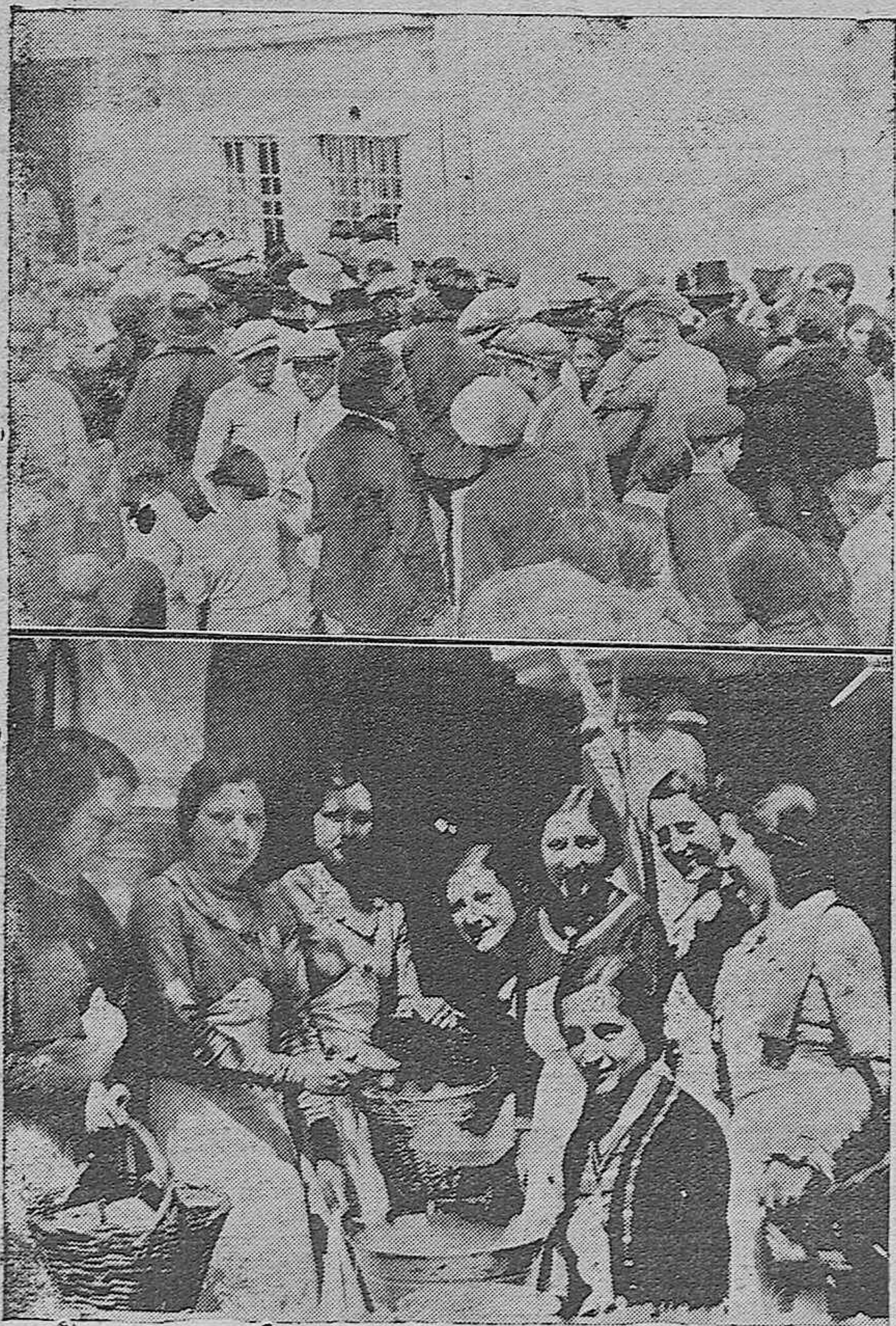
Arriba: Inauguración del Comedor de Caridad de Bujalance.—Abajo: Distinguidas señoritas que sirven a diario la comida en aquella benéfica institución.