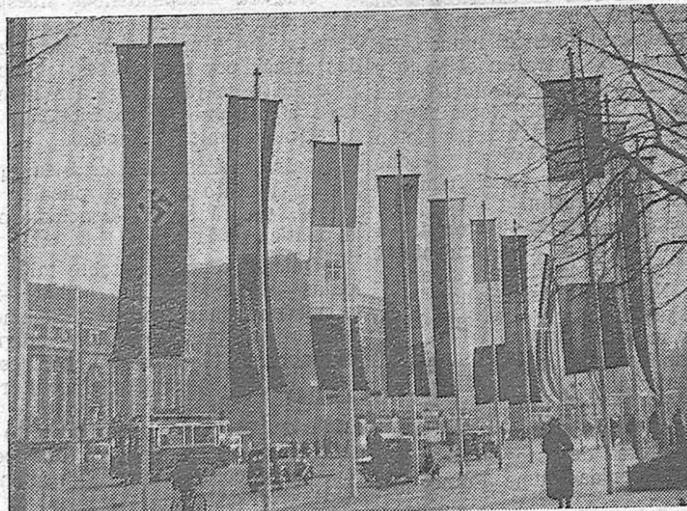
El primer día de la Feria de Leipzig, hubo tal afluencia de visitantes, como no se conoció otra durante su historia.- Vista de la estación central de Leipzig decorada con las banderas de las naciones que tomaron parte en la Exposición

distos industriales adaptados especialmente a los países situados en las zonas cálidas; acumuladores, hornos, orientadores y lámparas a petróleo, instrumentos veterinarios, ara-