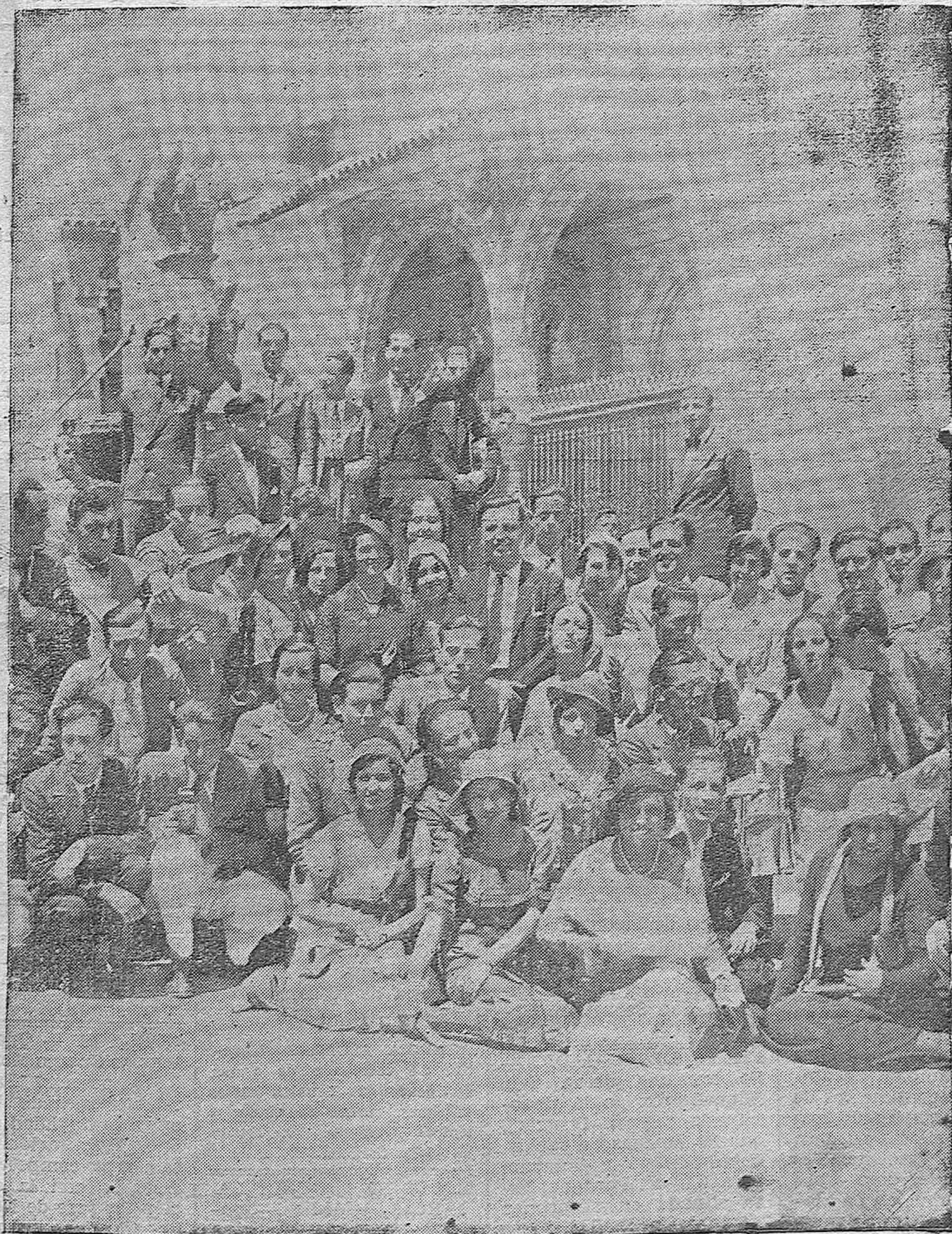
EN VIAJE DE ESTUDIOS.—Maestras y maestros cursillistas, que llegaron ayer a nuestra ciudad procedentes de Huelva