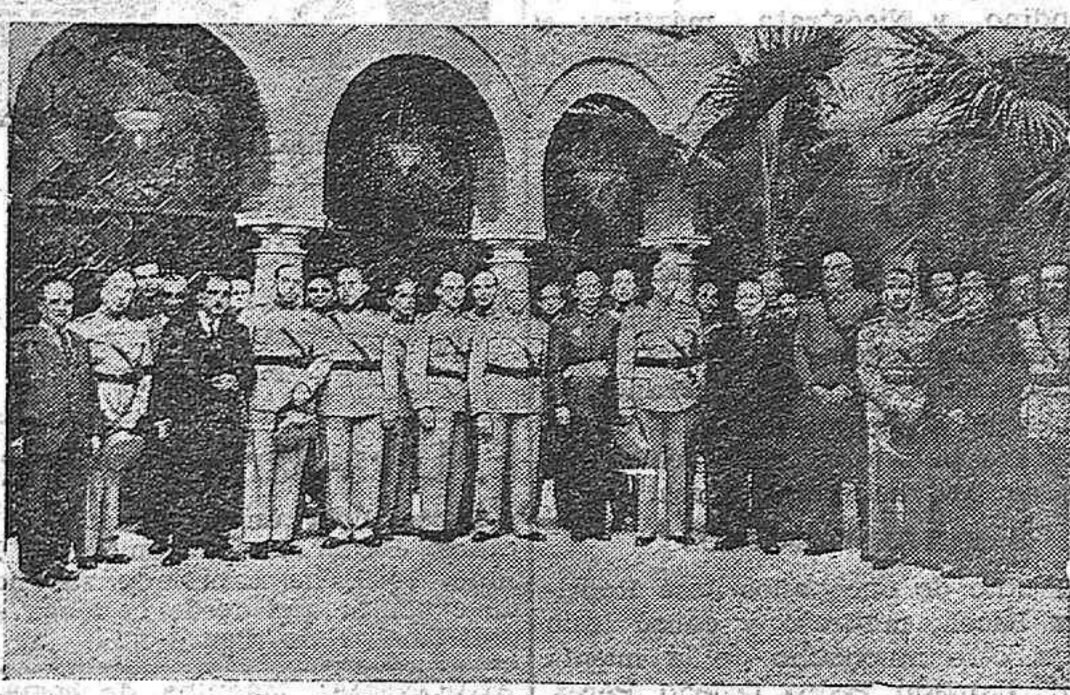
LOS ALUMNOS DE LA ESCUELA SUPERIOR DE GUERRA DE PORTUGAL QUE VISITARON CÓRDOBA, EN EL CIRCULO DE LA AMISTAD.