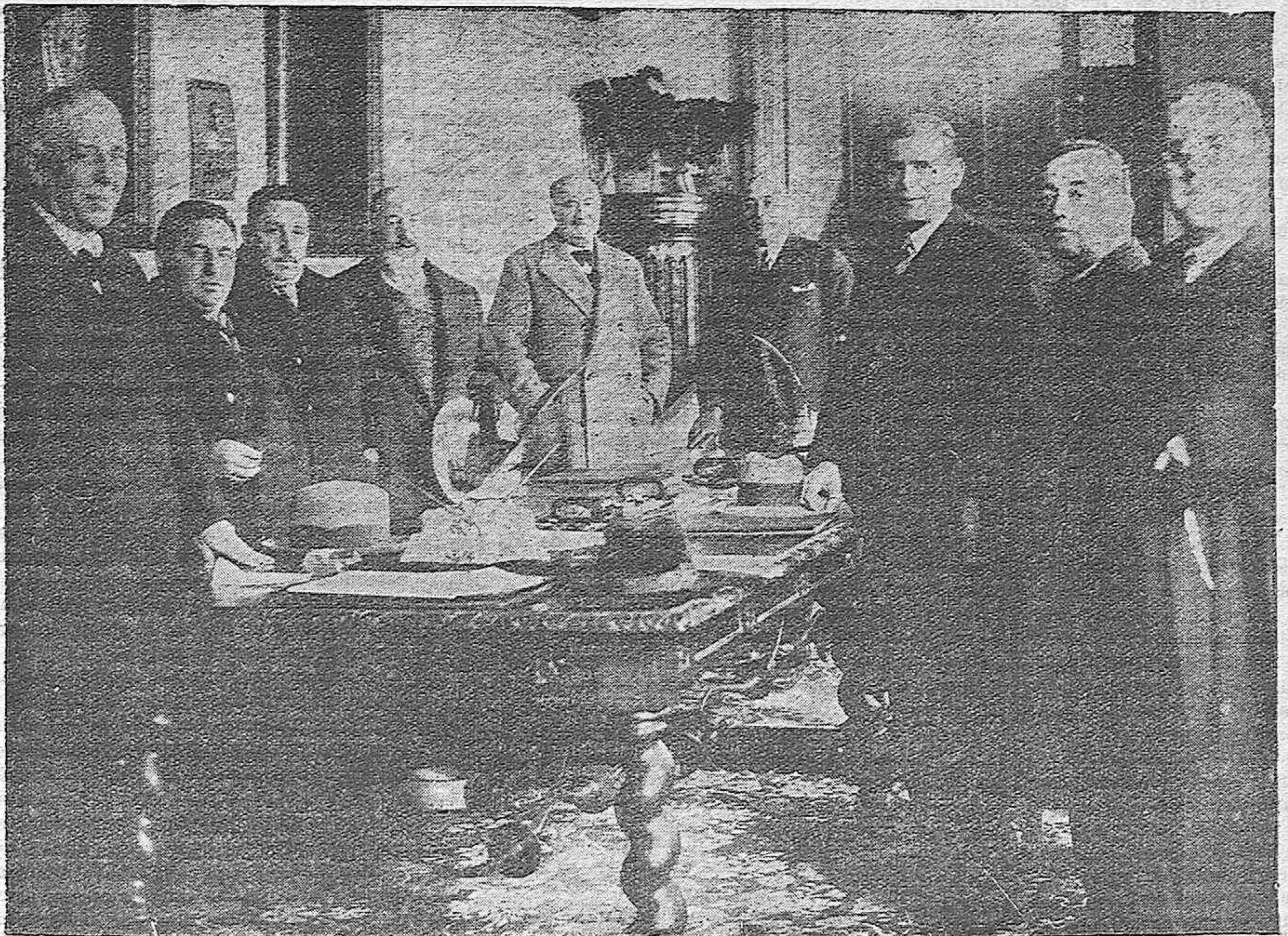
LA JUNTA MUNICIPAL DEL CENSO ELECTORAL, QUE SE CONSTITUYO ESTA MAÑANA BAJO LA PRESIDENCIA DEL JUEZ DE LA IZQUIERDA SEÑOR USANO.

Esperemos que la serenidad ponga el necesario equilibrio, llevando a unos y otros el amor y la paz tan indispensables.