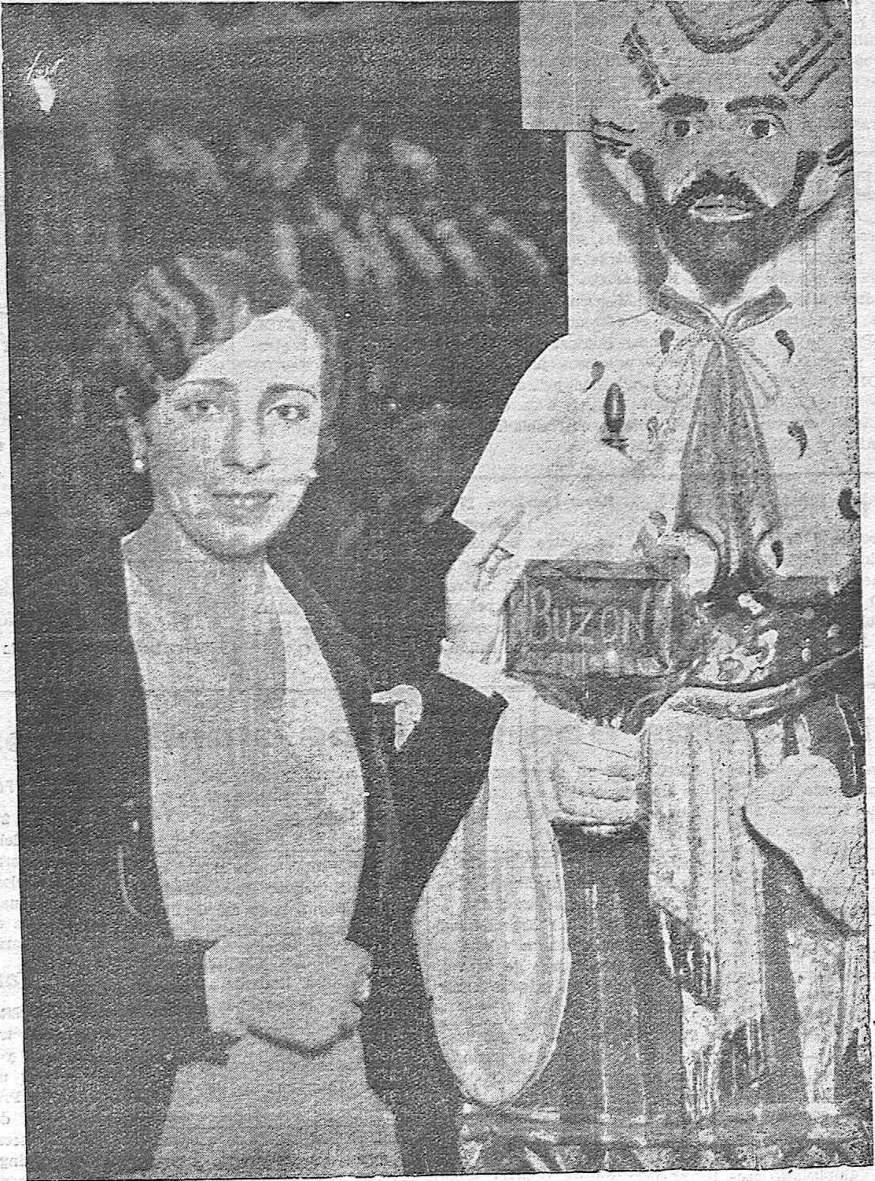
UNA MUCHACHITA DEPOSITANDO EN EL "BUZON" DEL MAGO MELCHOR UNA CARTITA SOLICITANDO UN REGALO. ¿UN NOVIO? ¡POBRE AMIGO MELCHOR Y EN QUE COMPROMISOS LO "METEN".