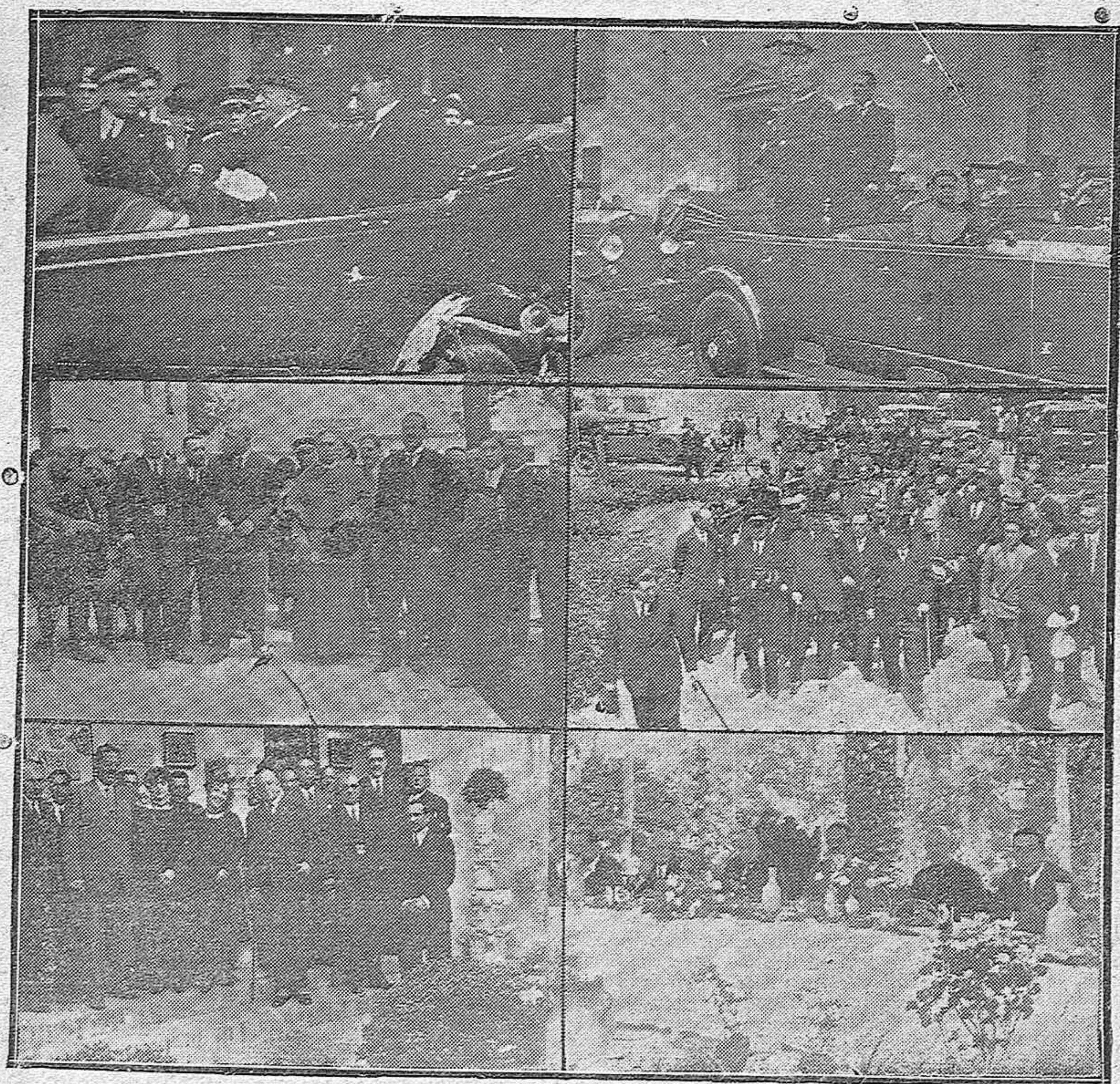
EL MARQUÉS DE ESTELLA EN CÓRDOBA.—El Presidente y el Alcalde saliendo de la Estación.—En la Iglesia de San Rafael.—Visitando las obras de la Escuela de Veterinaria.—En el Museo Provincial de Bellas Artes.—Presidencia del banquete popular en los jardines de Agricultura.