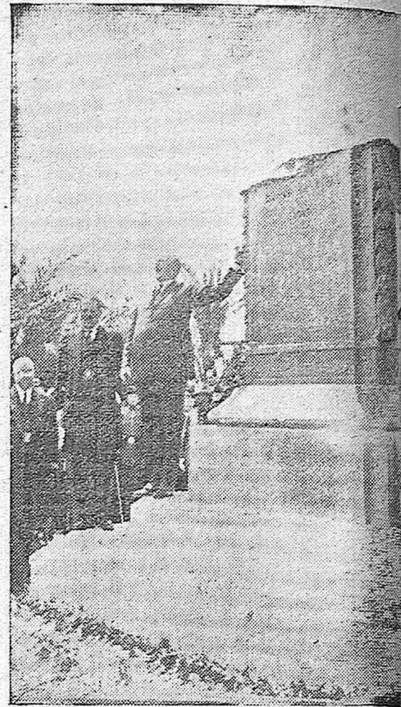
EL PRESIDENTE PRONUNCIANDO UN DISCURSO ANTES DE DESCUBRIR LA ESTATUA DEL DUQUE DE RIVAS.

El discurso fué subrayado en diferentes ocasiones por clamorosas ovaciones, y al final, los concurrentes prorrumpieron en vitores y entusiastas aplausos.