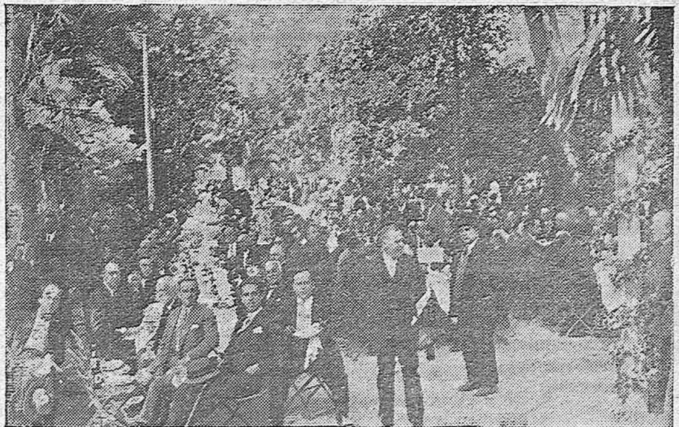
EL BANQUETE AL PRESIDENTE.—UN SECTOR DEL BANQUETE CON EL ANIMADISIMO ASPECTO QUE OFRECIA.

Honra al nombre de Primo de Rivera que ha conseguido redimir a España.