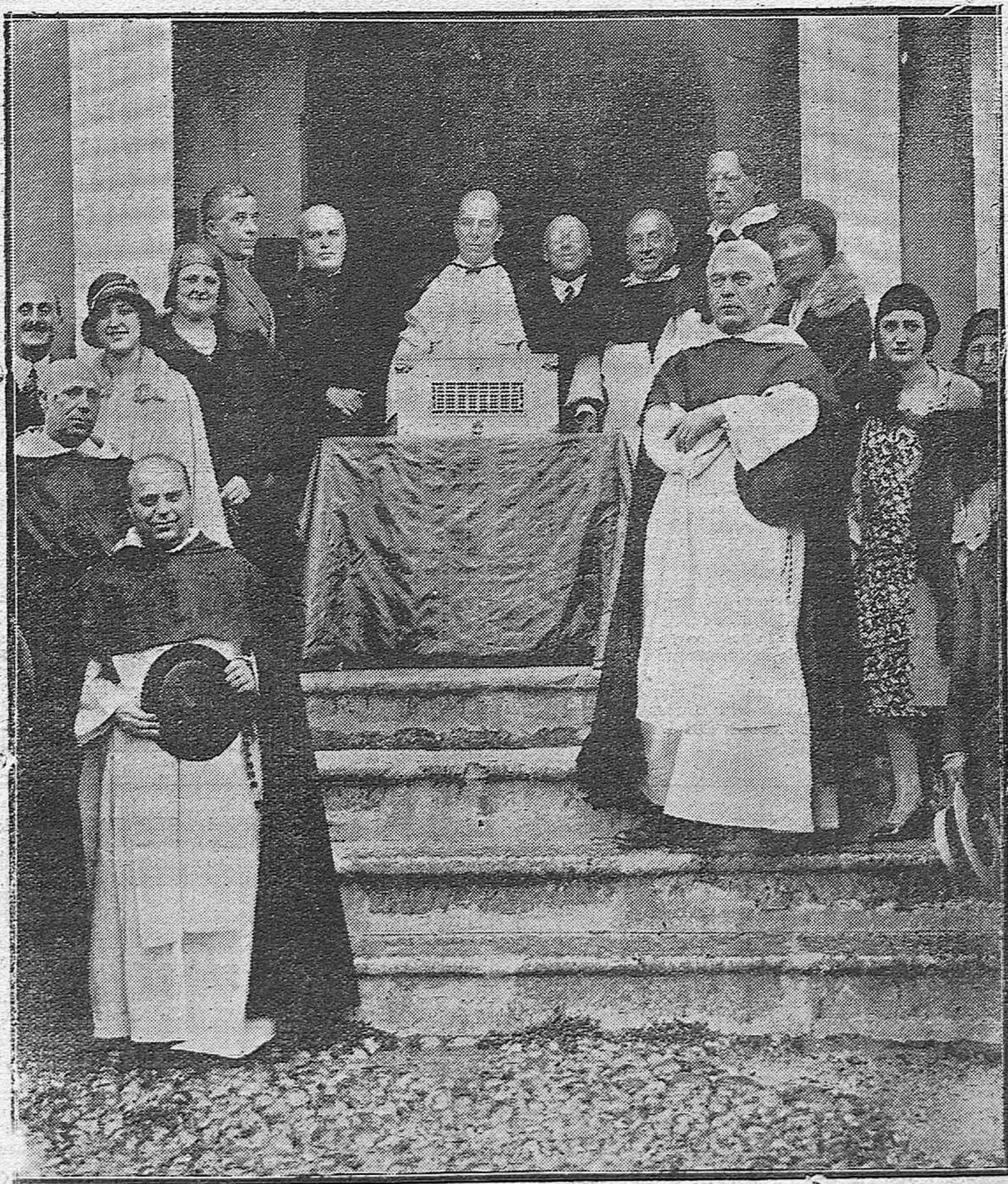
EL QUINTO CENTENARIO DE LA MUERTE DE SAN ALVARO.—TRASLADO DE LOS RESTOS DEL SANTO A LA IGLESIA DE SAN AGUSTIN, ACTO CELEBRADO CON GRAN SOLEMNIDAD.