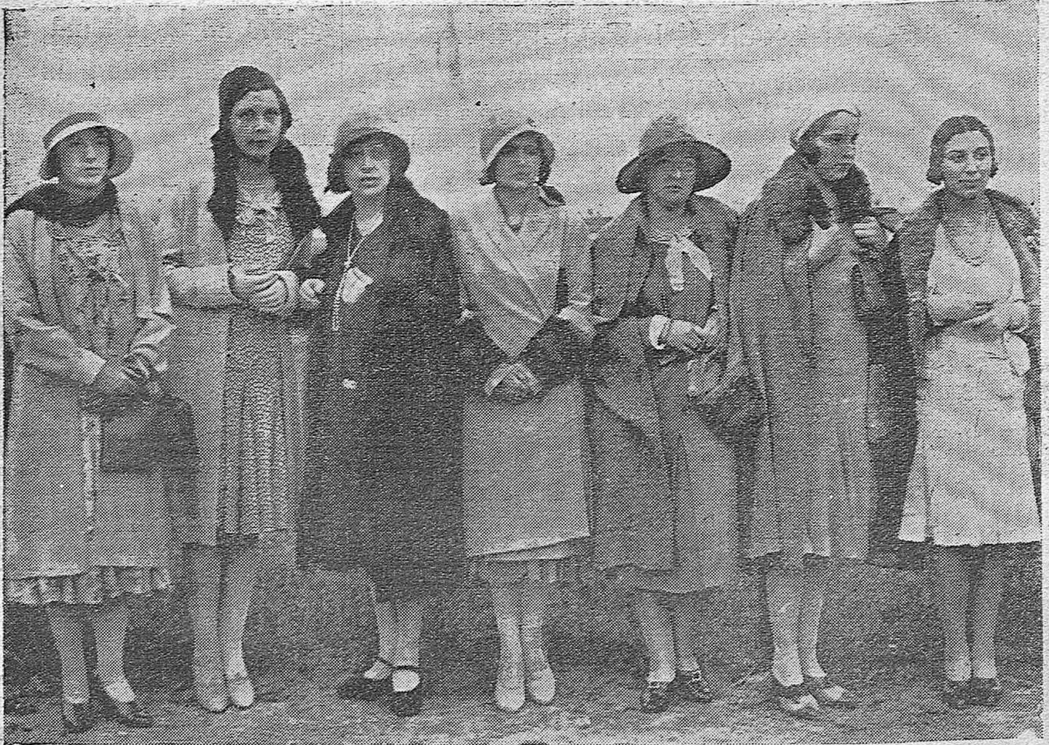
EN EL TIRO DE PICHÓN. —BELLÍSIMAS SEÑORITAS QUE ASISTIERON A LAS PRUEBAS DEL SEGUNDO DÍA.