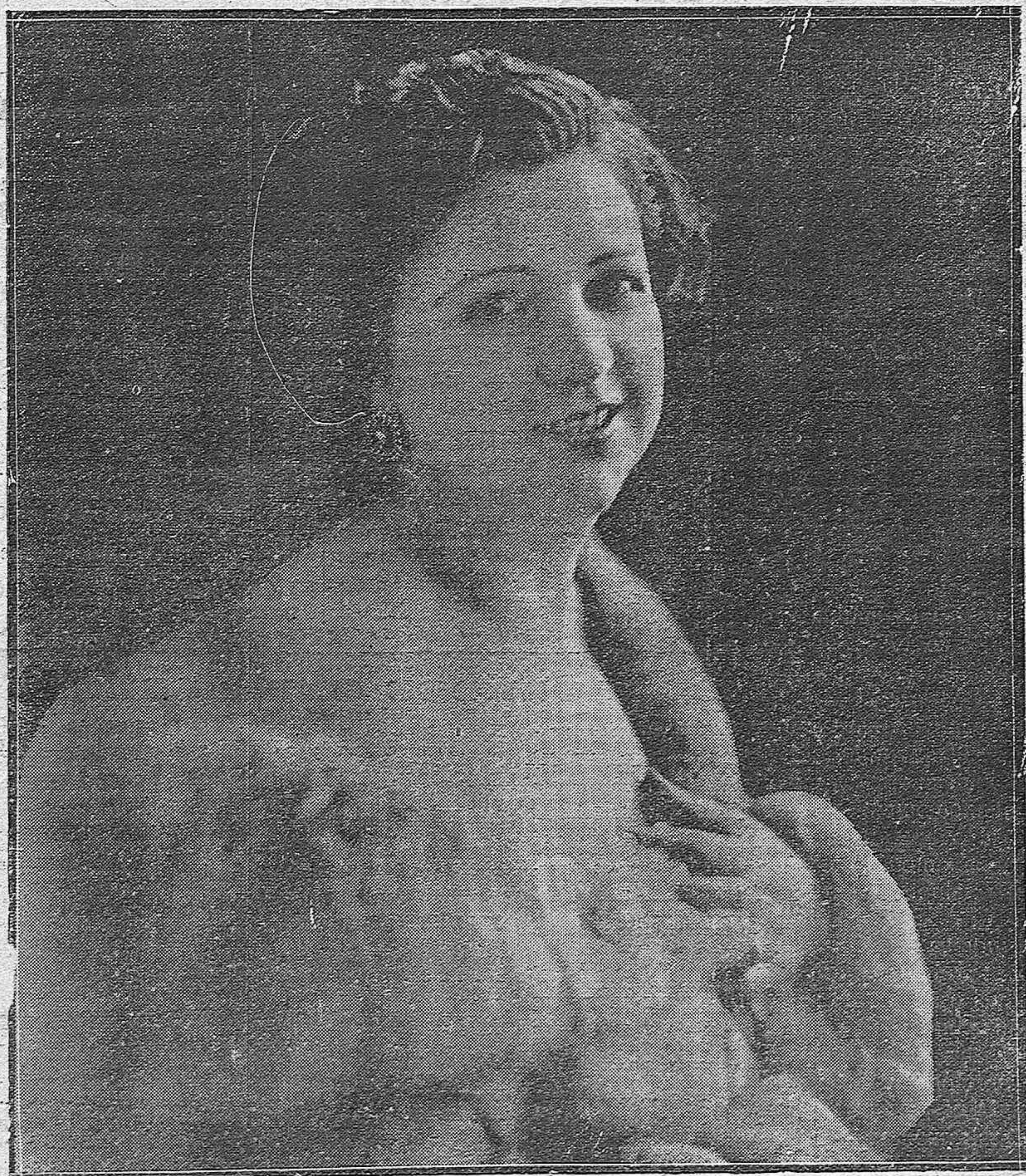
TARSILA URIBE, LA EMINENTE ACTRIZ DE COMEDIA. QUE EL SÁBADO PRÓXIMO CELEBRARÁ SU BENEFICIO EN EL PARQUE RECREATIVO