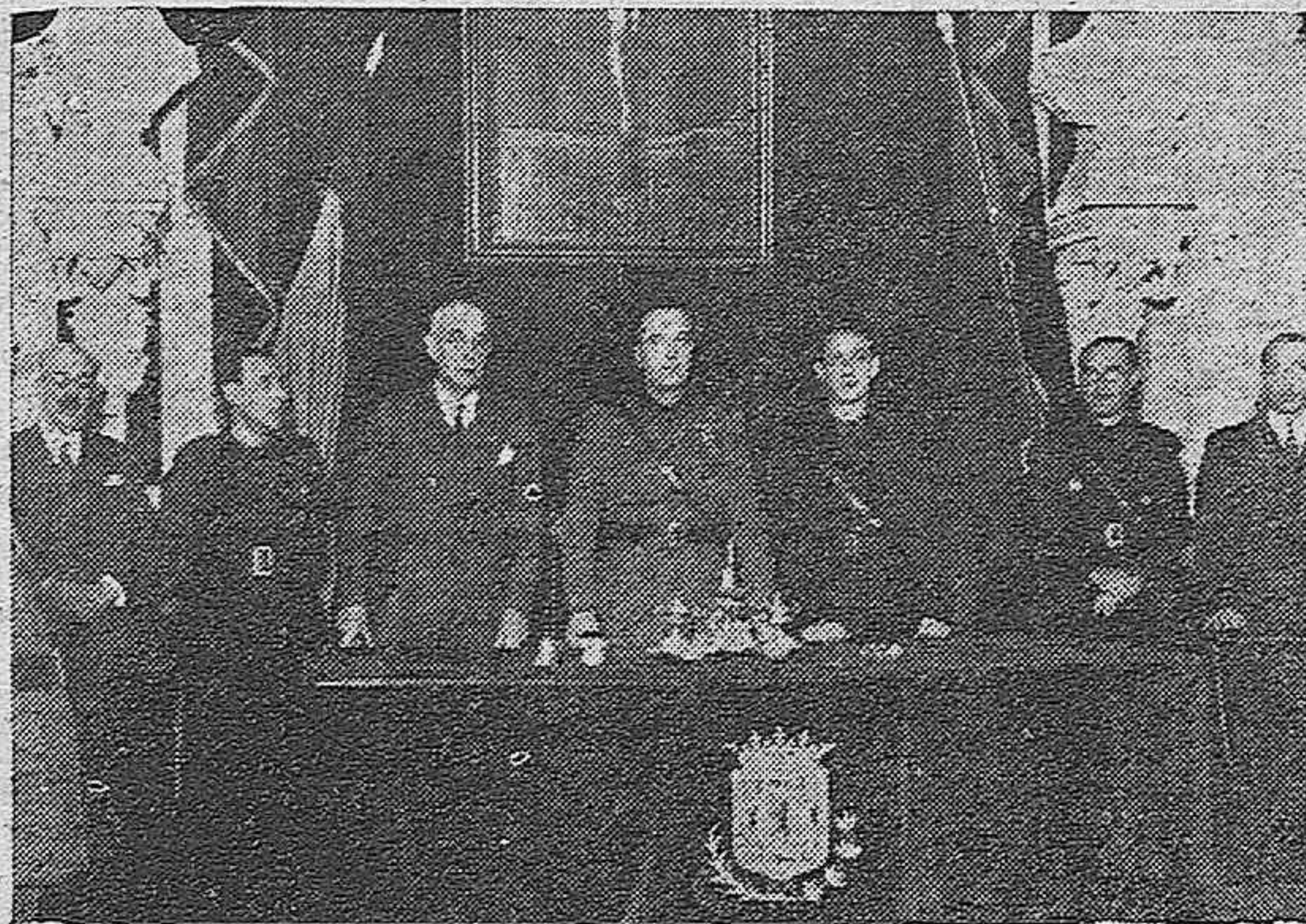
LA TOMA DE POSESION DE LA NUEVA GESTORA MUNICIPAL.—PRESIDENCIA DEL ACTO