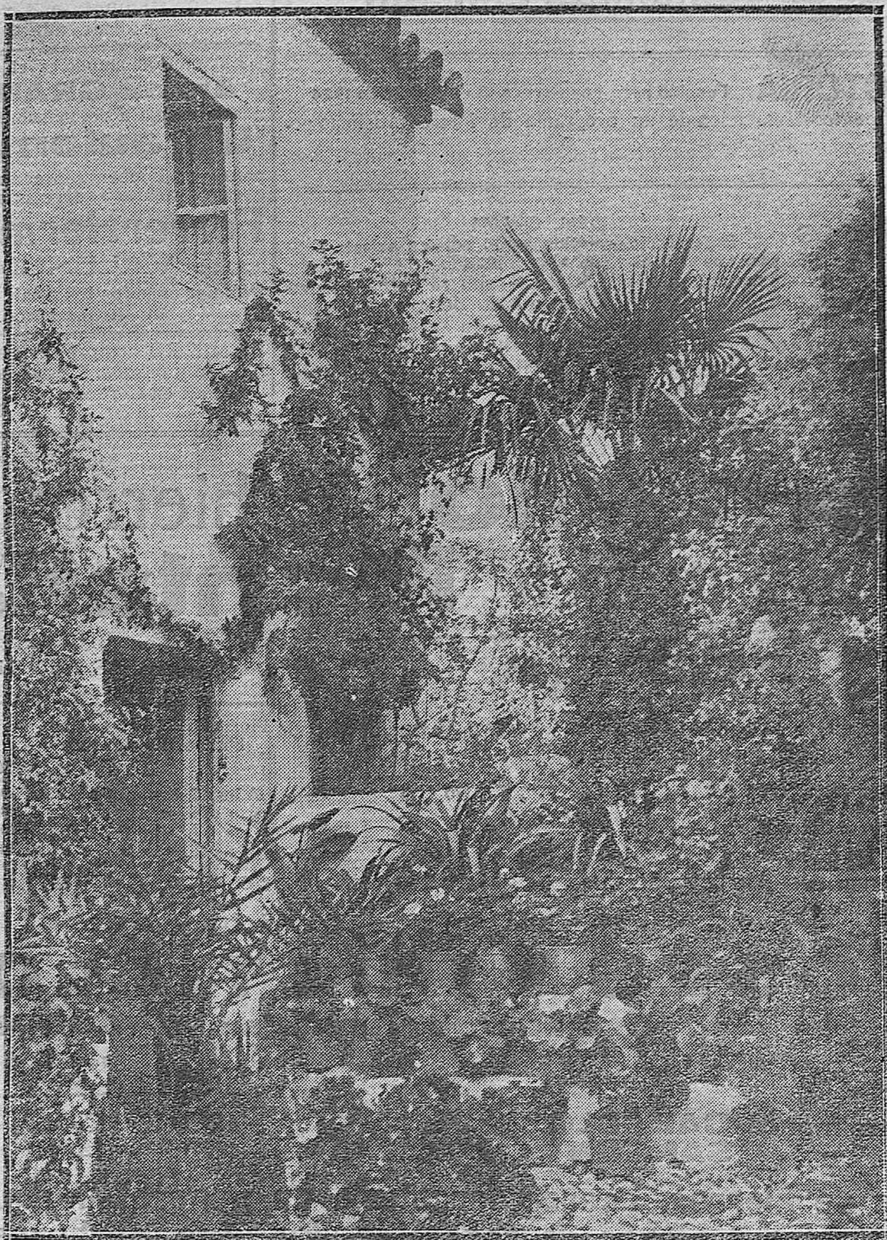
LOS PATIOS CORDOBESES.—UNO DE UNA CASA DE VECINOS DE LA CALLE DE ESCAÑUELA.