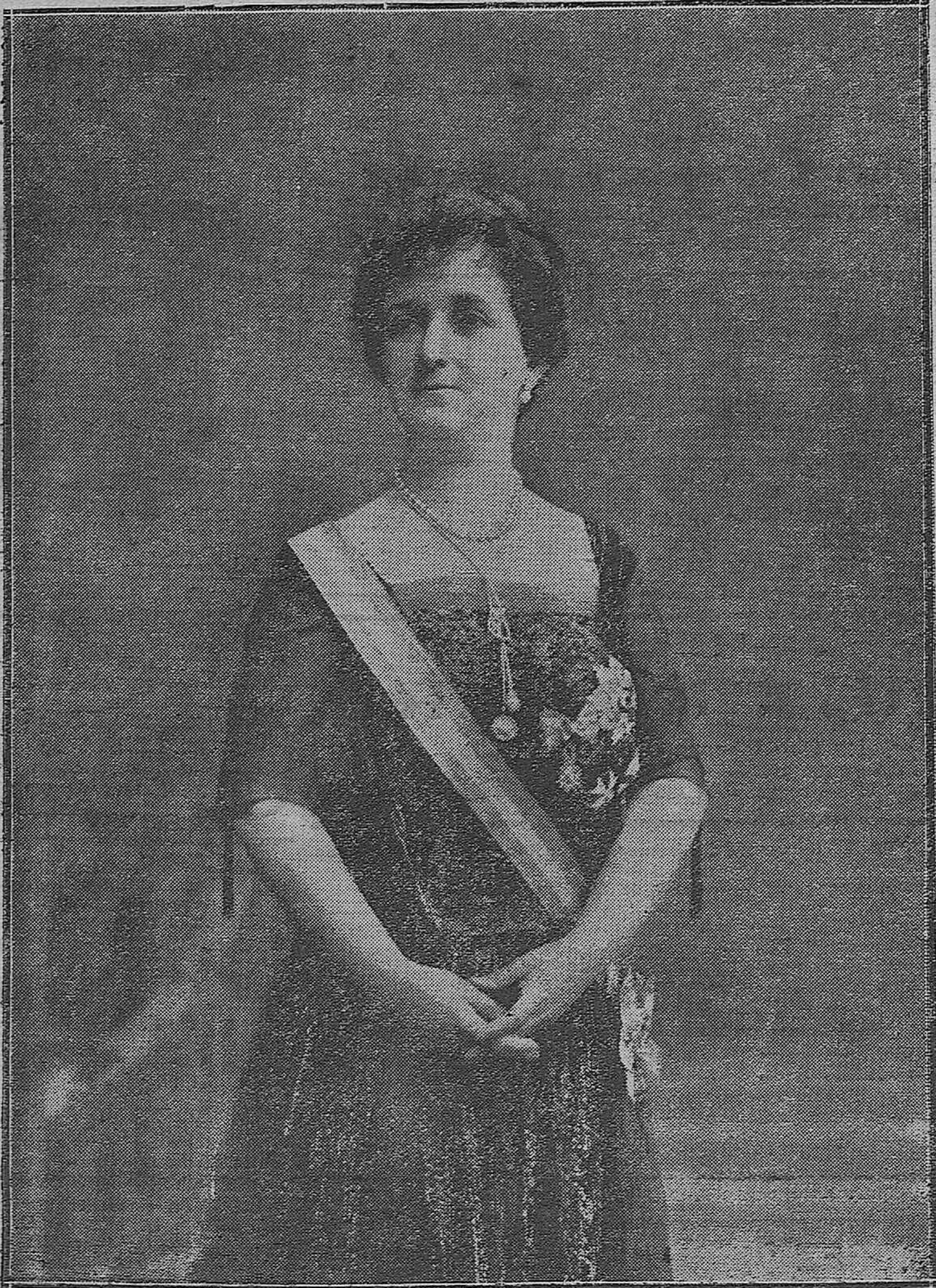
La Excmo. Sra. Condesa Viuda de Hornachuelos, presidenta de honor de la Cruz Roja de Córdoba, para la que ha sido solicitada la Cruz de Beneficencia por sus desvelos en pro de los humildes que sufren.