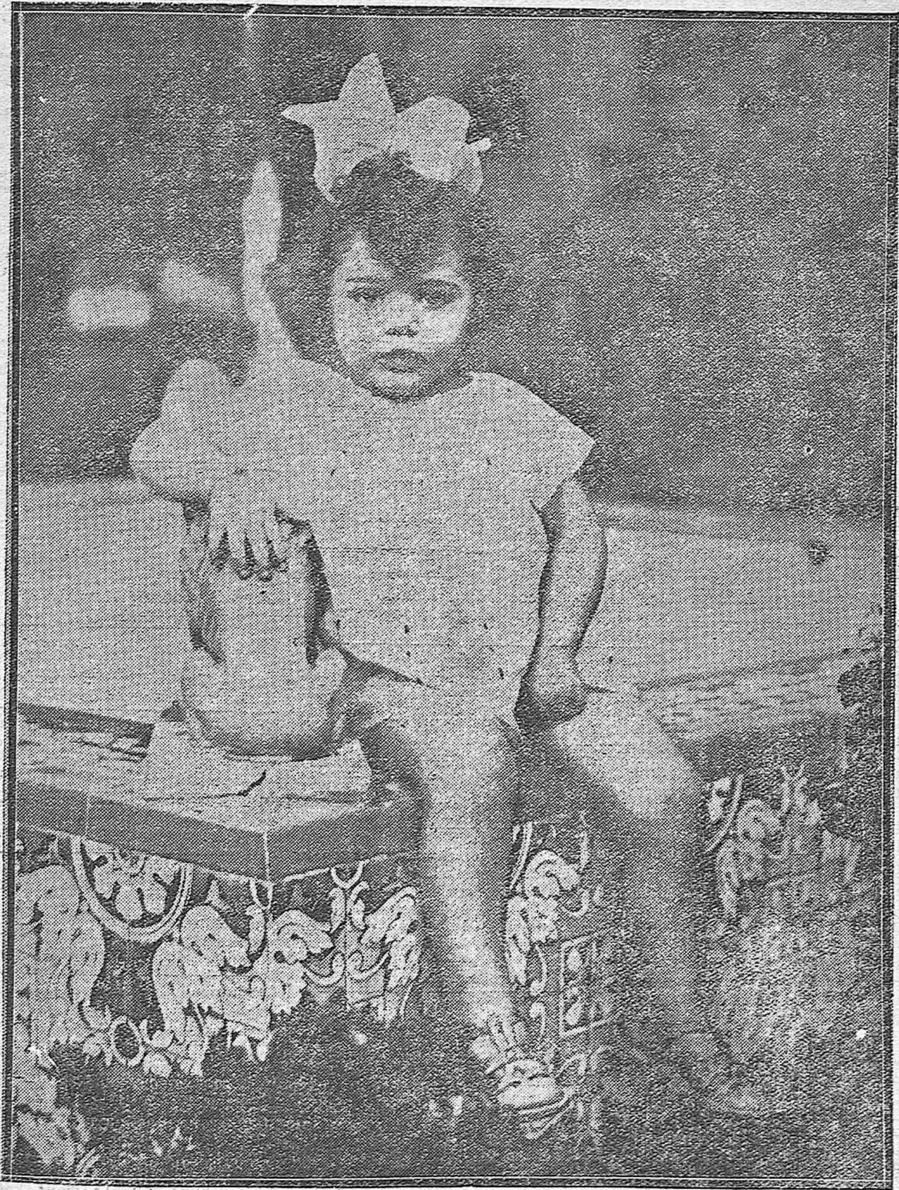
LOS NIÑOS DE CÓRDOBA.--Una encantadora y asidua concurrente a los jardines de la Agricultura, posando ante el objetivo de nuestro fotógrafo, en la fuente de los leones.