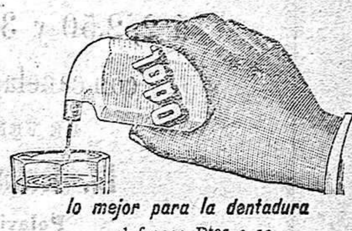
lo mejor para la dentadura el frasco Ptas 3.50