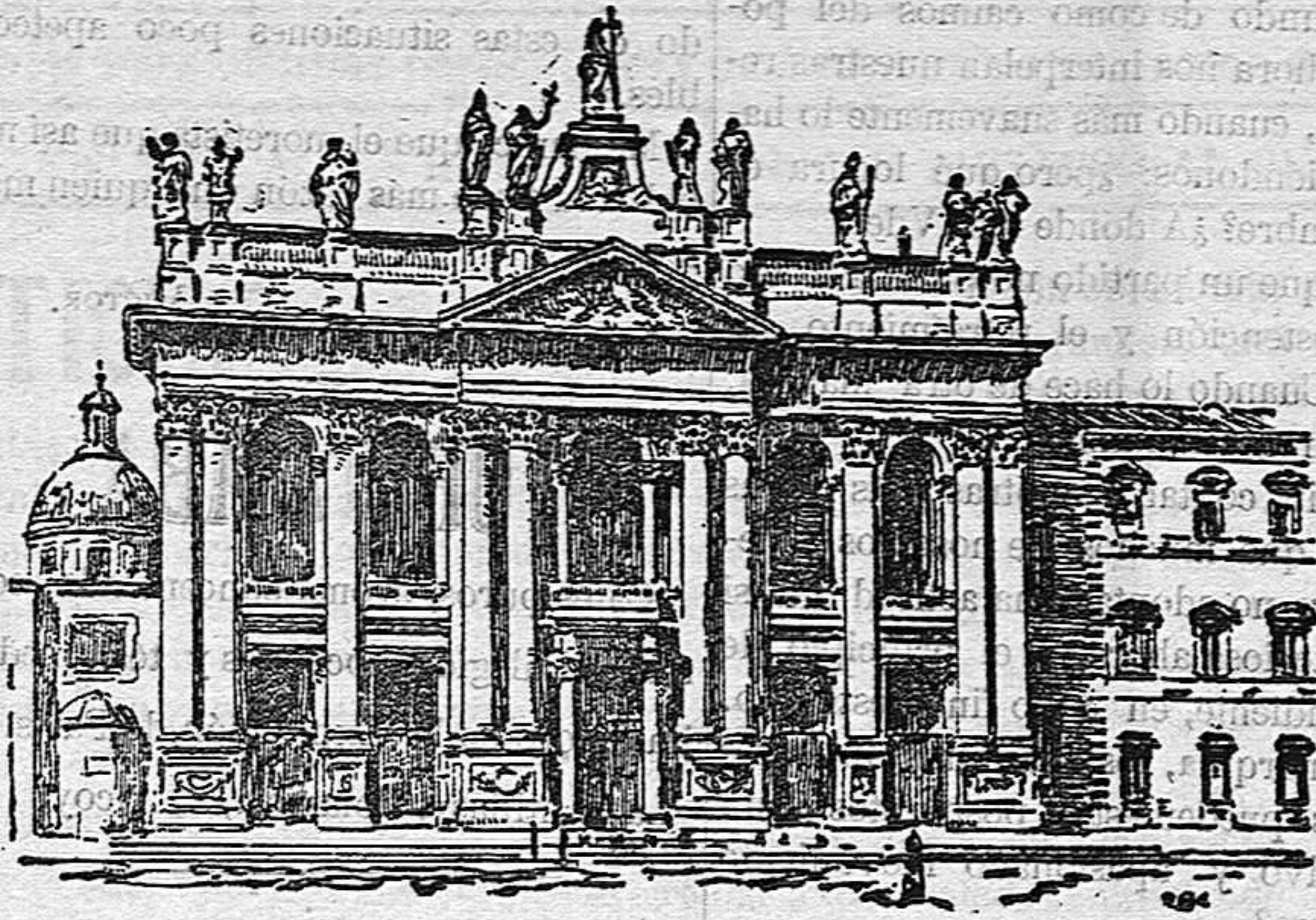
La Iglesia de San Juan de Letrán en Roma, á donde muy en breve y sin precisar fecha, para evitar manifestaciones favorables ó adversas al acto, serán trasladados los restos del Pontífice León XIII.

en la naturaleza misma de la sociedad, de la familia, y hasta del individuo, puesto que es innegable el derecho á la vida que les asiste y el amor á su existencia y conservación. El Estado puede ser enemigo de la región, ya por exceso, allí donde impere el cesarismo, ya por defecto, allí donde ejerza su influencia el liberalismo; pero la nación ó mejor dicho, el espíritu de una nación, como tal, favorece el ideal regionalista del propio modo que el ser humano, compuesto de alma y cuerpo, favorece la vida de cada uno de los órganos que lo integran.