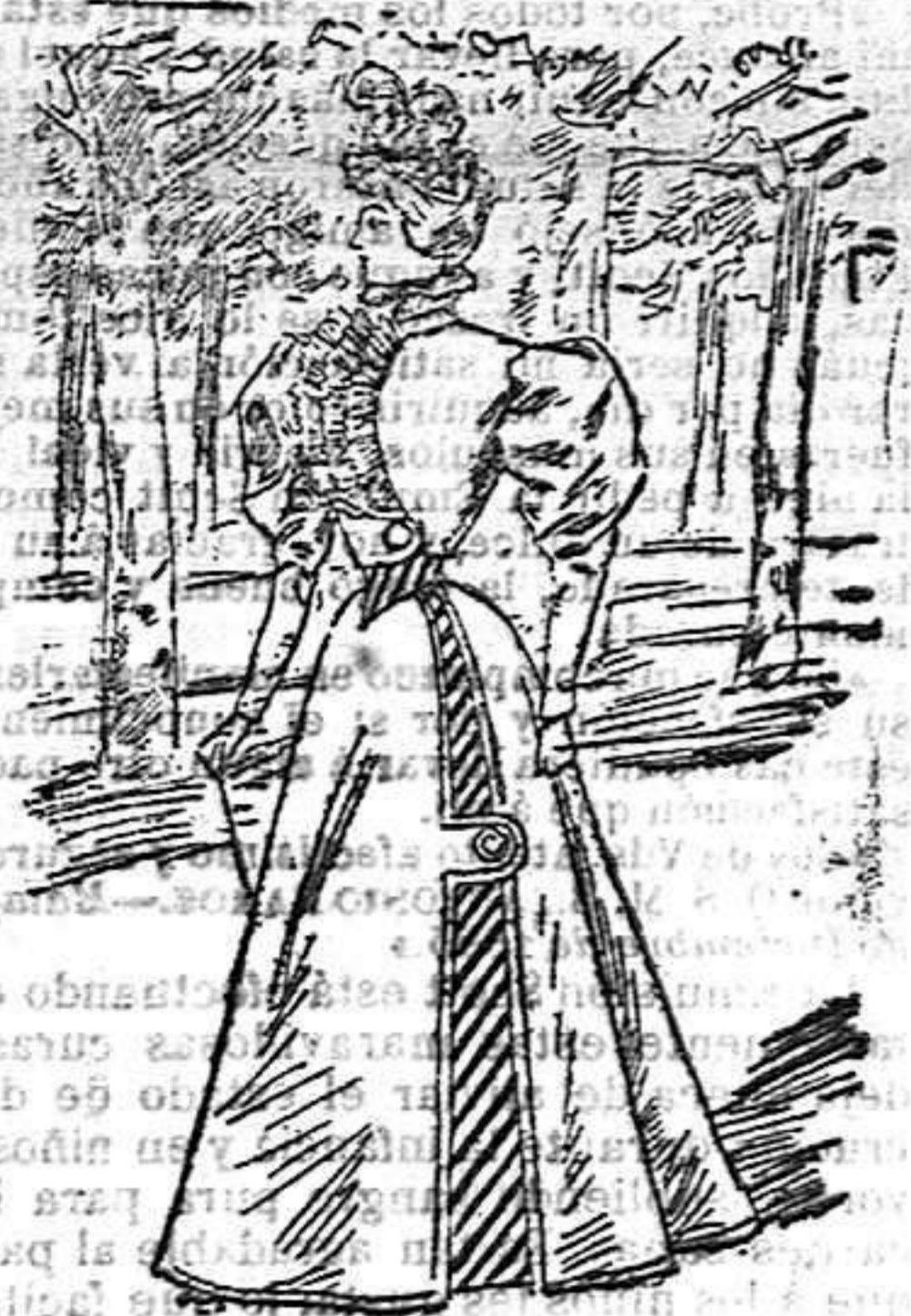
Vestido para paseo

De las formas modernas, abrochado al lado con dos botones fantasía; peto de seda plegada; cuello forrado de seda blanca, con lazada igual al de la fajita; Manga: estrecha formando bolla; abierta en la bocamanga y falda acompañada con tres volantes del mismo género.