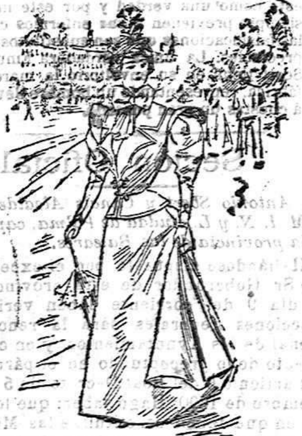
Vestido para paseo

De seda. Cuerpo ajustado formando pico en el delantero; espalda torera de seda, formando sol, con tres volantes, abrochada al lado con un botón; cuello alto y volante de gasa plegada; mangas estrechas, y falda en forma de campana, abierta al lado sobre una quilla de Pekín, y abrochada con una pata y un botón.