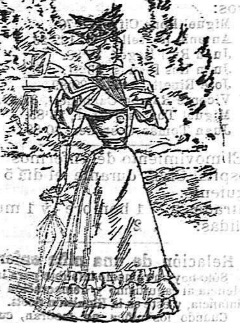
Vestido para señorita

De las formas modernas, abrochado al lado con dos botones fantasía; peto de seda plegada; cuello forrado de seda blanca, con lazada igual al de la fajita; Manga: estrecha formando bolla; abierta en la bocamanga y falda acompañada con tres volantes del mismo género.