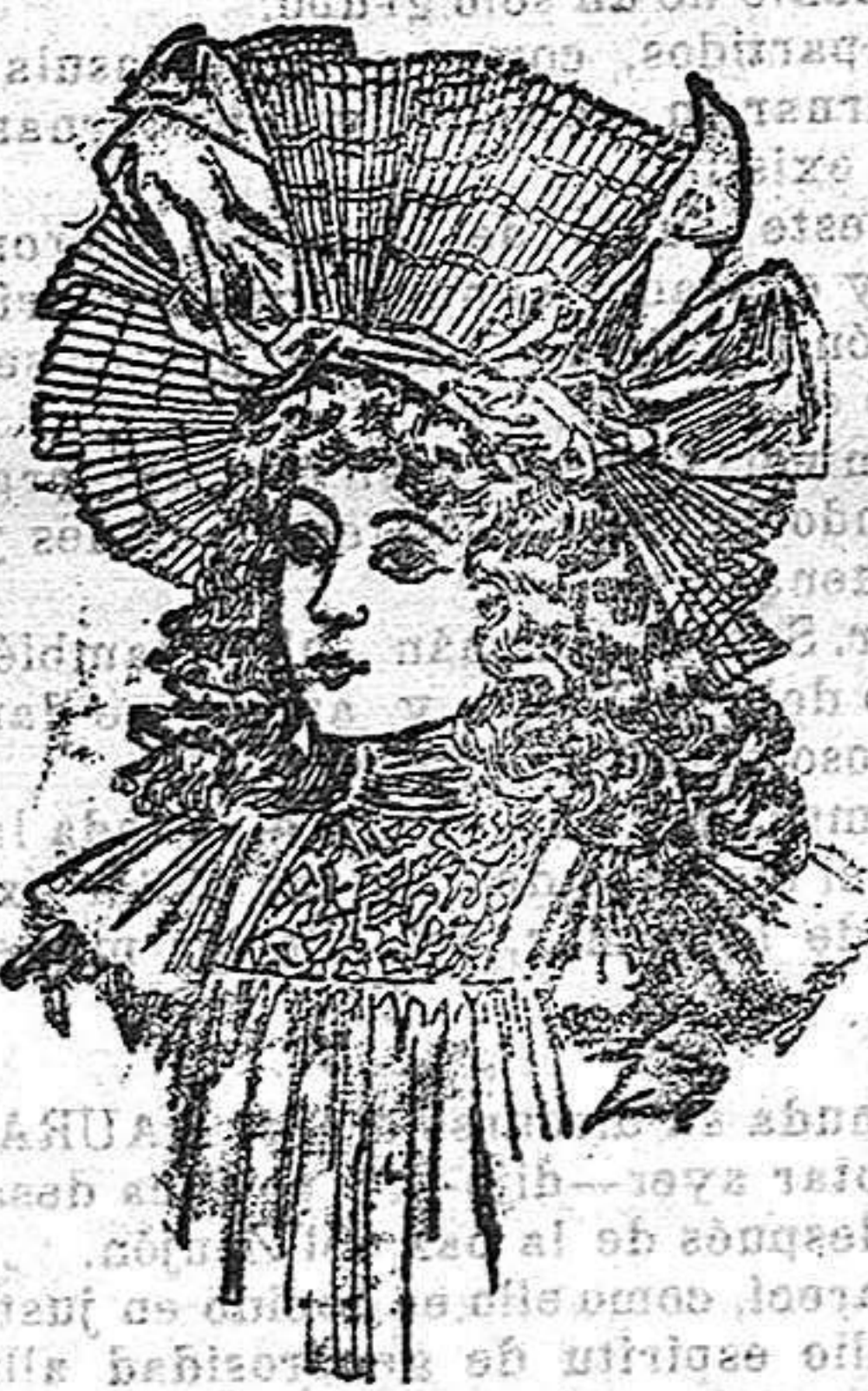
Sombrero de verano para niña. El caso de este bonito sombrero es de paja y el ala de nipsis plisado. Va adornado con cintas de color blanco.