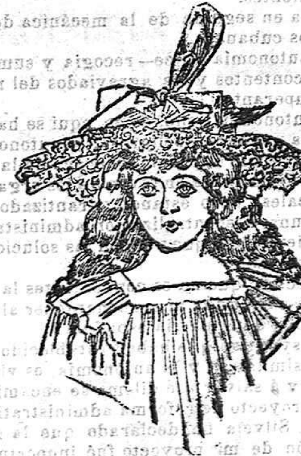
Sombrero para niña de 7 años. Este sombrero es de encaje y va adornado con una bonita cinta novedad.

Aquellas de nuestras lectoras que deseen detalles de los modelos de la presente revista, pueden escribir á la Sección de confecciones de los Grandes Almacenes de El Siglo , Barcelona; y recibirán gratis inmediata contestación.