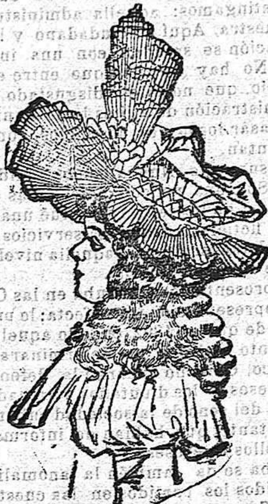
Sombrero para niña de 6 años. Es el caso de seda, en forma de boina, con el ala de gasa plisada. Va adornado con cinta y gasa.