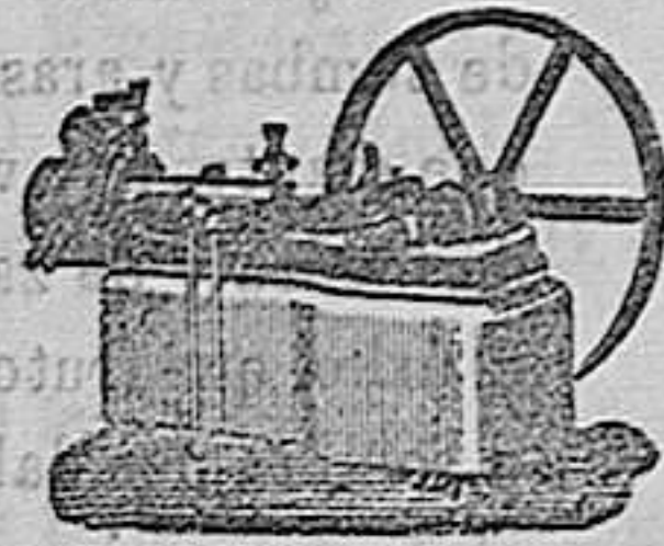
Máquina de vapor Horizontal.