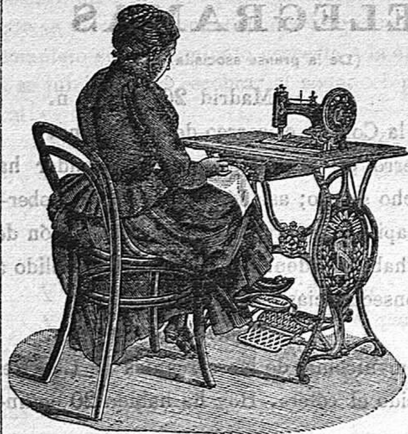
Nuevo, Práctico, Higiénico